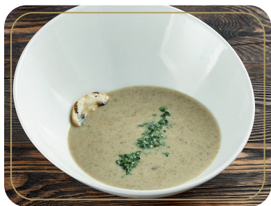
Крем-суп грибной 220 гр 420р