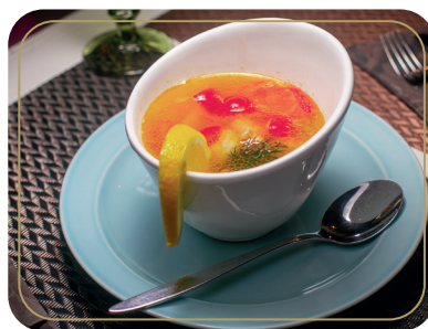
Уха из сёмги 250 гр 480р