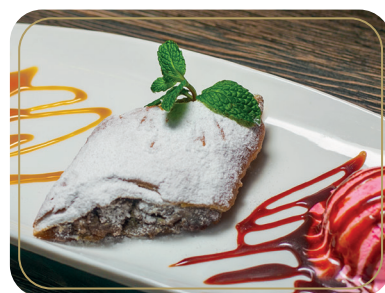
Яблочный штрудель 350р