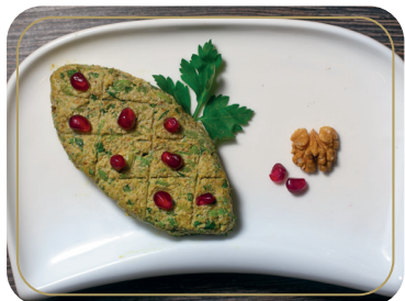
Пхали из стручковой фасоли 100 гр 220р