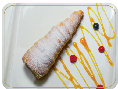
Трубочки с заварным кремом 250р