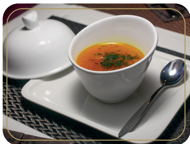
Суп-лапша с курицей 250 гр 350р