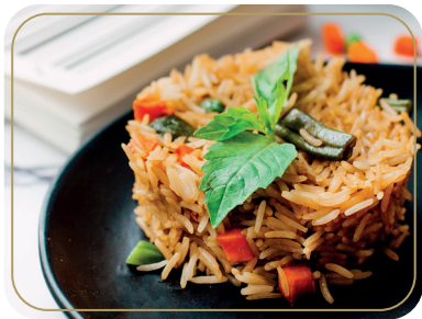
Рис с овощами