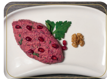
Пхали из свеклы 100 гр 220р

Рулетики из баклажанов с сыром и зеленью