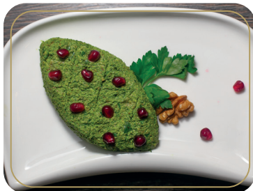
Пхали со шпинатом 100 гр 220р