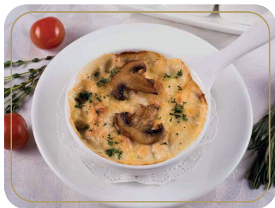
Жульен с шампиньонами