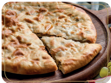
Кубдари пирог с мясом 500 гр 550р