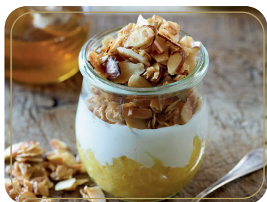
Мацони с медом и грецким орехом