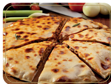
Лобиани хачапури с фасолью 400 гр 420р