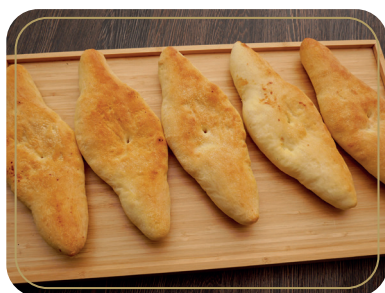
Лаваш 150 гр 90р