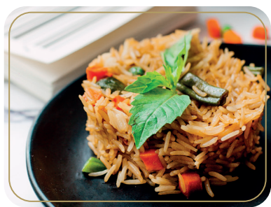
Рис с овощами