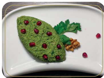
Пхали со шпинатом 100 гр 220р