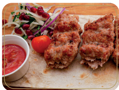
Люля-кебаб из курицы