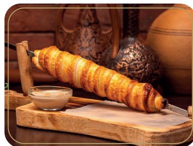
Хачапури на вертеле 200 гр 380р