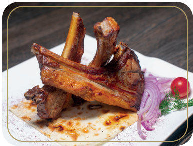
Корейка из баранины