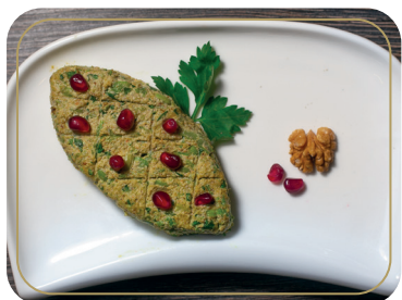
Пхали из стручковой фасоли 100 гр 220р