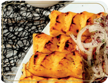
Люля-кебаб из картофеля