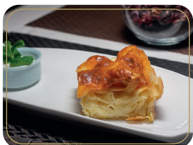
Ачма домашний слоеный пирог с сыром сулугуни 220 гр 350р