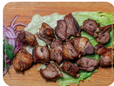
Шашлык из баранины