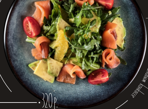
Руккола с семгой и апельсиновым конкассе