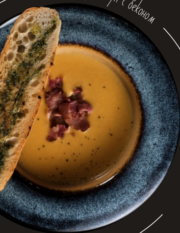
Овощной крем-суп с беконом