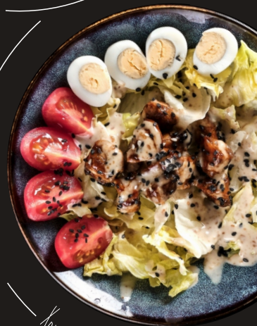
Хрустящий Айсберг с курицей