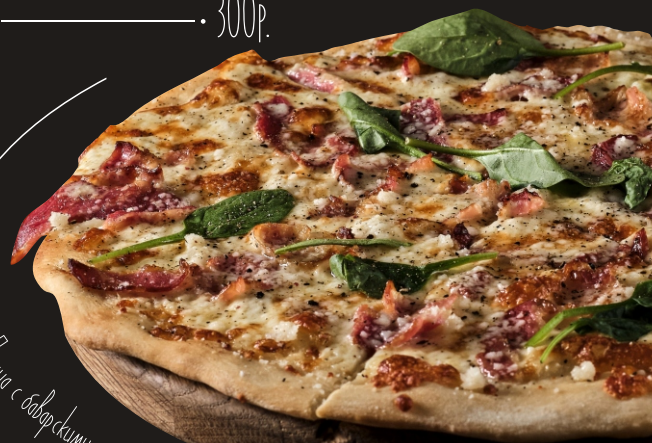
Пицца с баварскими сосисками

Сырная лепешка с Моцареллой 400гр. ————— • 300р.