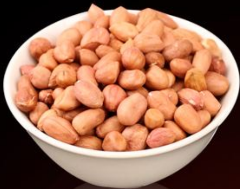
Арахис 100г 150р