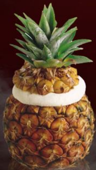
Мороженое «Ананас» 300р