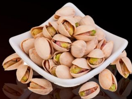
Фисташки 100г 250р