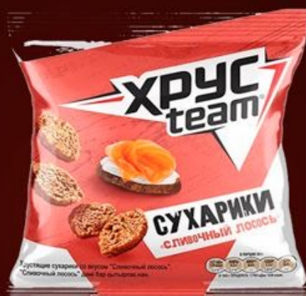
Хрустим 105г 150р