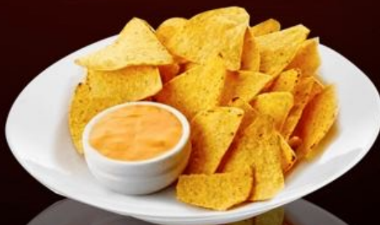
Начос 150г 150р