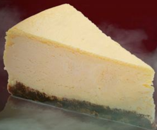
Чизкейк Нью-Йорк 220р