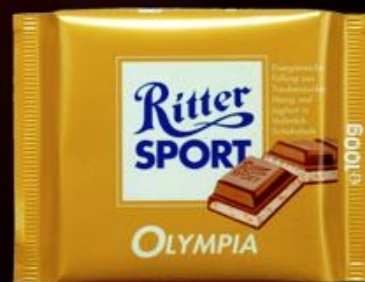
Ritter Sport 100г 250р