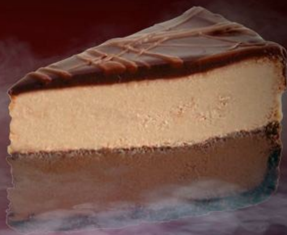
Чизкейк «Три шоколада» 250р