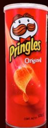
Принглс 165г 250р