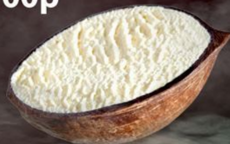
Мороженое «Кокос» 300р