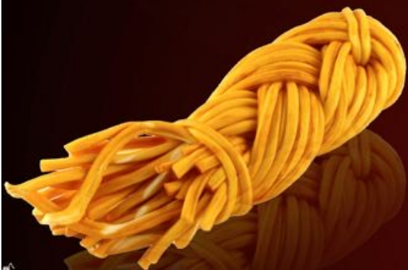
Сыр 100г 200р