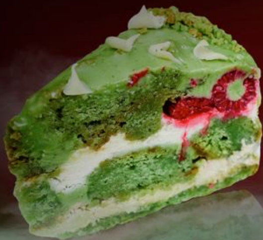
Фисташковый с малиной 250р