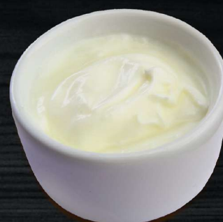
МАЙОНЕЗ MAYONNAISE 50 P