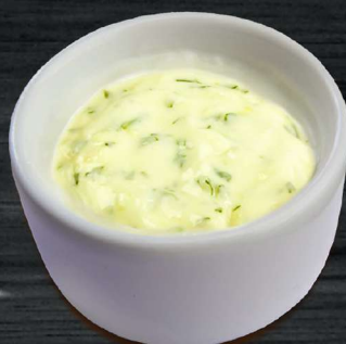
ЧЕСНОЧНЫЙ GARLIC CREAM 70 P