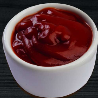
КЕТЧУП KETCHUP 50 P