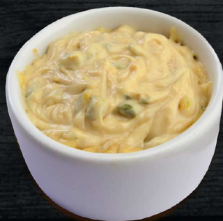
СЫРНЫЙ ФИРМЕННЫЙ CHEESE CREAM 80 P