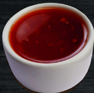
АДЖИКА ADJIKA 60 P