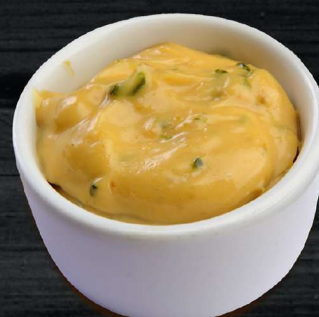
ТАР-ТАР TAR-TAR CREAM 60 P