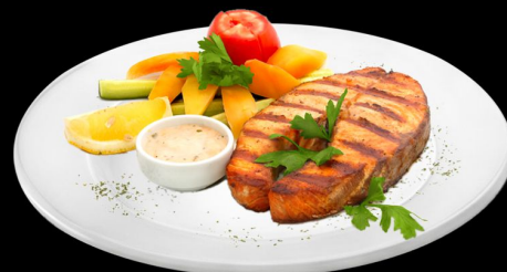
Сёмга На гриле 280г. 620р. с картофелем фри