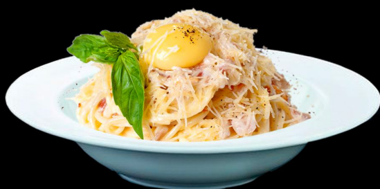
Корбонара 250г. 290р. домашняя паста с беконом в сливочном соусе, сыр моцарелла