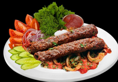
Кебаб из баранины 360г. 510р. баранина, салат, картофель фри, соус аджика