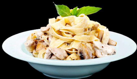
Феттучини 250г. 290р. с курицей и грибами филе куриное, паста Италия, лук репчатый, специи, сыр Пармезан.