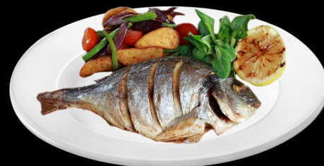
Дорадо 250г. 620р.