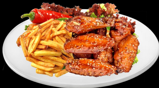
Крылышки в остром соусе 300г. 360р. куриные крылышки со специями, подается с салатом, картофелем фри