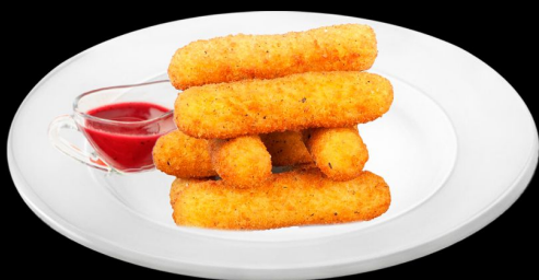
Сырные палочки 220г. 290р.