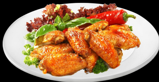
Крылышки на углях 300г. 360р. куриные крылышки со специями, подается с салатом, картофелем фри