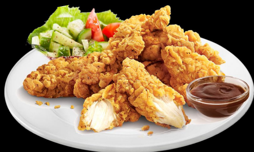
стрипсы 220г. 380р.