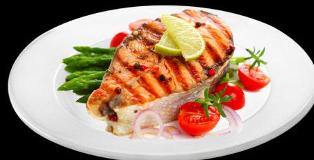
Сёмга по экзотика 250г. 620р. филе семги, перец болгарский, маслины, томат черри, морковь