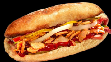
Цезарь 200г. 150р. сэндвич с куриным филе салатом, сол.огурцом, чесночным соусом,