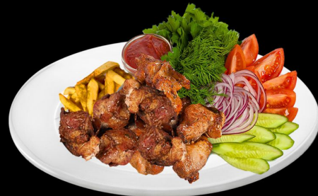
Шашлык из баранины 360г. 590р. баранина, салат, картофель фри, соус аджика