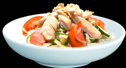
Салат Куриный 150г. 270р. курица, огурцы помидоры черри, грибы, лук, перец, майонез