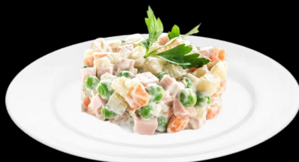
Салат «Столичный» 200г. 270р. курица, яйцо, картофель, морковь, сол.огурец, зел.горошек, майонез, зелень