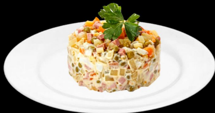
Салат «Оливье» 200г. 270р. колбаса, яйцо, картофель, морковь, сол.огурец, зел.горошек, майонез, зелень