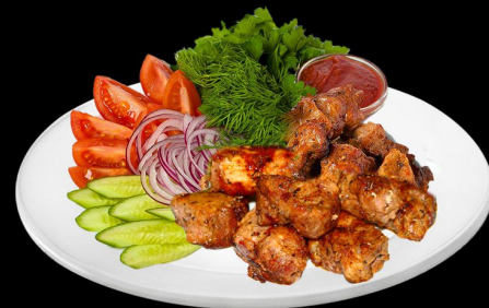
Шашлык из телятины 360г. 590р. телятина, салат, картофель фри, соус аджика