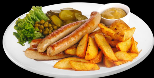
Баварский гриль 220г. 350р.