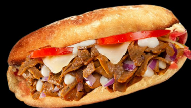
Мексикано 150 г. 170р. сэндвич с кусочками говядины, кукурузой, овощами, салатом, сыром моцарелла и мексиканским острым соусом