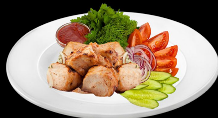
Шашлык из курицы 360г. 490р. курица, салат, картофель фри, соус чесночный