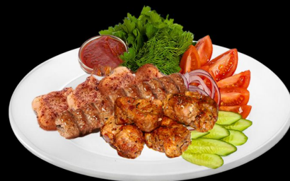
Ассорти шашлыков 350г. 850р. Шашлык куриный, люля кебаб, шашлык из телятины, подается с салатом, картофелем фри и соусом аджика