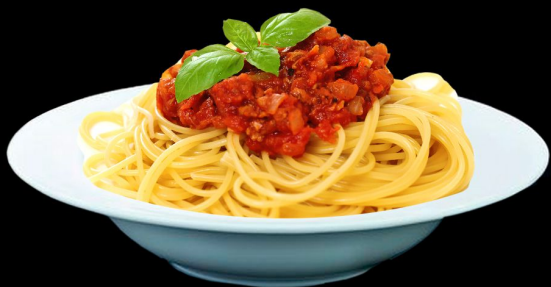
Спагетти болоньез 250г. 290р. спагетти, фарш из говядины, соус томатный, базилик, сыр пармезан