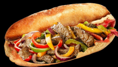
Фахита мясная 200г. 150р. сэндвич с кусочками говядины, болгарским перцем, луком, сол.огурцом, сыром моцарелла, салатом и фирменным соусом с гарниром 300г. 270р.