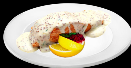
Сёмга де пари 250г. 620р. филе семги, соус сливочный, с креветками, икра