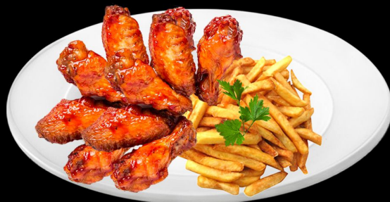
Крылышки во фритюре 300г. 360р. куриные крылышки со специями, подается с салатом, картофелем фри и чесночным соусом