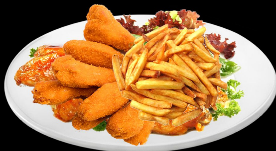
Крылышки в панировке 300г. 360р. куриные крылышки со специями, подается с салатом, картофелем фри