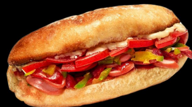
Куриный 200г. 150р. сэндвич с куриным филе салатом, сол.огурцом, чесночным соусом, с гарниром 300г. 240р.