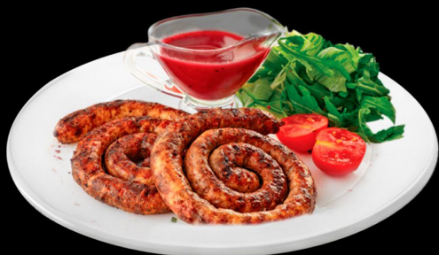
Микс гриль 220г. 470р.