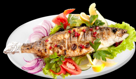
Форель гривен 250г. 620р. запеченная форель, картофель тимьян, маслины, томат черри