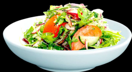
Салат Мексиканский 150г. 270р. авокадо, помидоры, кукуруза красная фасоль, оливковое масло соус мексиканский