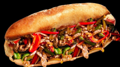
Фахита куриная 200г. 150р. сэндвич с кусочками курицы, болгарским перцем, луком, сыром моцарелла, сол.огурцом, салатом и фирменным соусом с гарниром 300г. 270р.