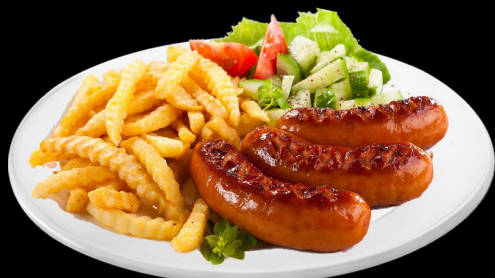
Колбаски гриль 220г. 340р.