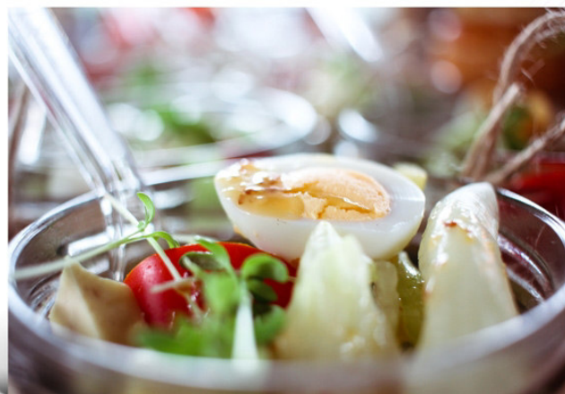
Салат Овощное Гурме