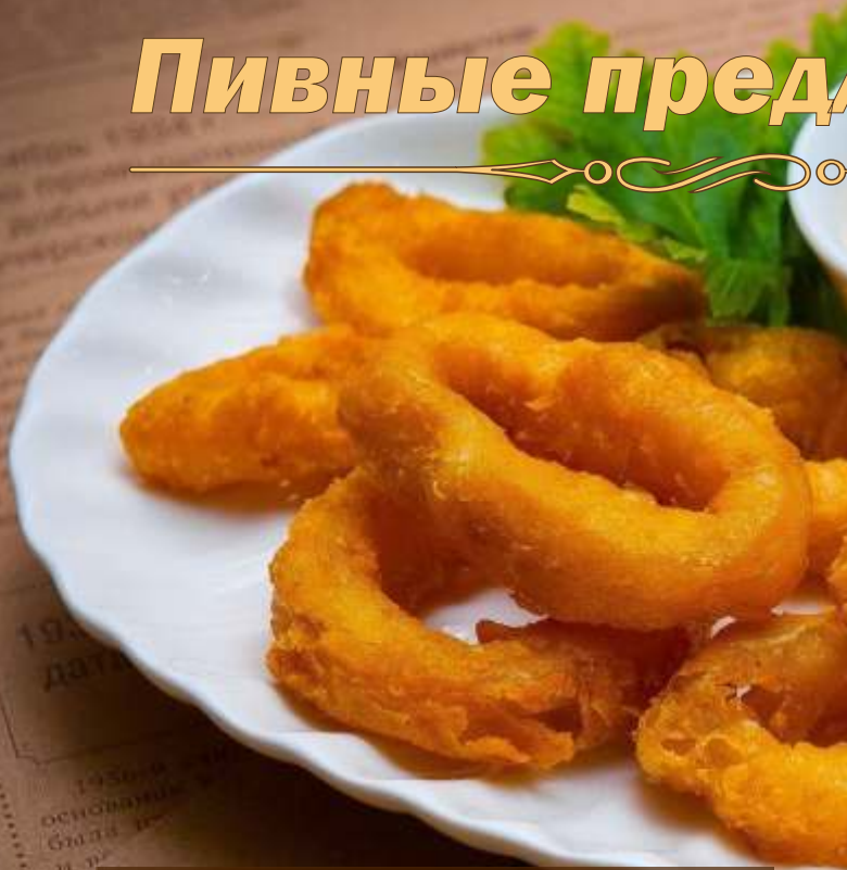
Кальмар в кляре