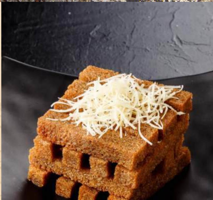
Чесночные гренки под сыром «Пармезан»