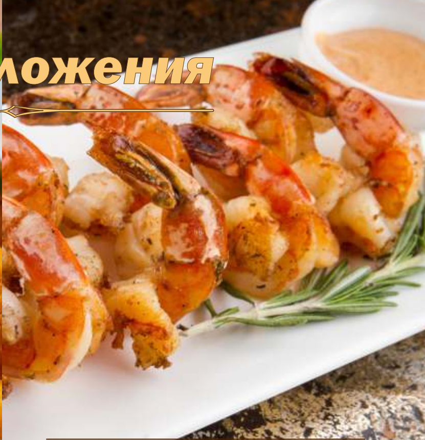
Жареные креветки в соусе барбекю