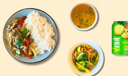
Рис с говядиной Бульон Салат Сок вьетнамский