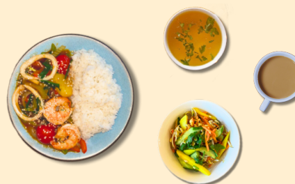
Рис с морепродуктами Бульон Салат Кофе вьетнамский 3 в 1