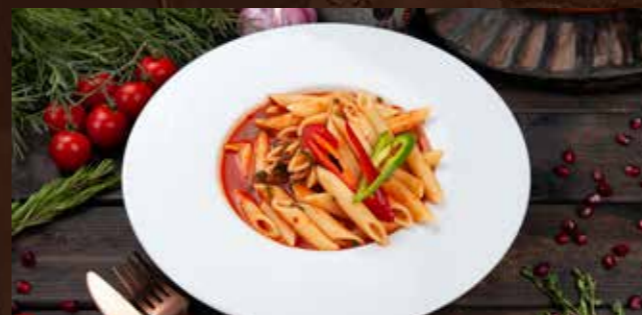
Злая паста 720р пене с острым перцем в томатном соусе с пармезаном