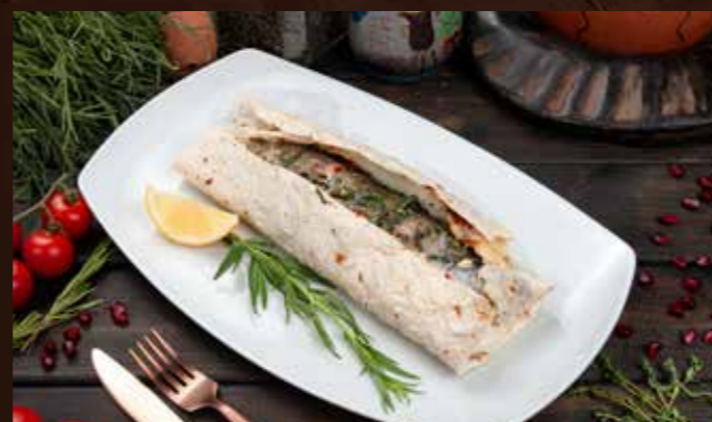
Калмахи 990р Форель запеченная в лаваше с ароматными грузинскими травами