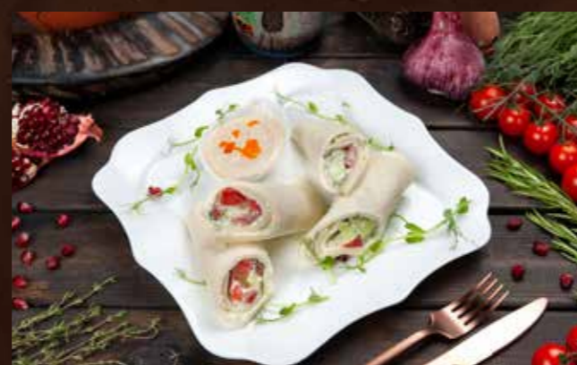
Грузинские роллы 230гр 840 Р Тонкие листья сыра сулгуни с творожной начинкой фаршированные томатами, огурцом, зеленью, с соусом из грецких орехов