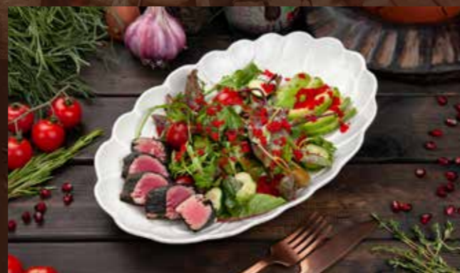
Де Туно 250гр 820 Р микс салатов, тунец обжаренный, каперсы, авокадо, свежие огурцы, икра тобико