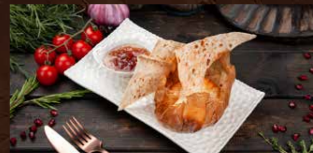
Фондю по-грузински 770р Запеченный сыр с розовым вареньем, и хрустящими тостами