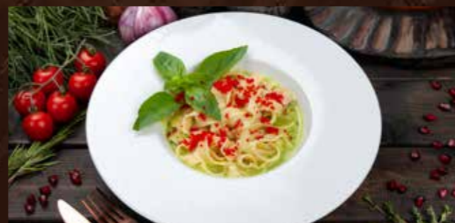
Черноморский Бриз 840р Фетучини с семгой, с сливочным соусом из базилика, и копченым сулгуни