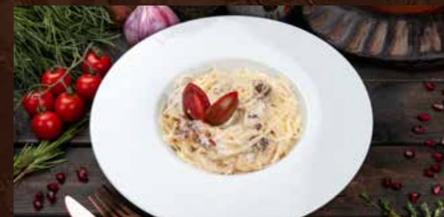
Спагетти по-рачински 730р паста с ветчиной "лори", в сливочном соусе