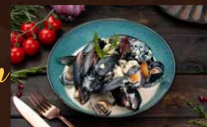
Батумский Привет 500 гр 1180р Черноморские мидии, в соусе из грузинского сыра "Дамбл-Хачо"