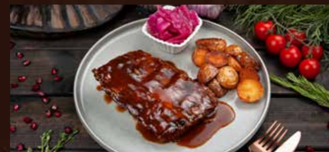
Некнеби "Сванури" 890р томленые в тёмном пиве свиные ребрышки, с молодым картофелем и гурийской капустой