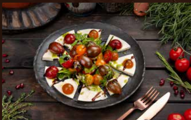
Самеба 250гр 690 Р Три вида томатов в пикантном соусе из зеленой аджики, на сырном плато