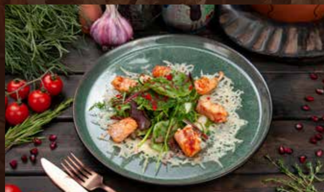
Арго 250гр 880 Р хрустящая корзина из пармезана, свежие листья салатов, киноа, черри, огурцы, семга, икра тобико