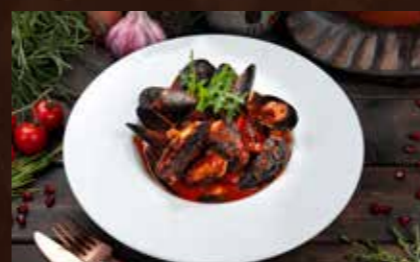
Черноморские мидии в соусе сацебели 500гр 1080р