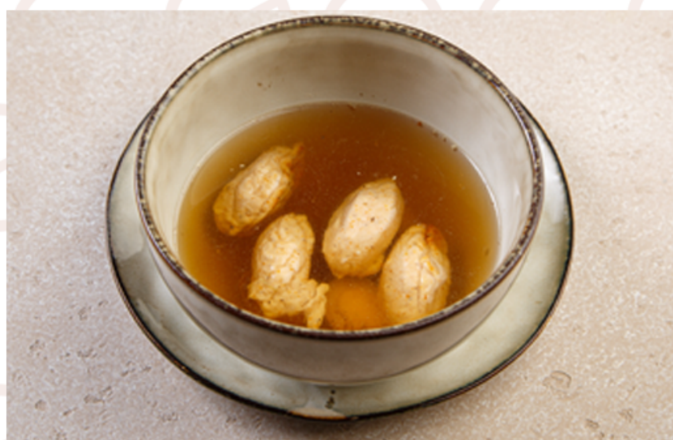
Куриный суп с ньокками (300гр)

(лосось/морковь/лук порей/сливки/ сыр сливочный/соль/перец)