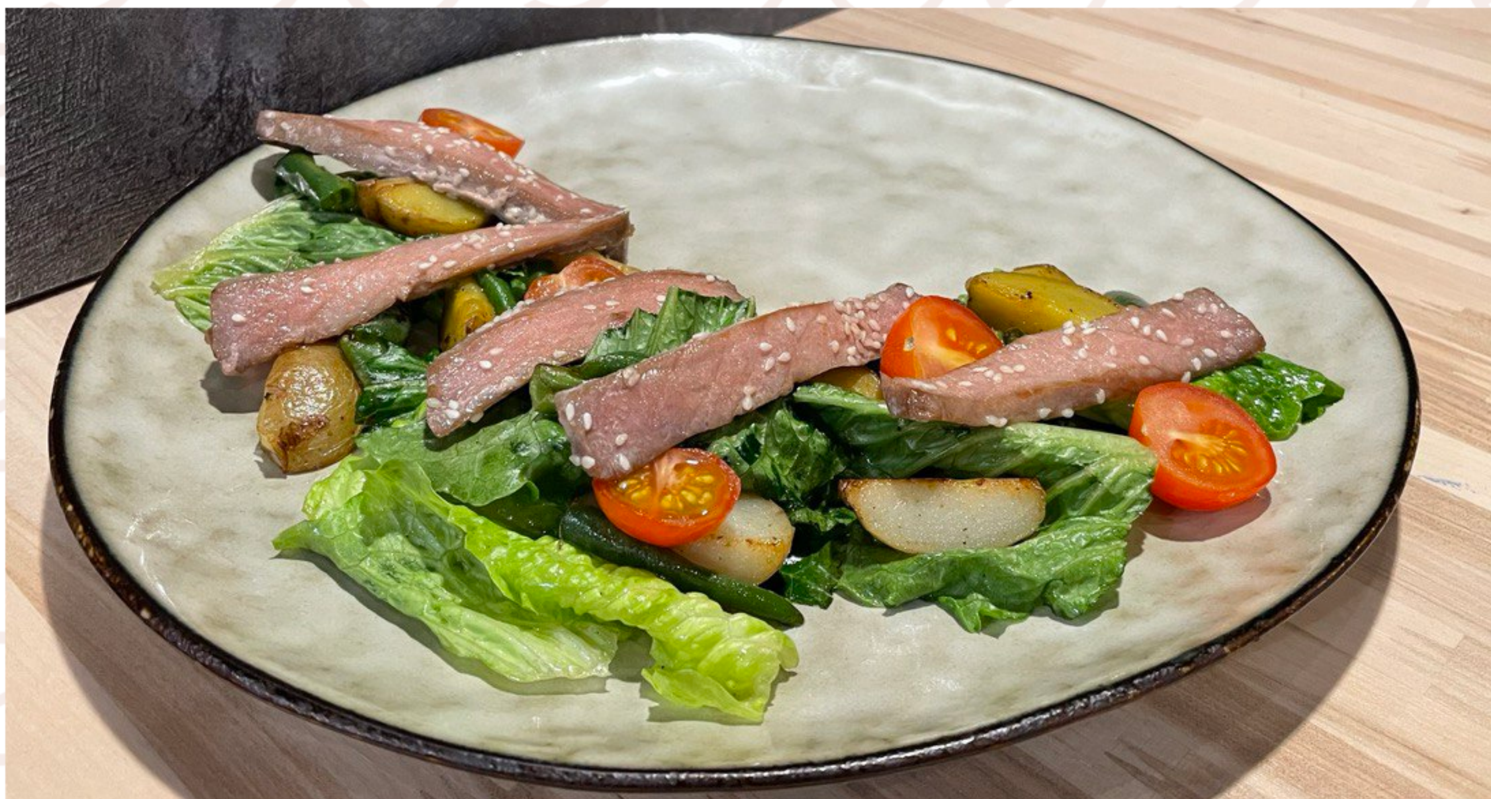
Нисуаз с тунцом (250гр)

ИП Дубов Е.К. ИНН: 132609765403 ОГРН: 312132619100034