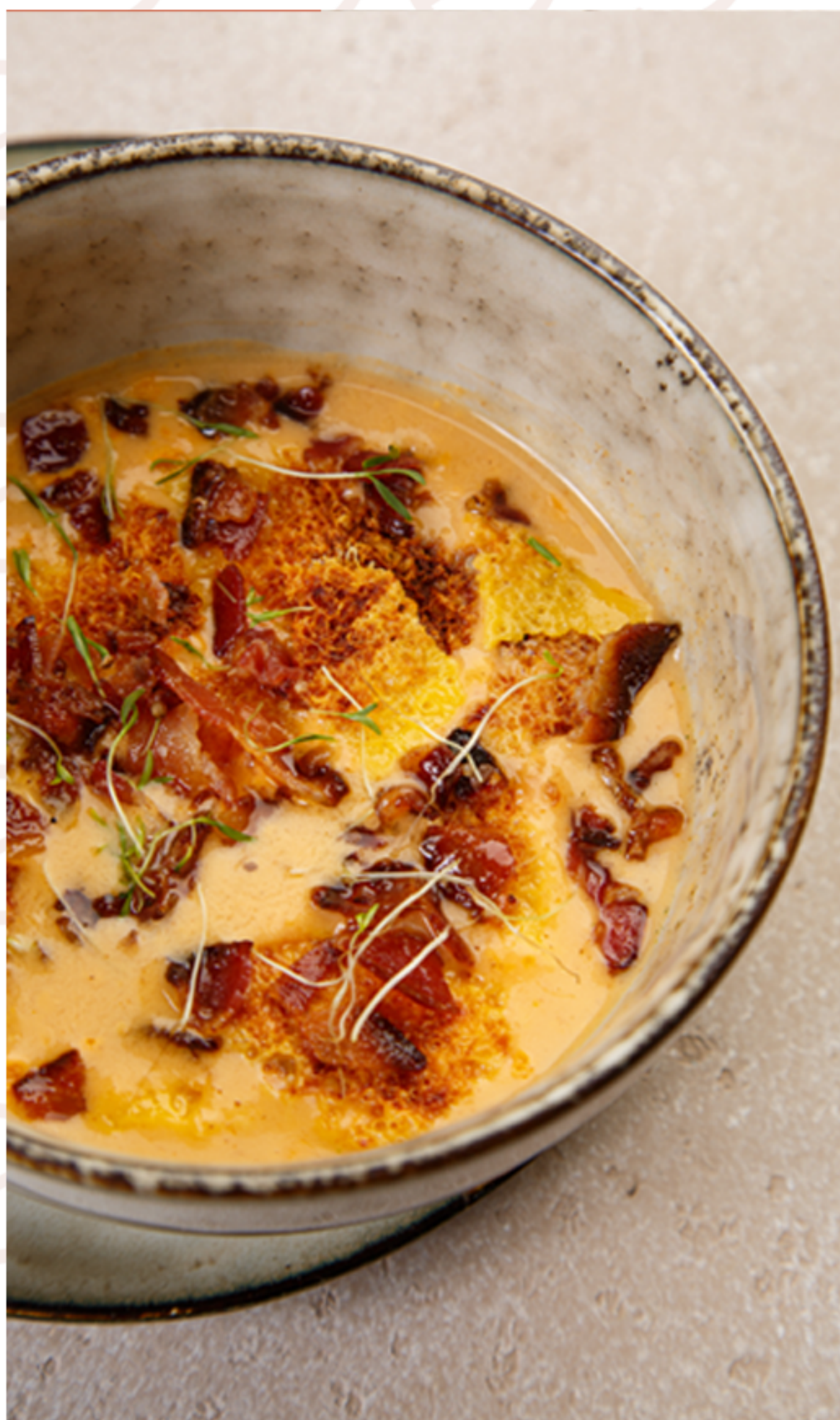
Крем-чеддер с чипсами (320гр)

ИП Дубов Е.К. ИНН: 132609765403 ОГРН: 312132619100034