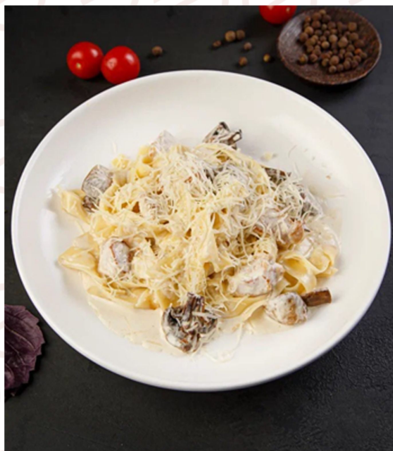
Фетучини с грибами и курицей 530₽ (280гр)

(паста/креветки/кабачки/томатная паста/сливки/пармезан/зелень)