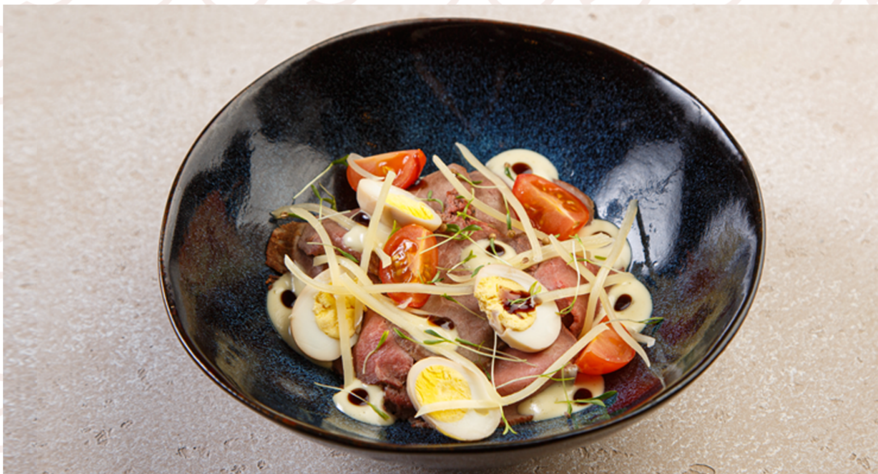
Салат с ростбифом и соусом тунца (200гр)

ИП Дубов Е.К. ИНН: 132609765403 ОГРН: 312132619100034