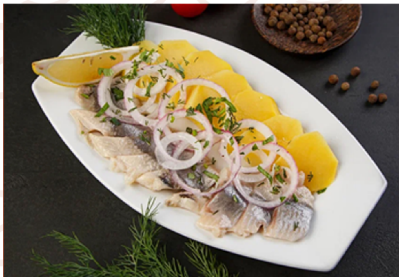
Сельдь с/с с картофелем (130гр)

ИП Дубов Е.К. ИНН: 132609765403 ОГРН: 312132619100034