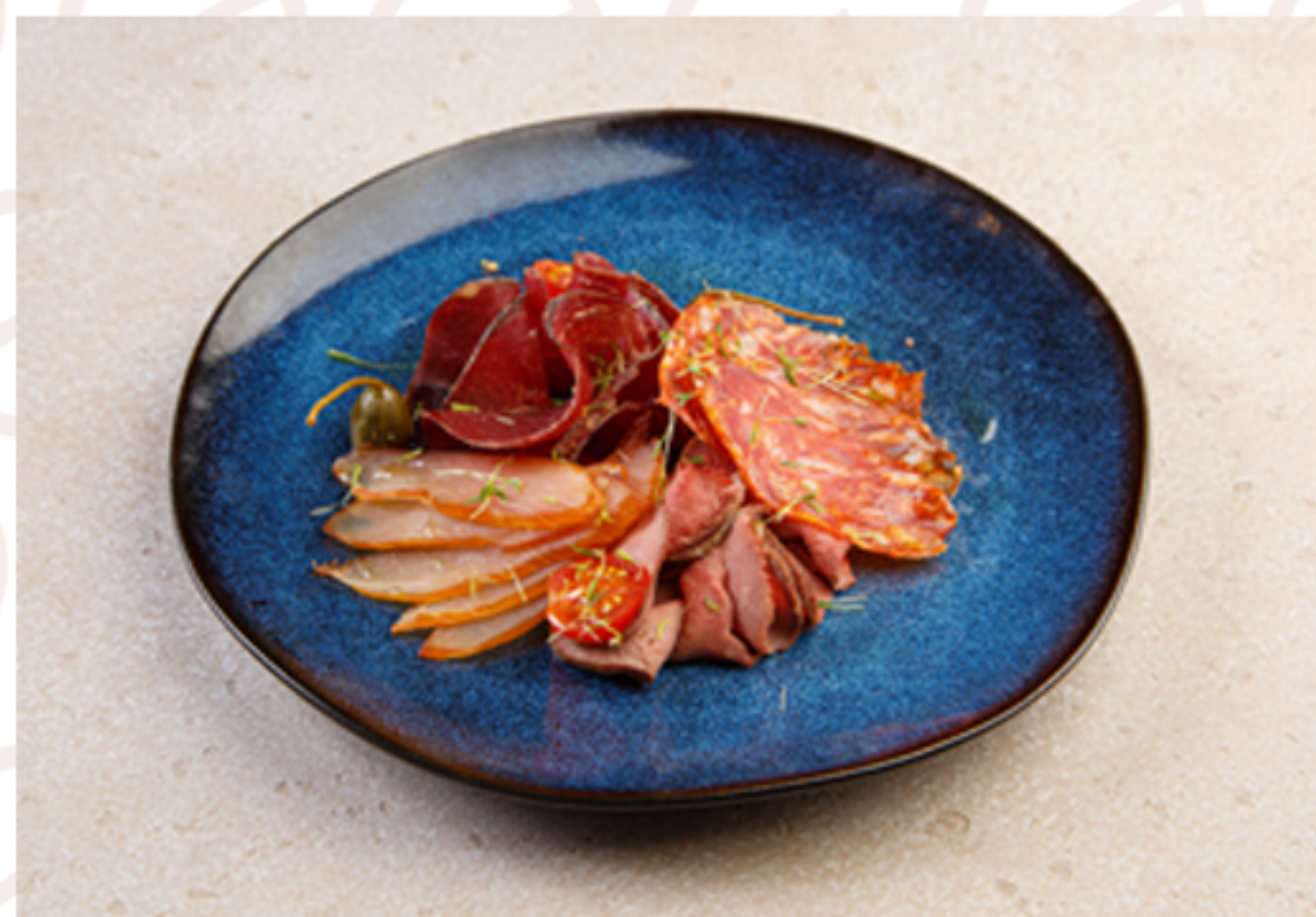
Плато мясных деликатесов (160гр)