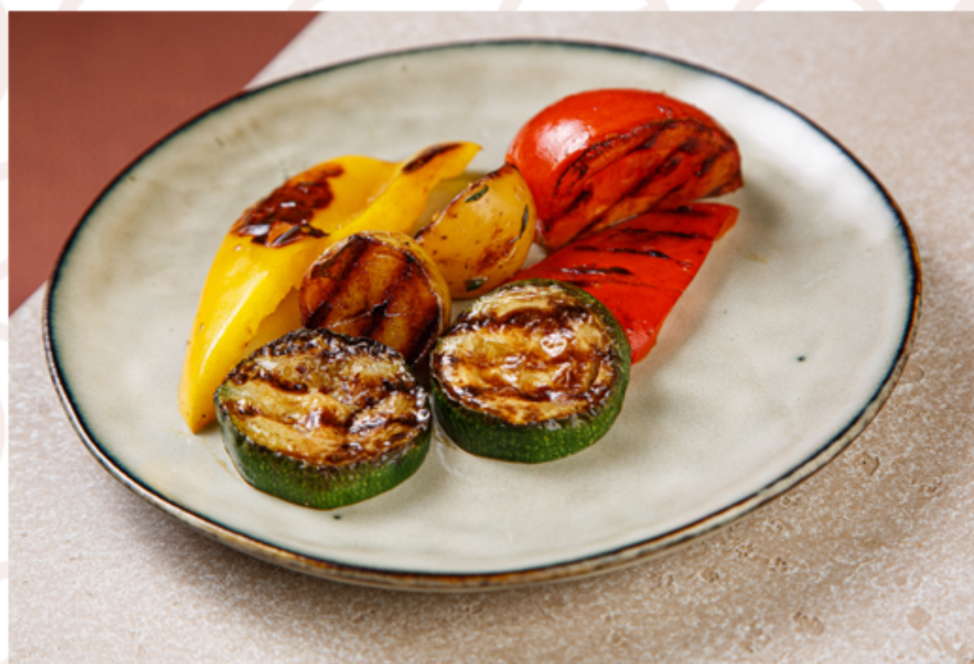
Овощи гриль (120гр)