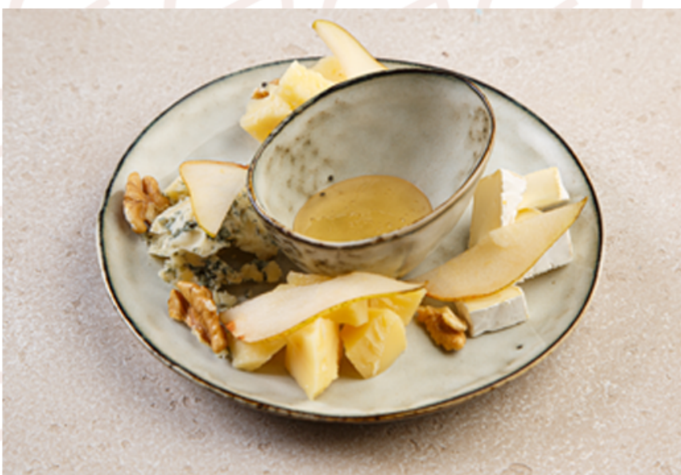
Сырное ассорти (170гр)

(огурцы/помидоры/перец маринованный/чеснок/квашенная капуста)