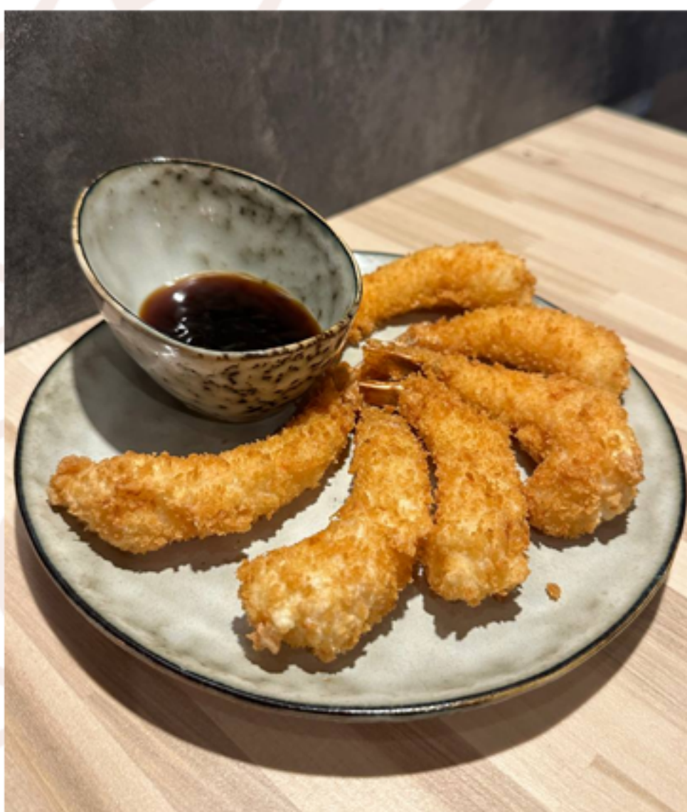
Креветки темпура (140гр)