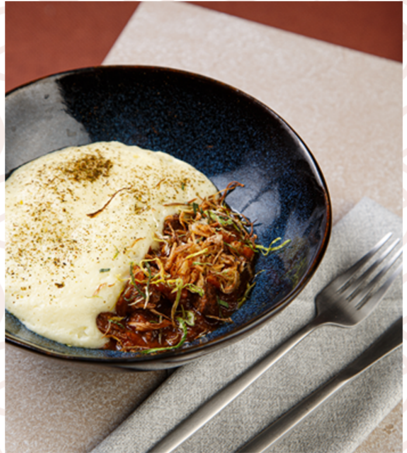
Рагу из мраморной говядины в красном вине (270гр)