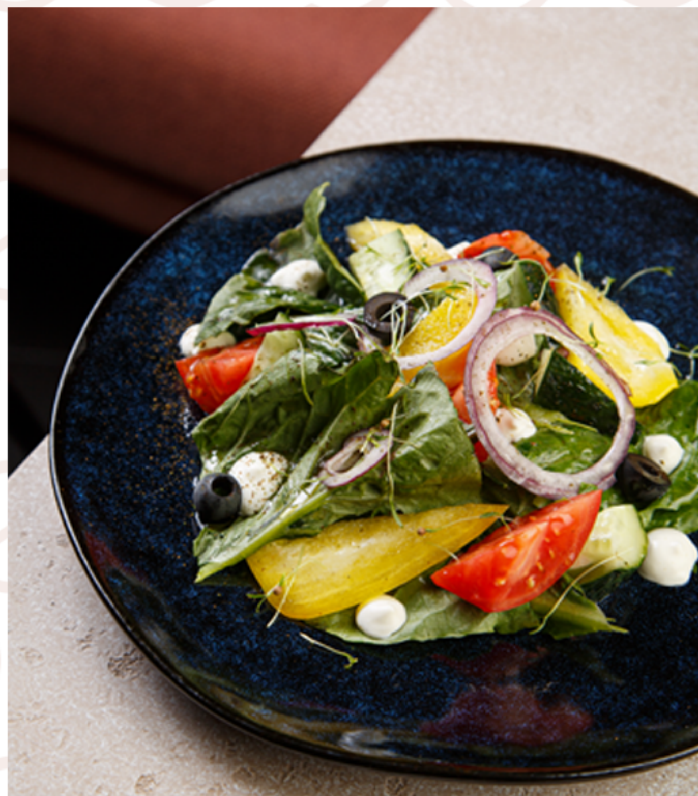
Греческий салат (200гр)