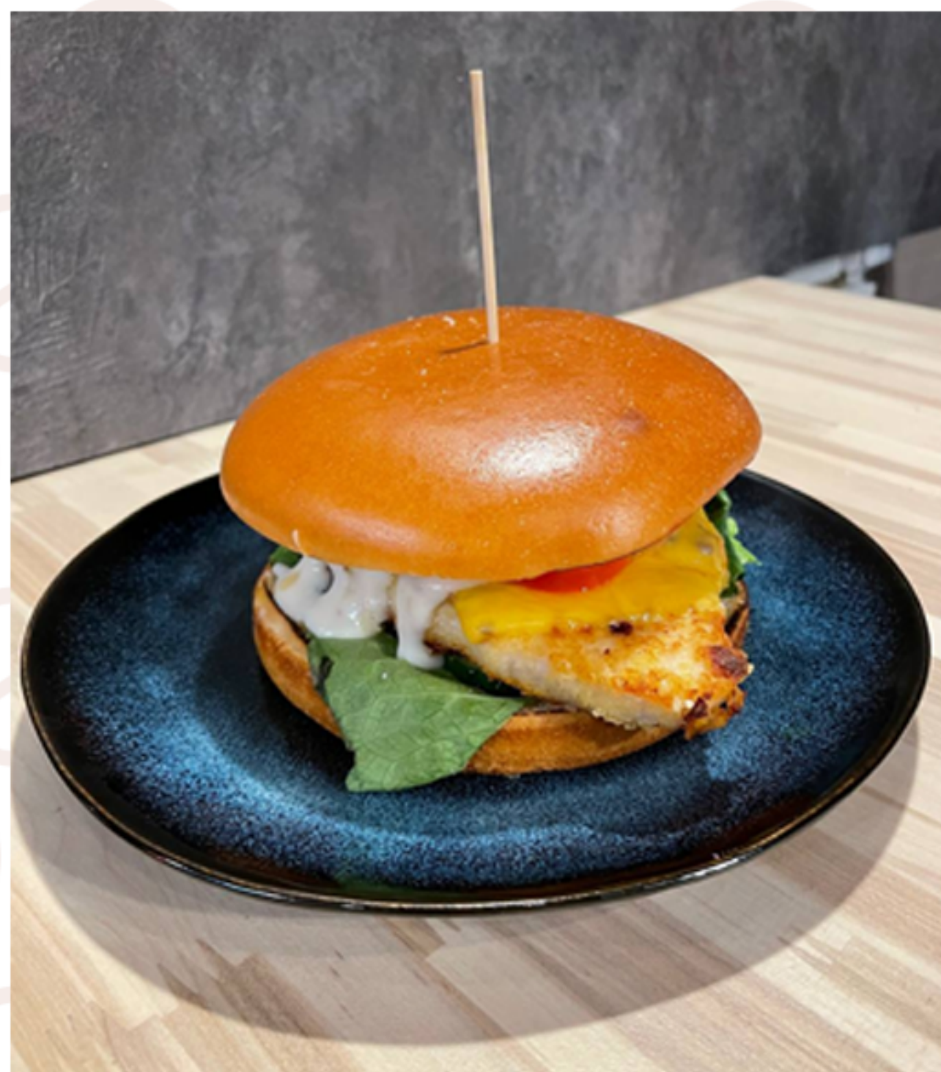
Цезарь Бургер (300гр)

(булка бриошь/котлета говяжья/соус терияки/салат айсберг/кольца ананаса/руккола/сыр чеддер)