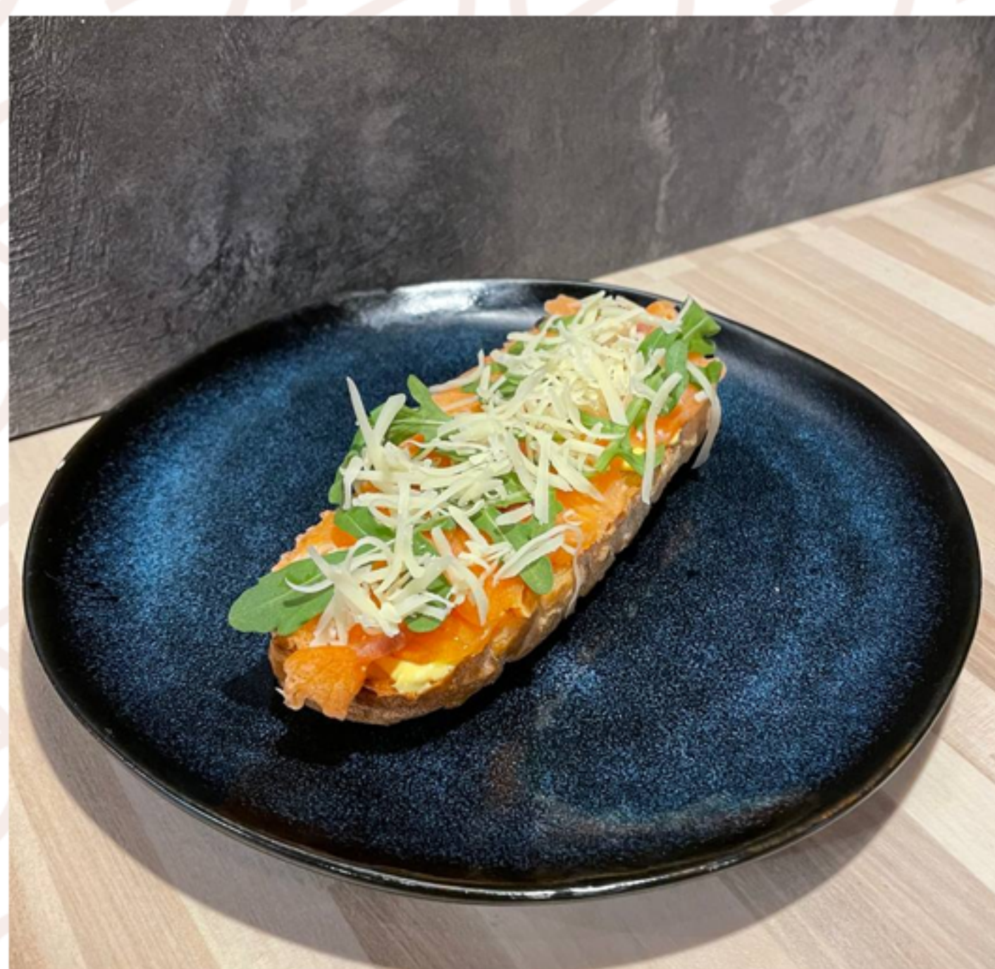
Брускетта с лососем

(чиабатта/соус мус фета/руккола/ростбиф/помидоры черри/пармезан/микрозелень)