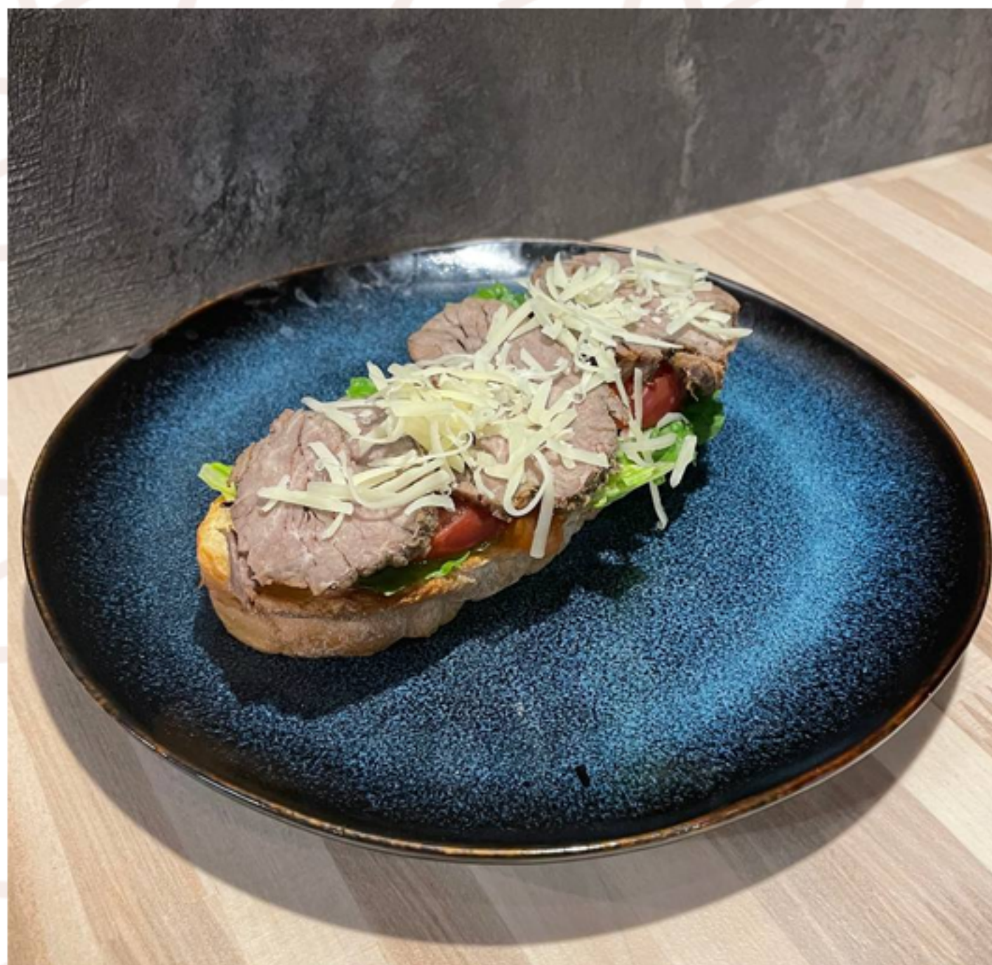
Брускетта с ростбифом

(хлеб хайрис/копченая курица/помидор/огурец/салат айсберг/сыр моцарелла/соус цезарь/соус сырный/картофель фри)