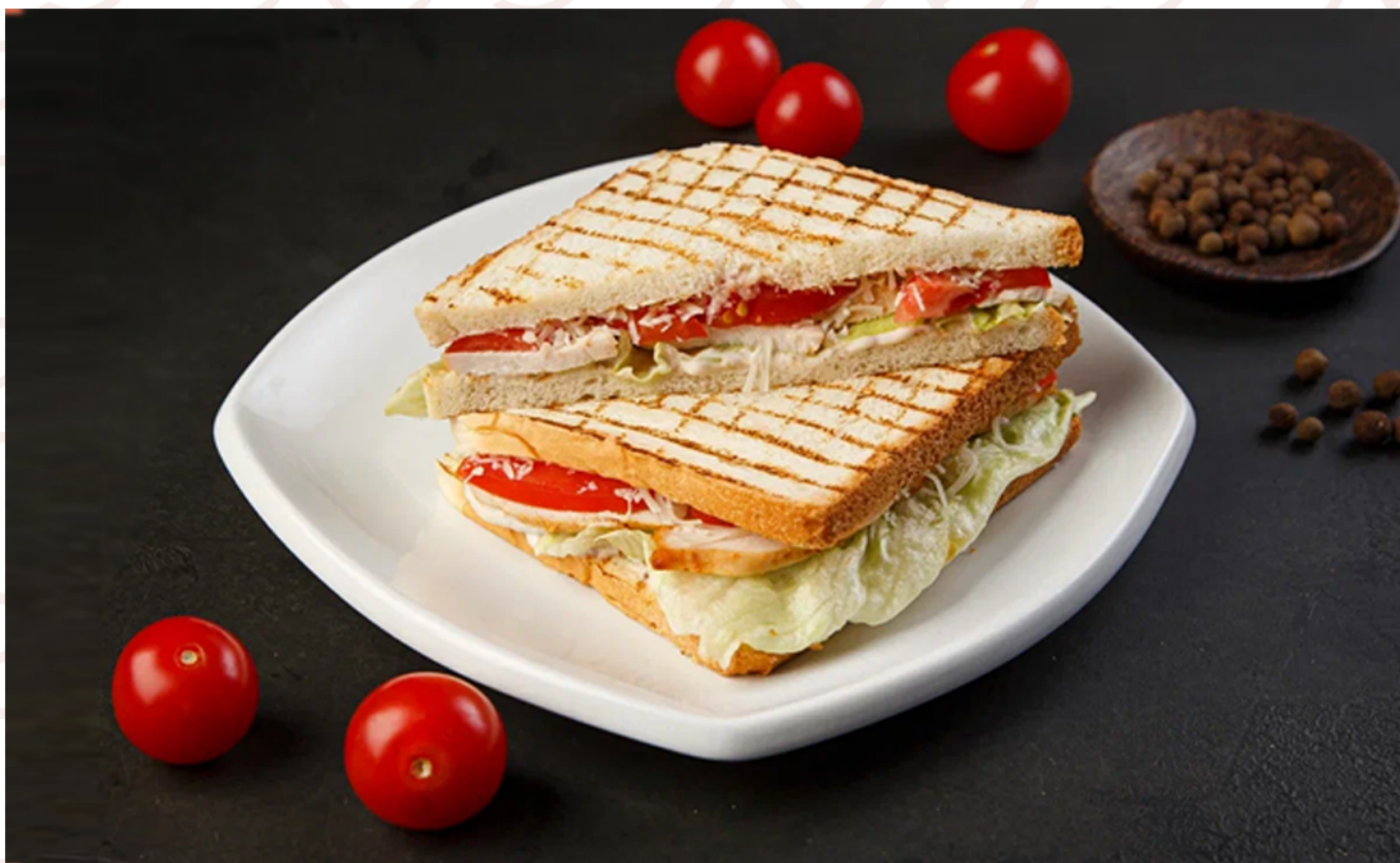
Клуб сэндвич (180гр)

ИП Дубов Е.К. ИНН: 132609765403 ОГРН: 312132619100034