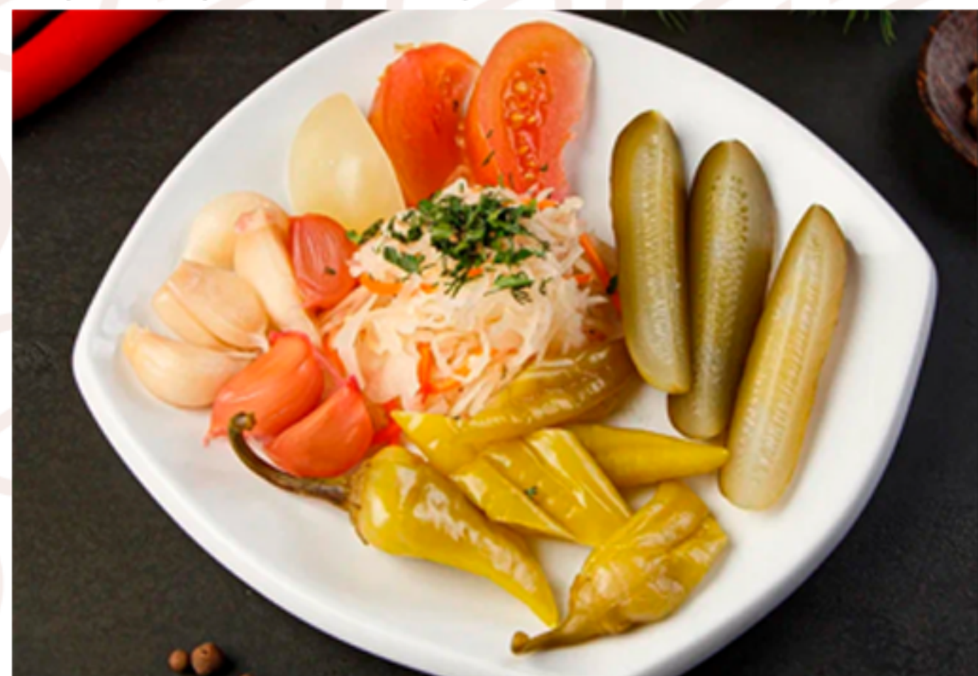
Соленья ассорти (240гр)

(огурцы/помидоры/перец болгарский/редиска/микс зелени)