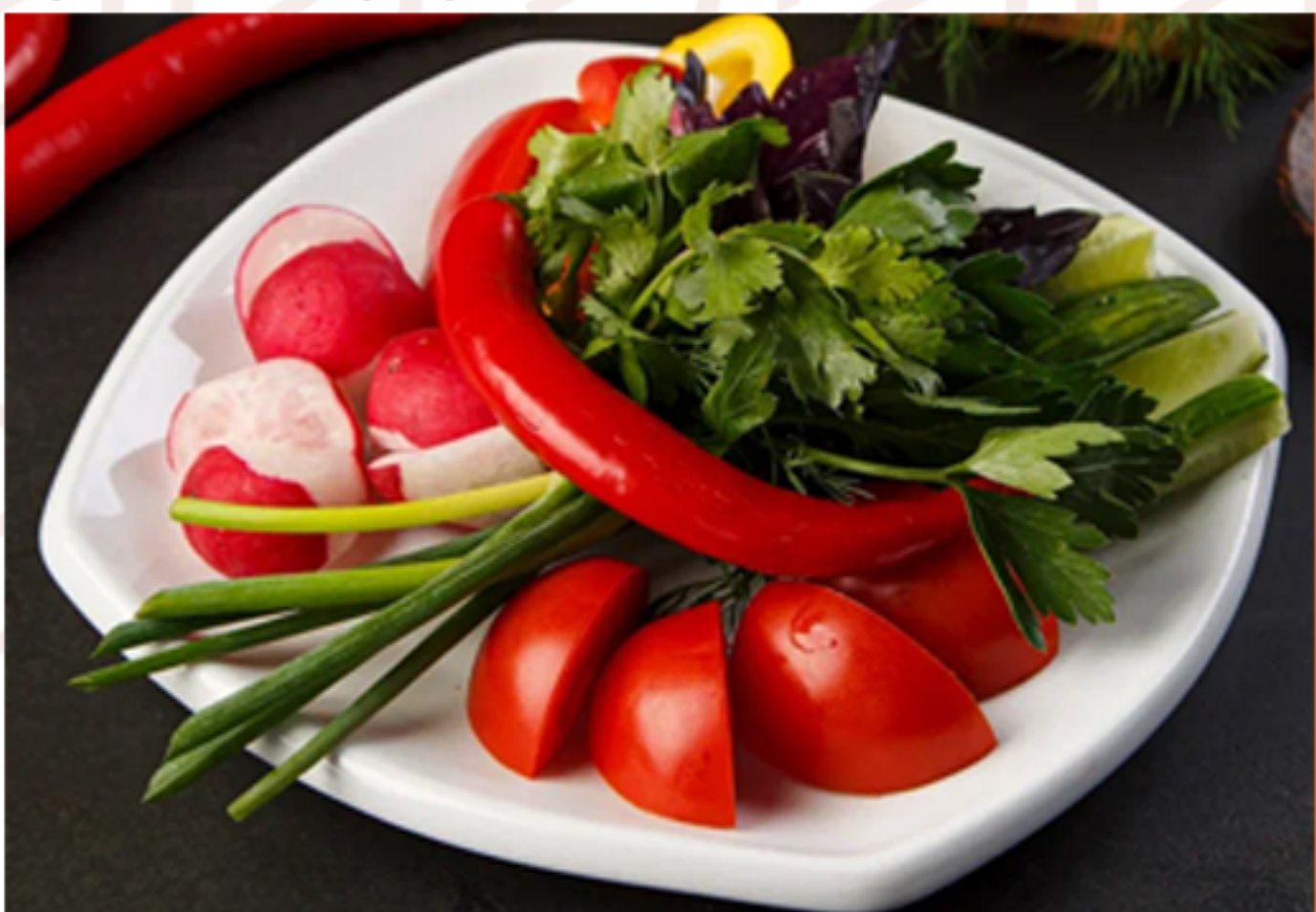
Овощная нарезка (240гр)

(куриное филе/лук/шампиньоны/сливки/сыр моцарелла/масло растительное)