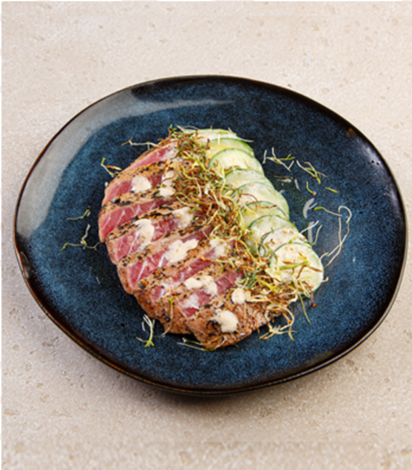
Стейк тунца с цуккини (280гр)

ИП Дубов Е.К. ИНН: 132609765403 ОГРН: 312132619100034