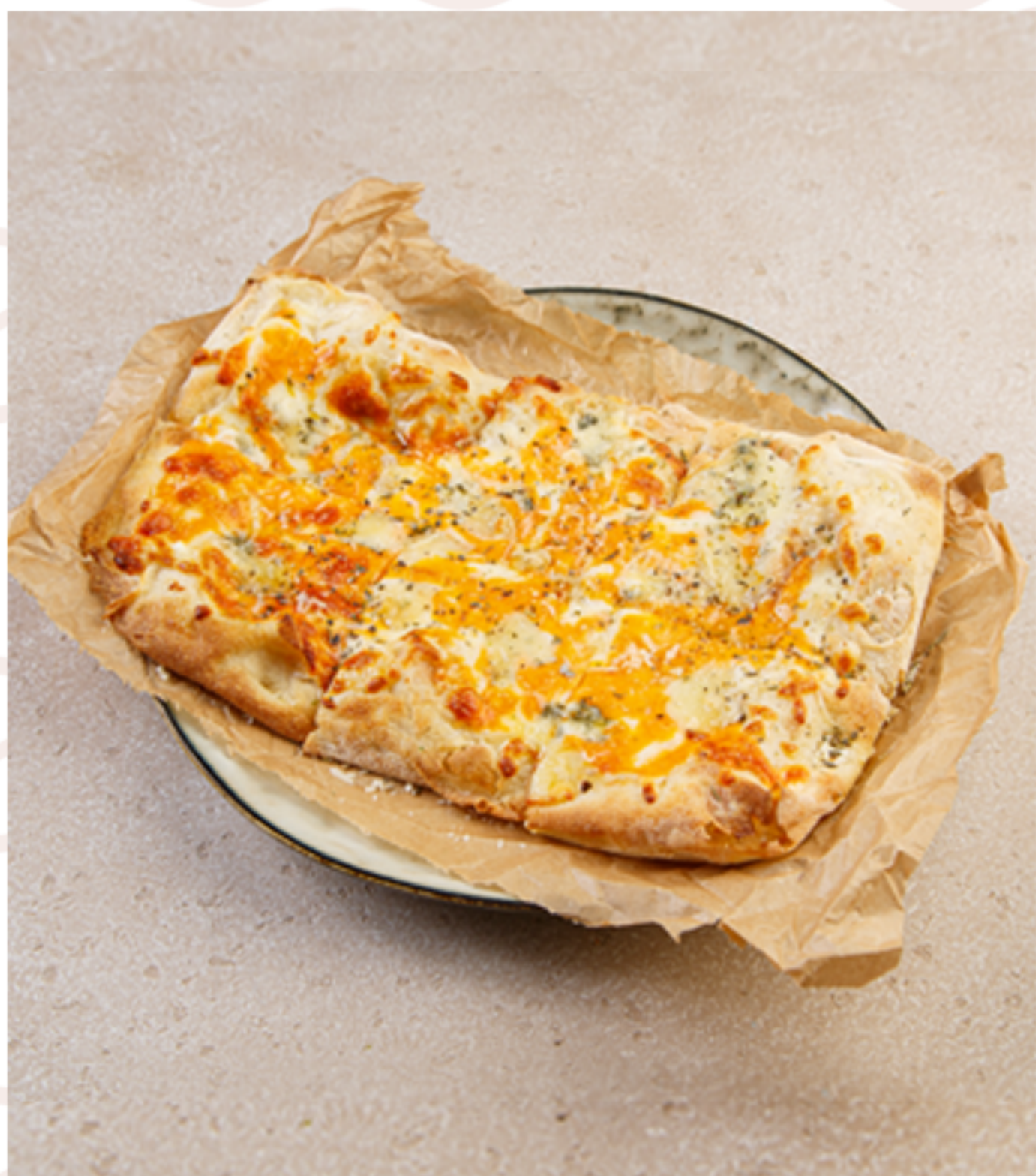
Четыре сыра (330гр)

(говядина брезаола/копченая куриная грудка/ копченый бекон/томатный соус/сыр моцарелла/ красный лук)