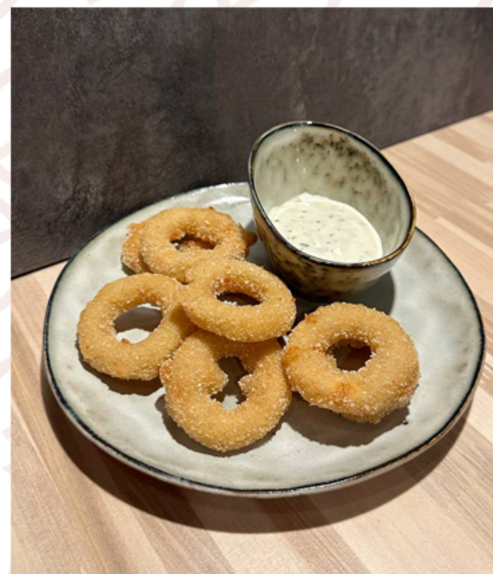
Луковые кольца (120гр)