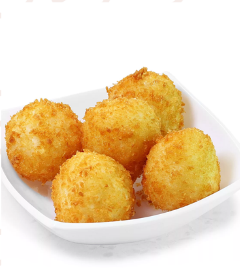
Сырные шарики (120гр)