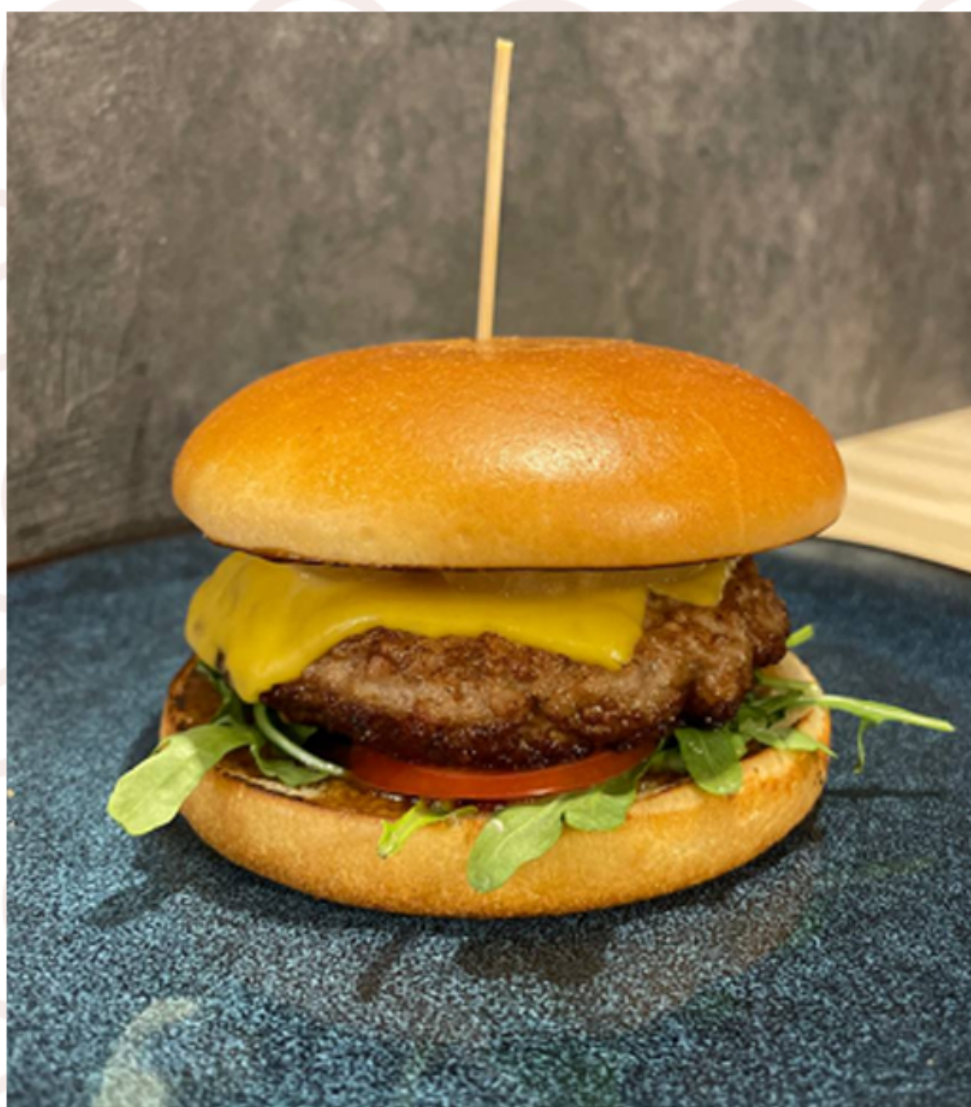
Прайм Бургер (280гр)

(булочка бриошь/соус барбекю/кетчуп/котлета говяжья/микс салат/помидор/лук/сыр чеддер)