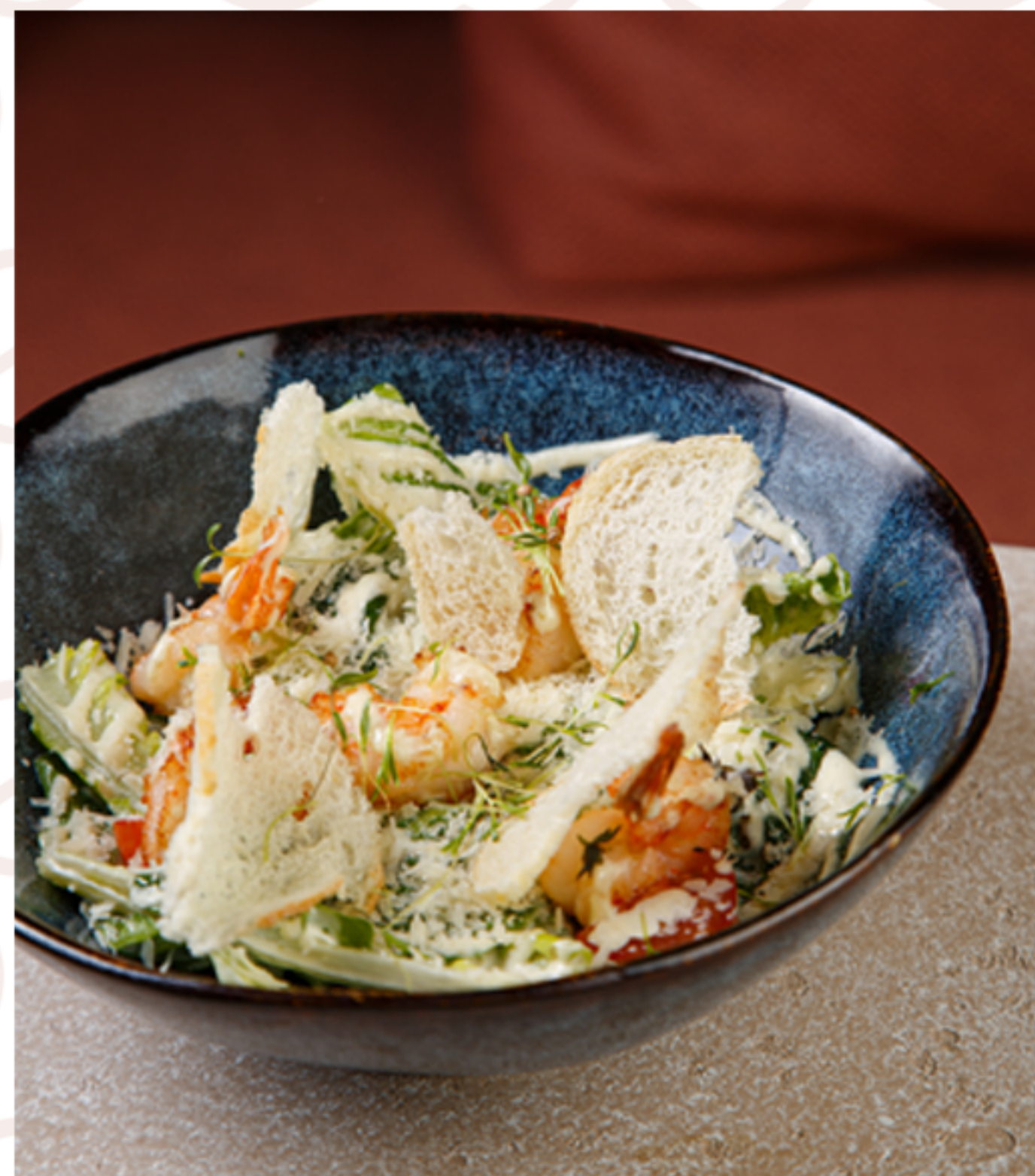
Цезарь с креветками