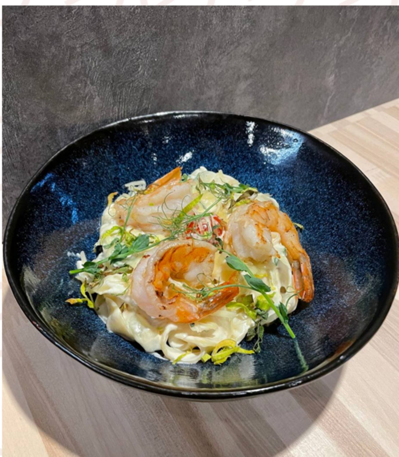
Паста с креветками 590₽ (280гр)

(спагетти/ копченый бекон/ яичный желток)