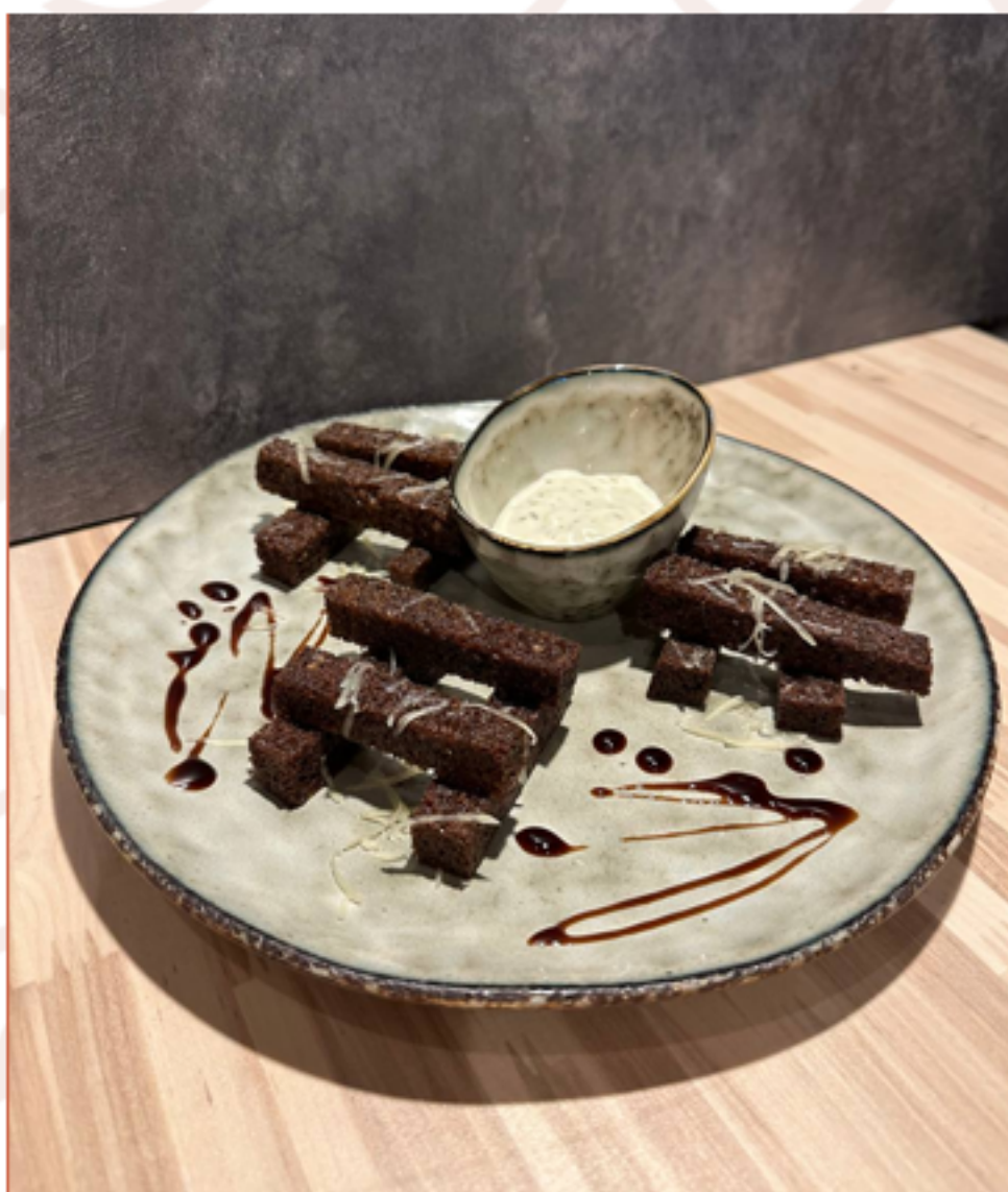
Чесночные гренки (120гр)