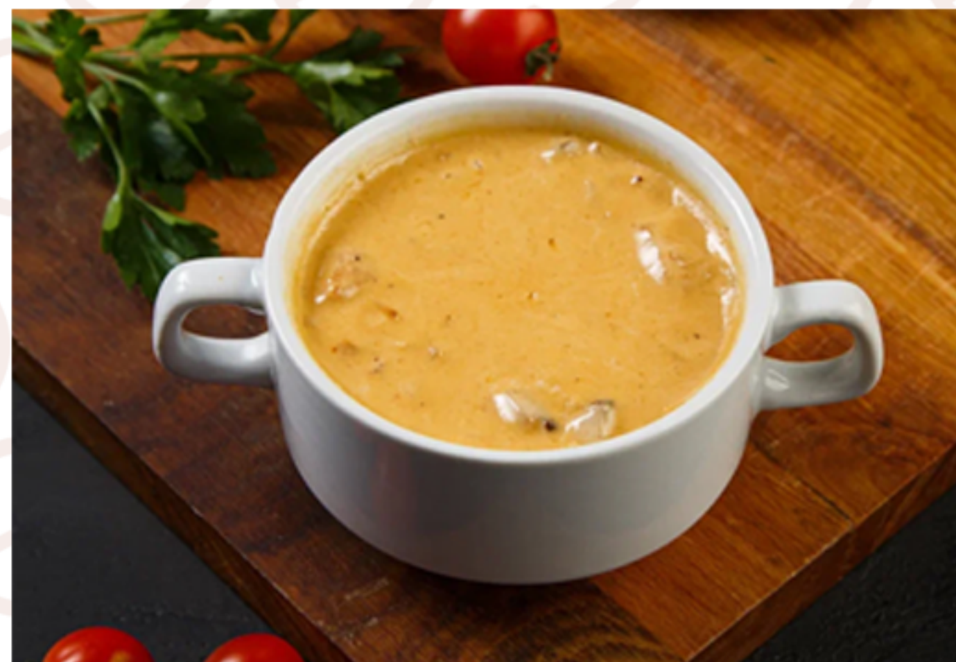
Жульен куриный (200гр)

(сельдь с/с, картофель отварной/лимон/лук/зелень/уксус)