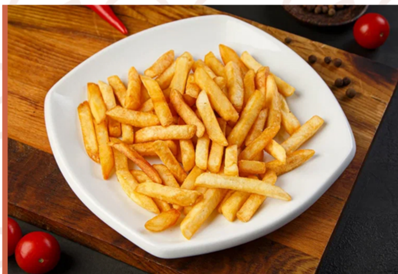
Картошка фри (160гр)