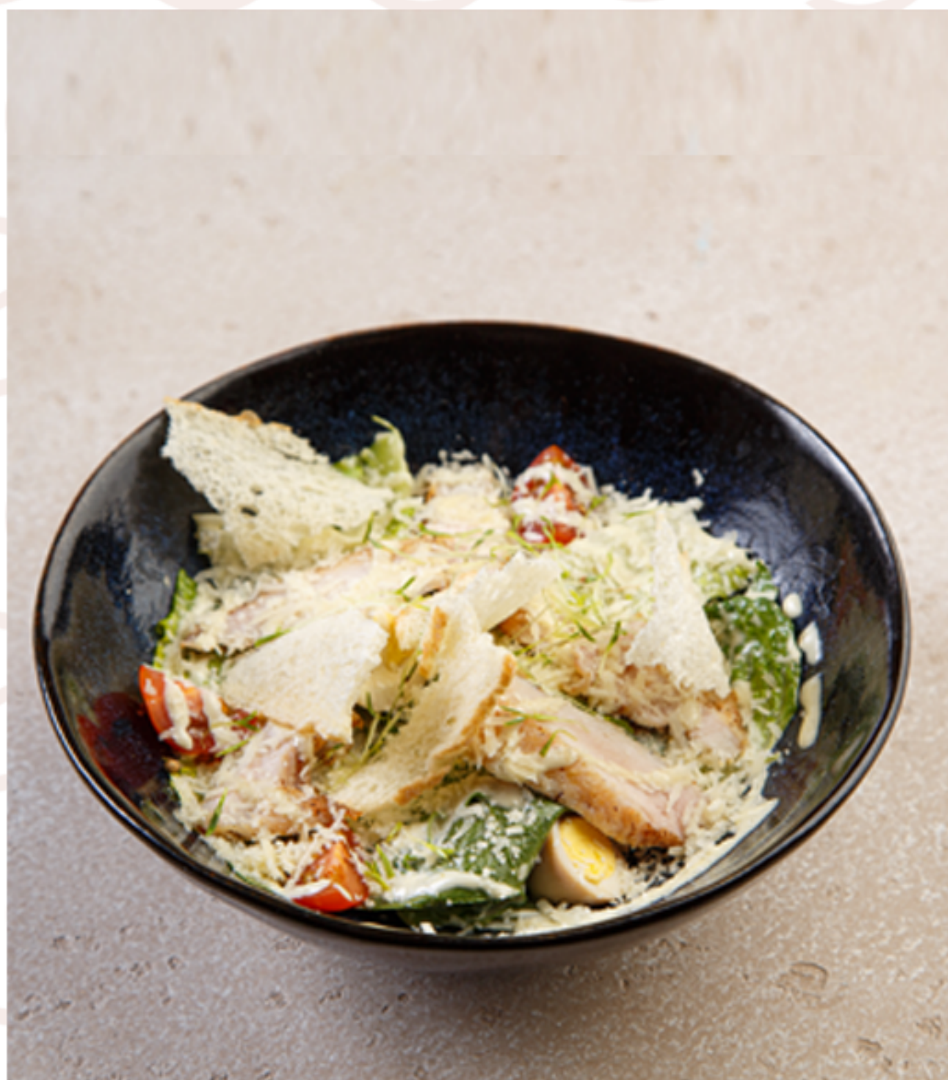
Цезарь с курицей