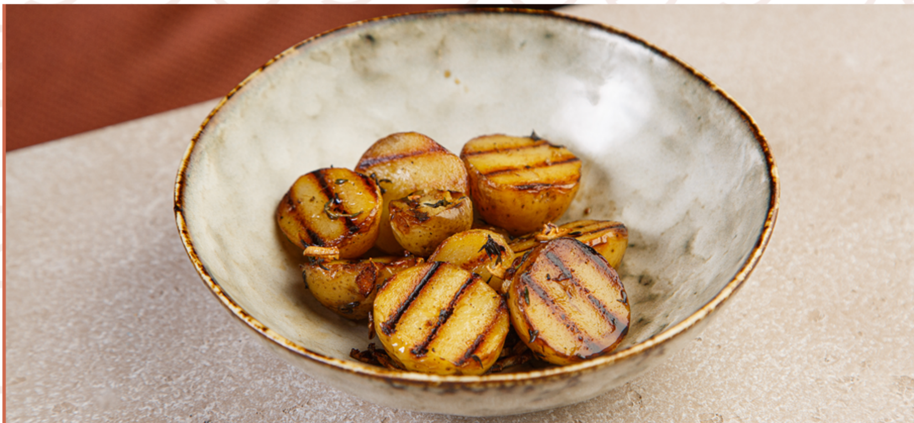
Картофель черри (120гр)

ИП Дубов Е.К. ИНН: 132609765403 ОГРН: 312132619100034