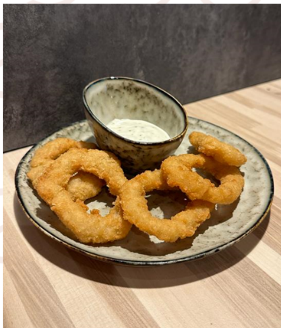
Кольца кальмаров (120гр)

ИП Дубов Е.К. ИНН: 132609765403 ОГРН: 312132619100034