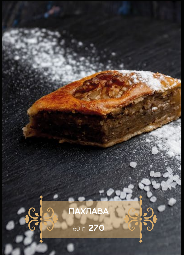
ПАХЛАВА 60 г 270