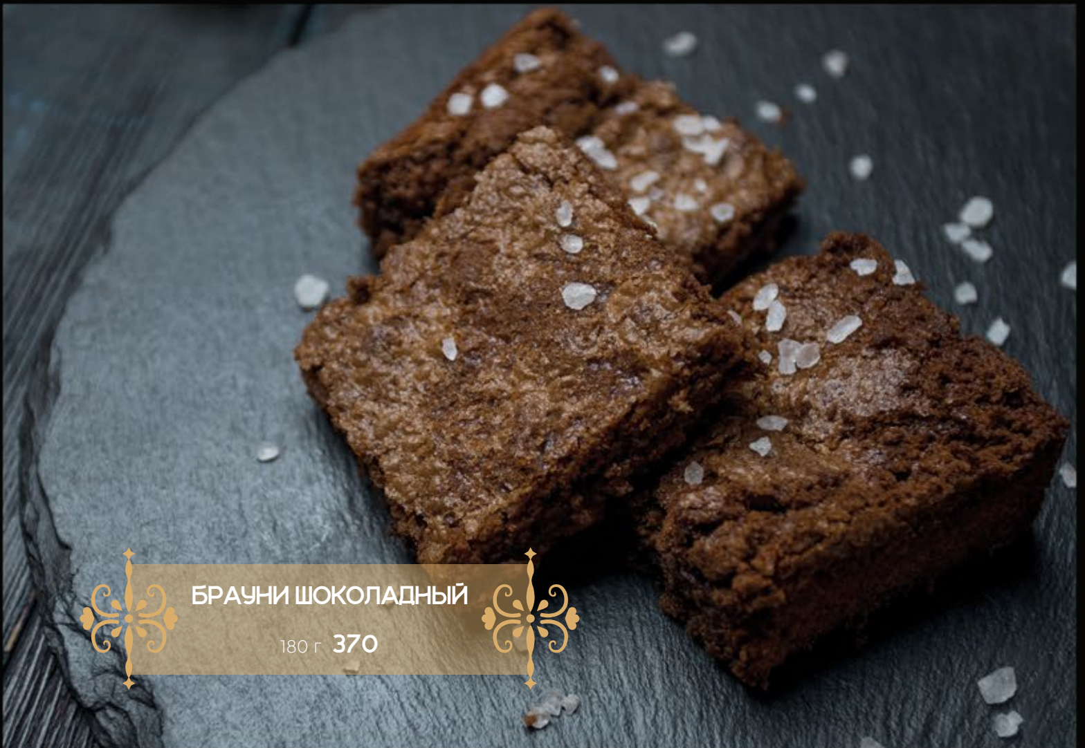
БРАУНИ ШОКОЛАДНЫЙ 180 г 370