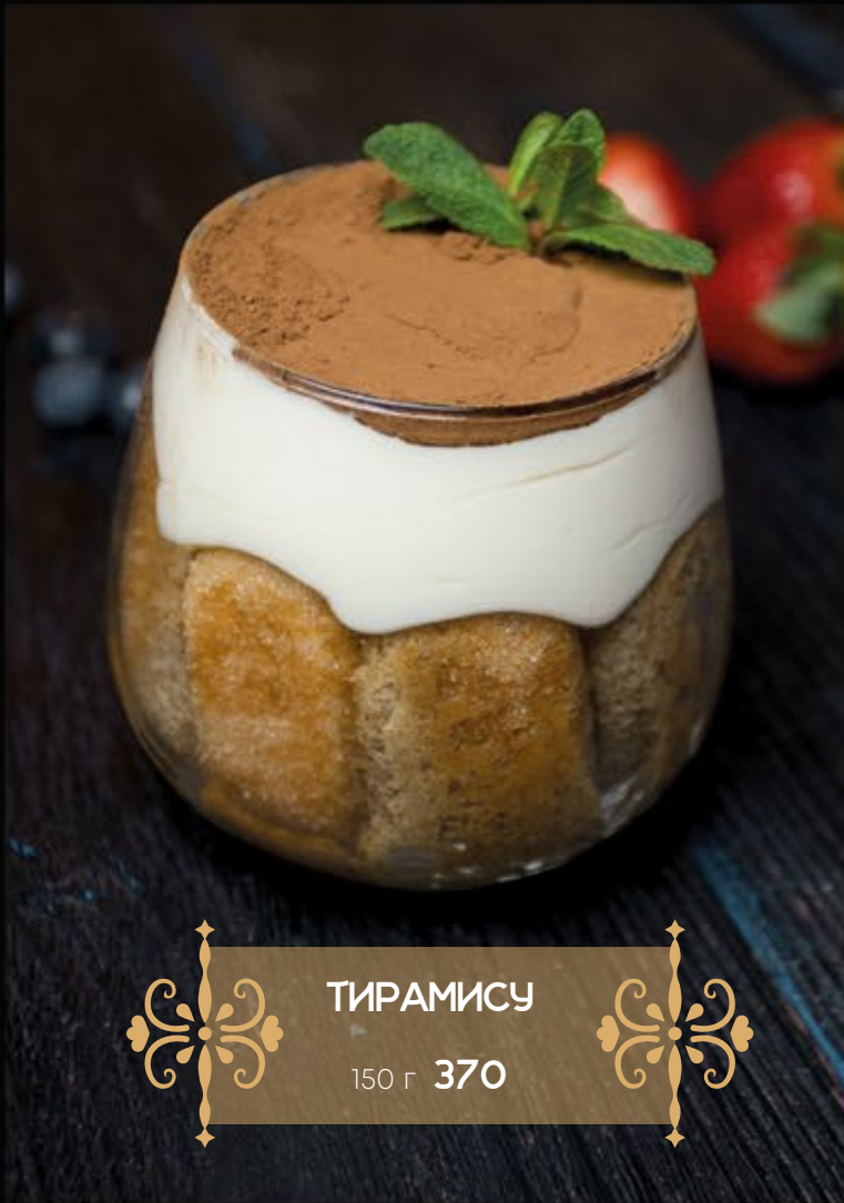
ТИРАМИСУ 150 г 370