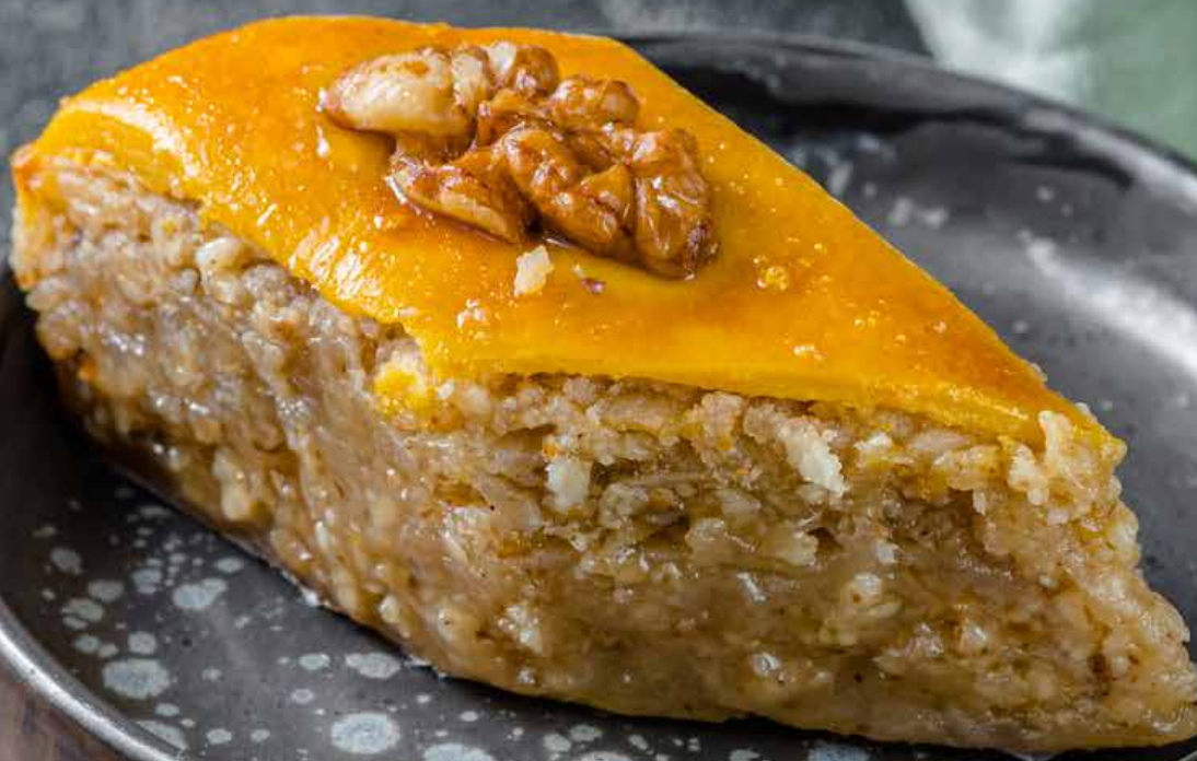
Пахлава с миндалем