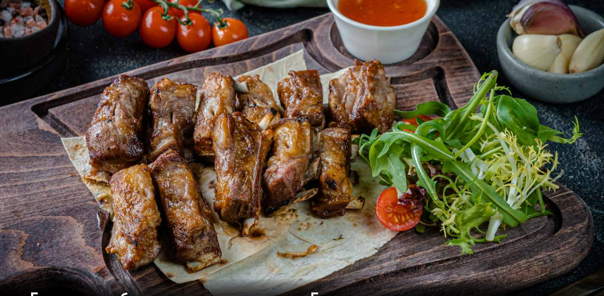
Баранина ребрышки (семечки)