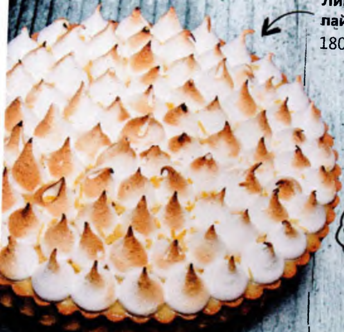
Лимонный пай 180р