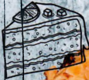
Безе с черносливом 260р