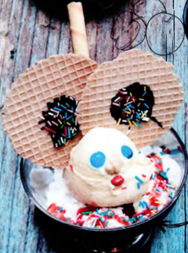
Мики Джело 320р