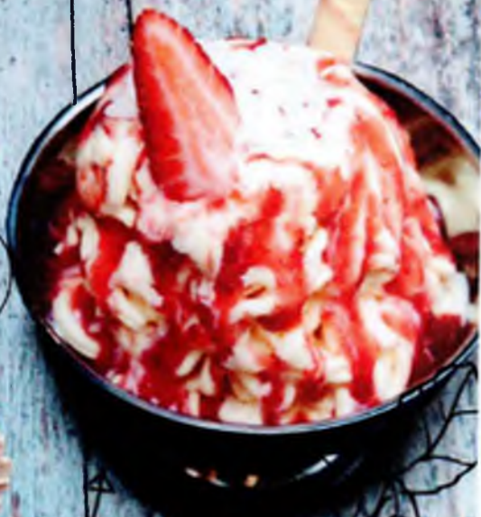
Копя спагетти 370р