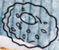
Крем Брюле 220р