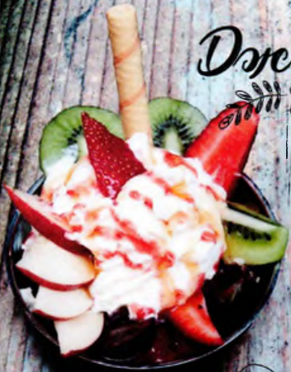
Копя Фрута 380р