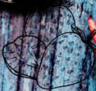
Копя клубника 380р