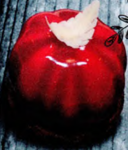
Три шоколада 260р