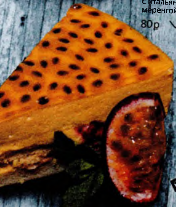
Шоколадно-банановый с итальянской меренгой 80р