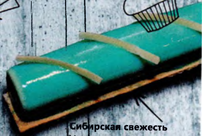
Сибирская свежесть Мусс на жасминовом чае 220р