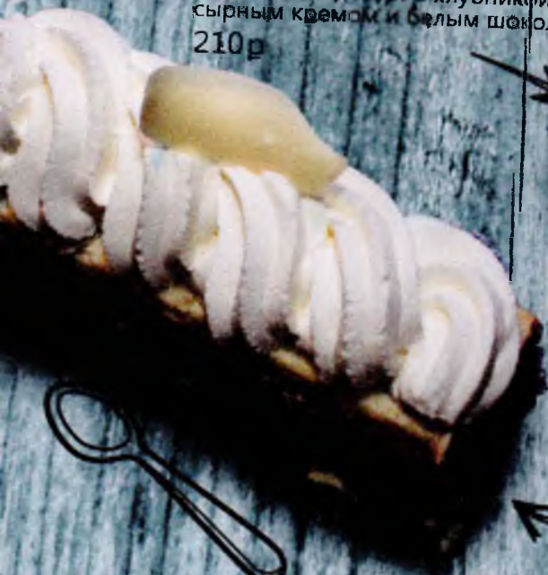
Красный Бисквитный десерт с клубникой, сырным кремом и белым шоколадом 210р