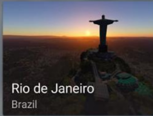
Rio de Janeiro Brazil