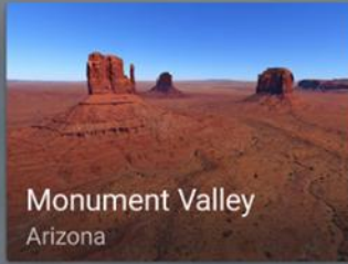
Monument Valley Arizona