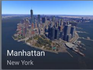
Manhattan New York