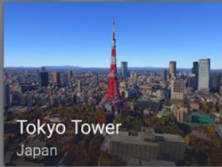
Tokyo Tower Japan