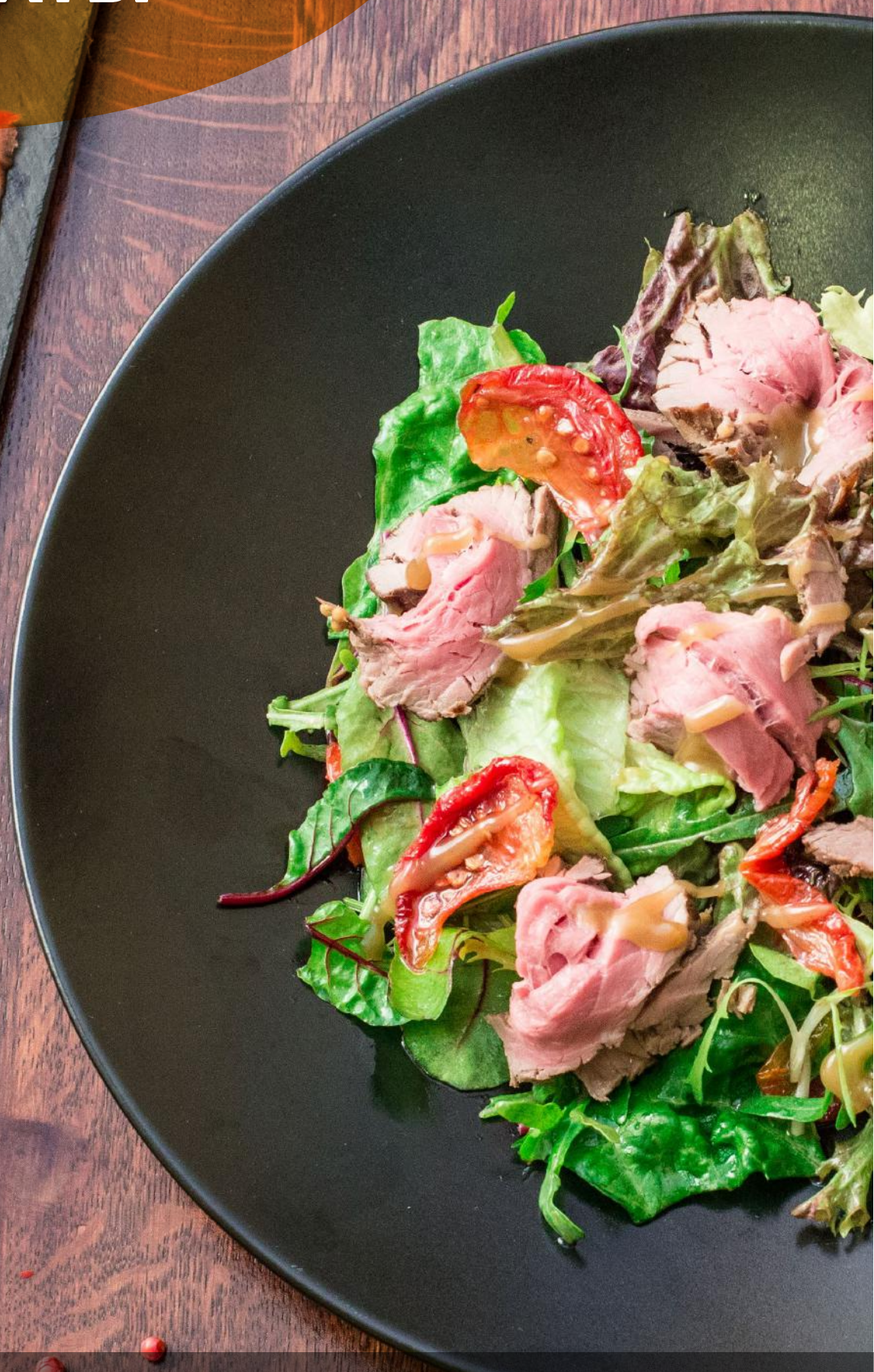
Салат с ростбифом и вялеными томатами томаты Черри, вяленые томаты, пряный ростбиф, салат ромейн, салат айсберг, микс салат, заправка медово-горчичная, запеченный перец