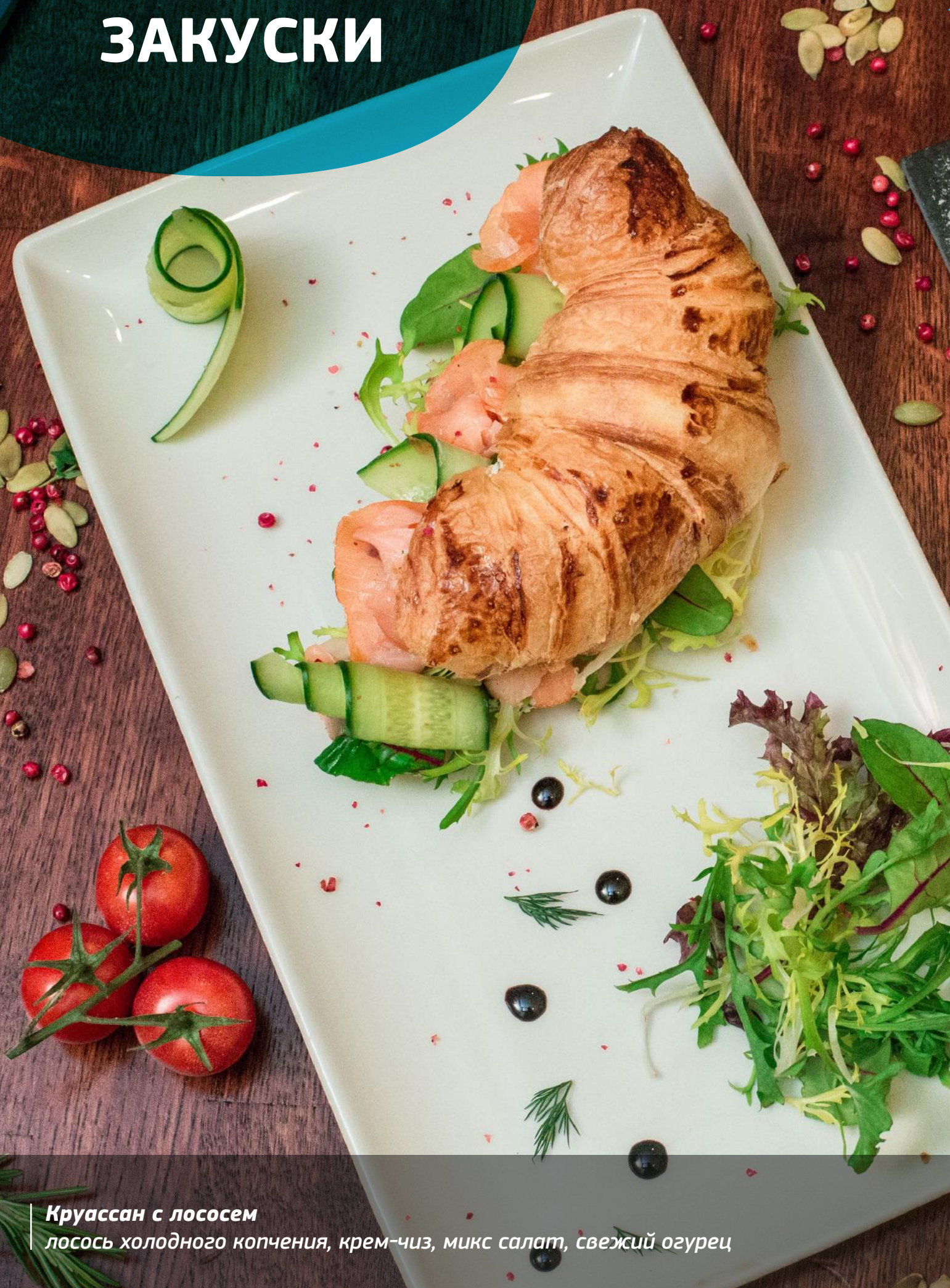
Круассан с лососем лосось холодного копчения, крем-чиз, микс салат, свежий огурец