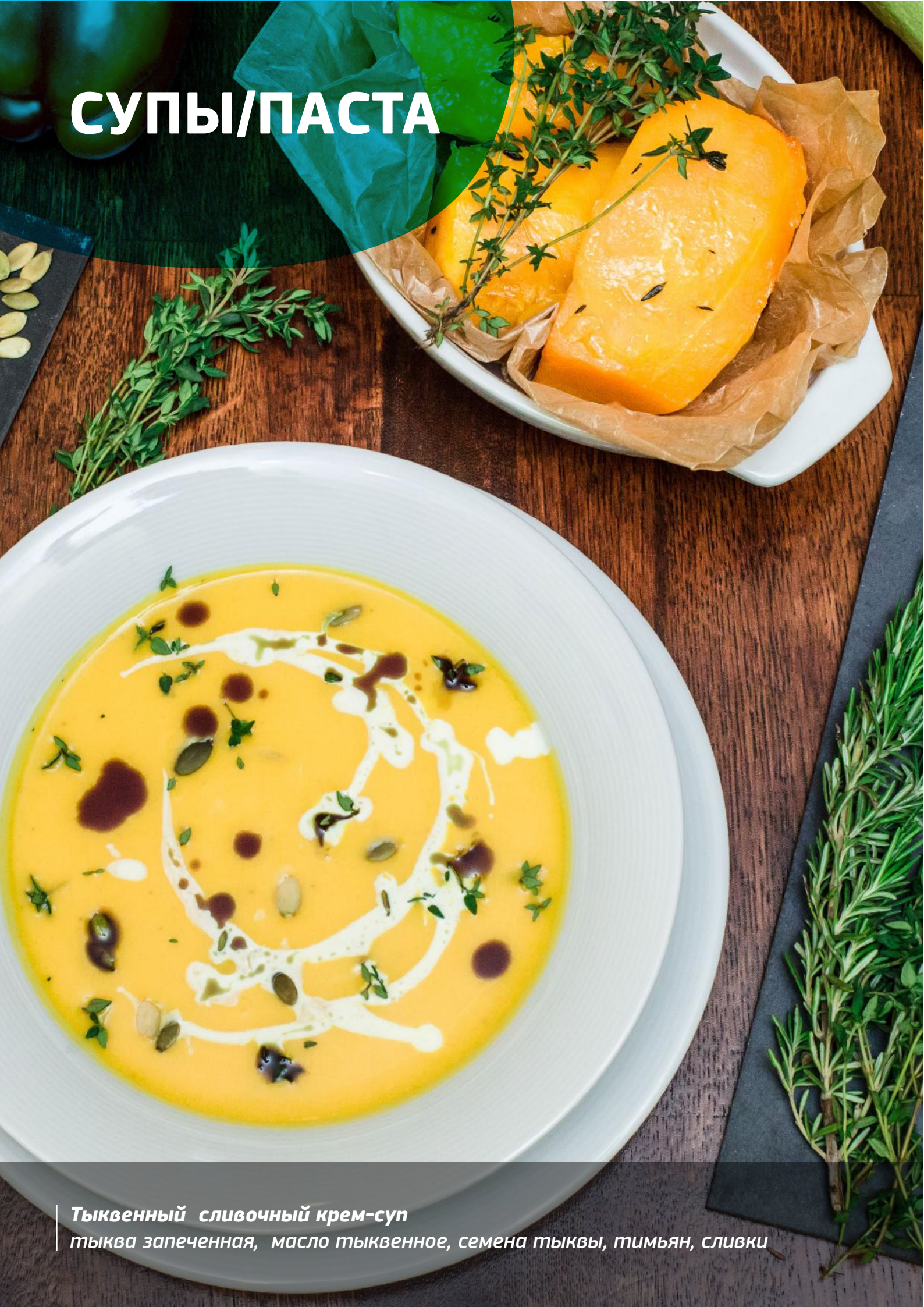
Тыквенный сливочный крем-суп тыква запеченная, масло тыквенное, семена тыквы, тимьян, сливки