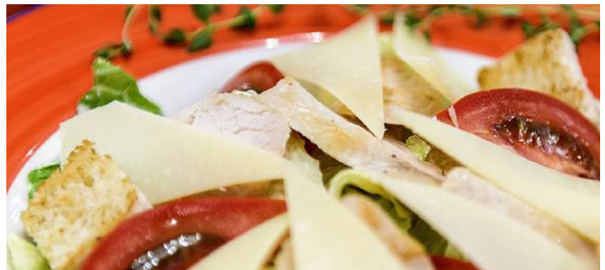
CAESAR AL POLLO САЛАТ ЦЕЗАРЬ С КУРОЙ/ CAESAR SALAD WITH CHICKEN 210Г 400P