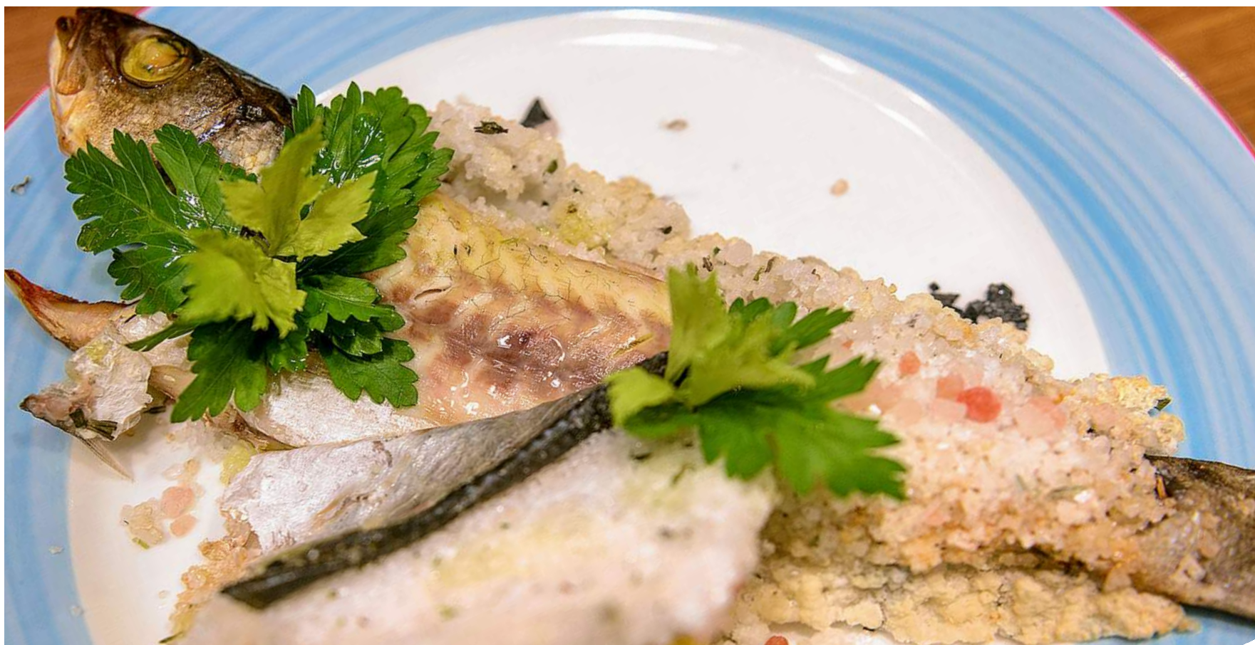
SPIGOLA AL SALE СИБАС В МОРСКОЙ СОЛИ/ SEA BASS BAKED IN SEA SALT