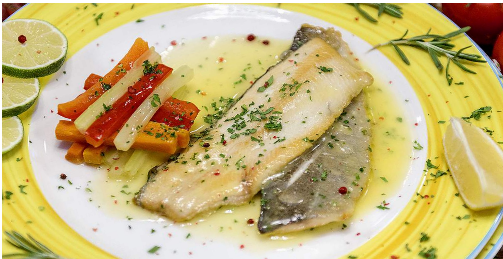
TROTA ALLA MUGNAIA ФОРЕЛЬ С ПАРОВЫМИ ОВОЩАМИ/ TROUT FILLET WITH STEAMED VEGETABLES