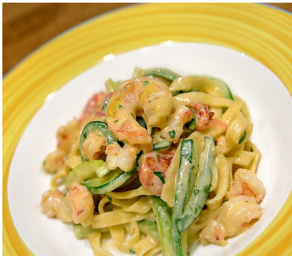
TAGLIATELLE CON PANNA, GAMBERETTI E ZUCCHINI

КРЕВЕТКИ, ЦУКИНИ, СЛИВОЧНЫЙ СОУС/ SHRIMPS, ZUCCHINI, CREAM SAUCE