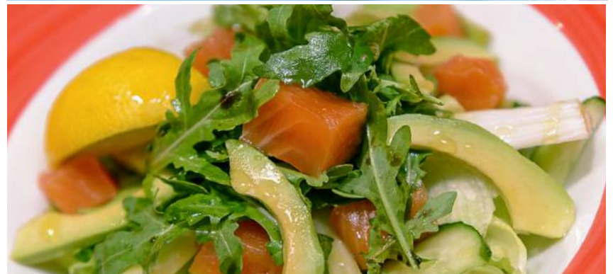
MARE E TERRA МИКС САЛАТОВ С ЛОСОСЕМ С/С, ФЕНХЕЛЕМ И АВОКАДО/ MIXED SALAD WITH SALMON, FENNEL AND AVOCADO 230Г 640P