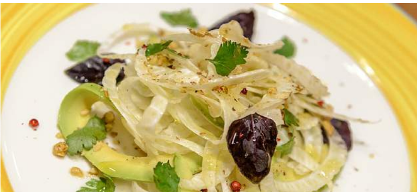
INSALATA DI FINOCCHI, CON AVOCADO E CORIANDOLO САЛАТ ИЗ ФЕНХЕЛЯ, АВОКАДО И ГРЕЦКОГО ОРЕХА/ FENNEL AND AVOCADO SALAD WITH WALNUTS 1/160Г 340P