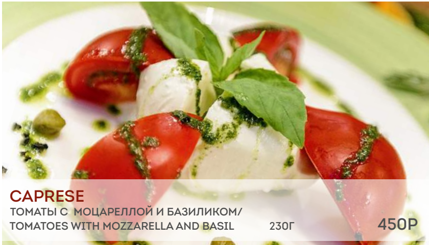
CAPRESE ТОМАТЫ С МОЦАРЕЛЛОЙ И БАЗИЛИКОМ/ TOMATOES WITH MOZZARELLA AND BASIL 230Г 450P