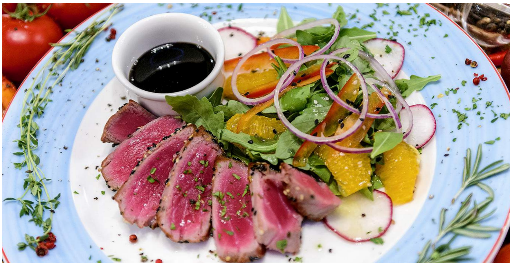
TONNO СТЕЙК ИЗ ТУНЦА С ОВОЩНЫМ САЛАТОМ/ TUNA STEAK WITH VEGETABLE SALAD