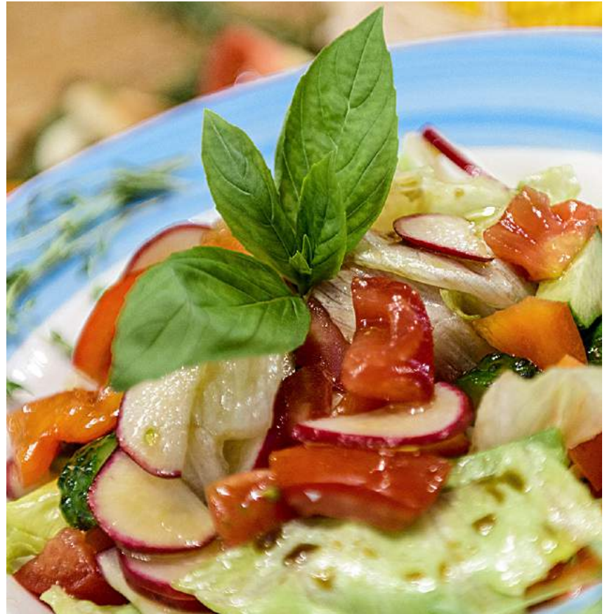
INSALATA MISTA САЛАТ ИЗ СВЕЖИХ ОВОЩЕЙ/ VEGETABLE SALAD 200Г 300P