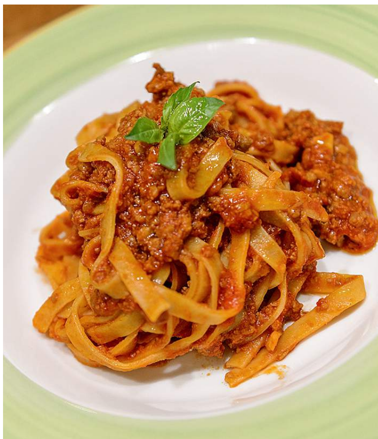
TAGLIATELLE ALLA BOLOGNESE

МЯСНОЙ ФАРШ, ТОМАТНЫЙ СОУС/ TOMATO SAUCE, MINCED MEAT