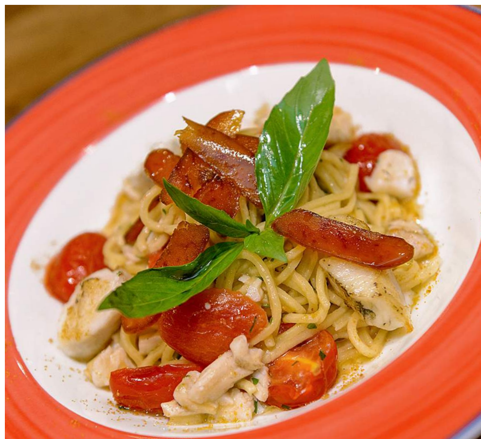
SPAGHETTI CON PESCE BIANCO E BOTTARGA