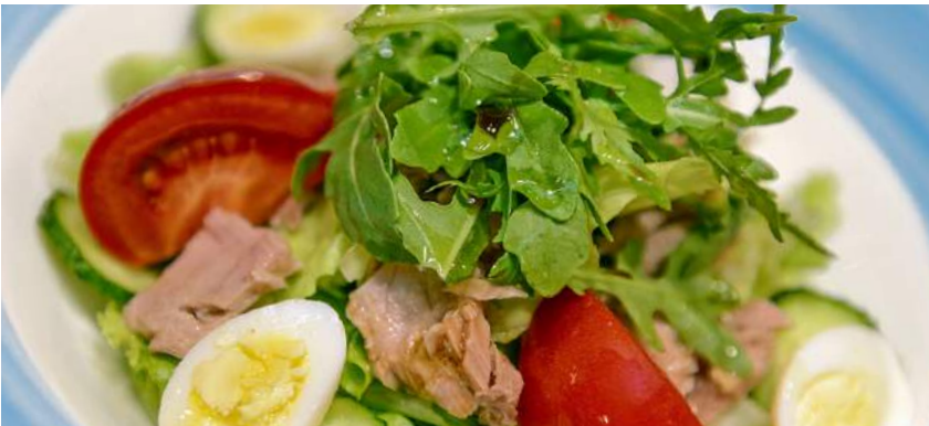
MEDITERRANEA МИКС САЛАТОВ, ОГУРЦЫ, ПОМИДОРЫ, ТУНЕЦ/ SALAD MIX, CUCUMBERS, TOMATOES, TUNA 230Г 460P