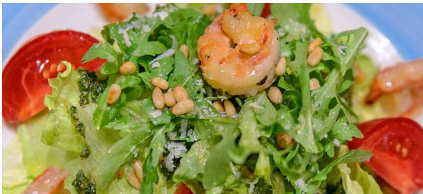
INSALATA DI GAMBERI МИКС САЛАТОВ С ТИГРОВЫМИ КРЕВЕТКАМИ/ MIXED SALAD WITH TIGER PRAWNS 200Г 750P