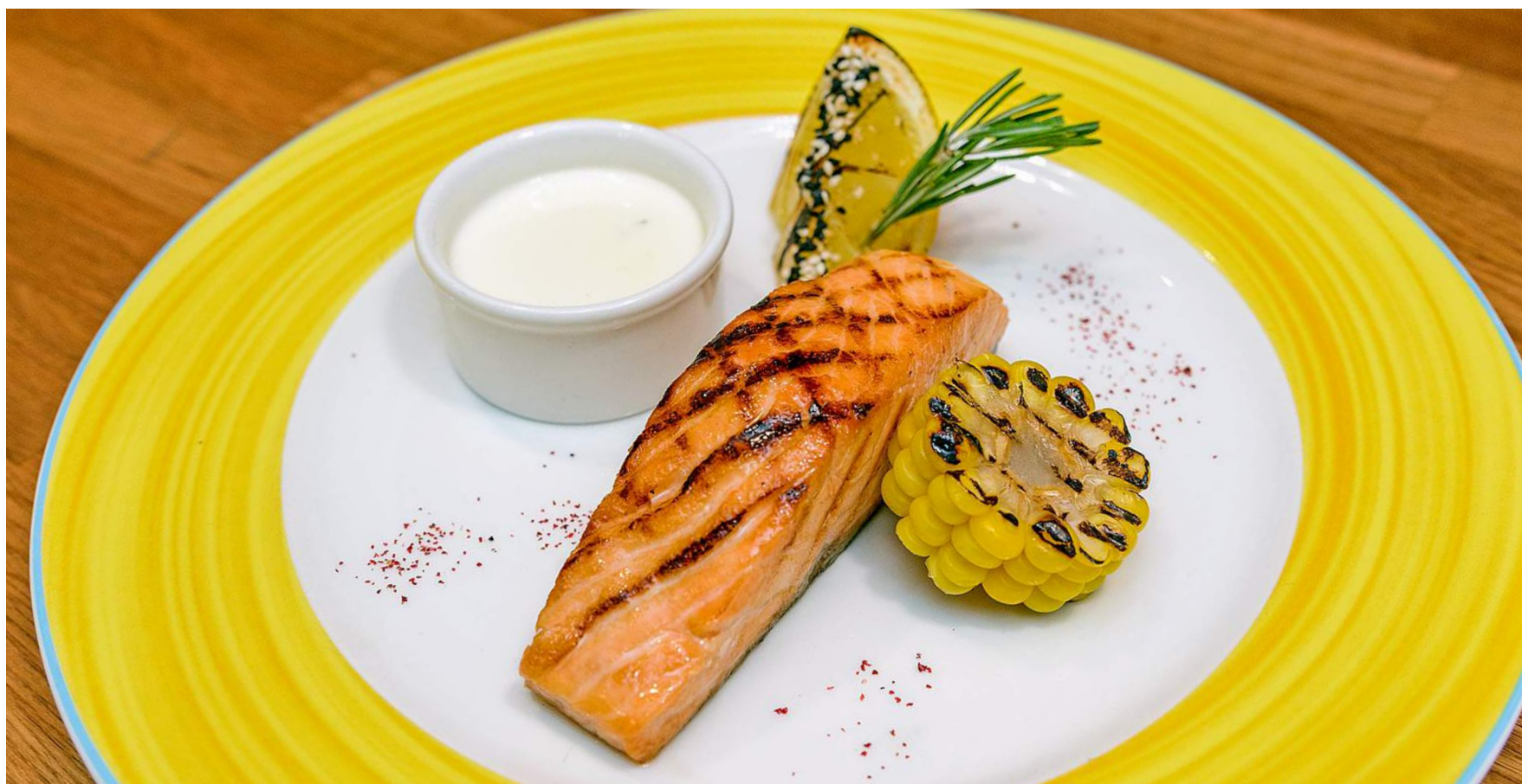
SALMONE ЖАРЕННЫЙ ЛОСОСЬ / FRIED SALMON