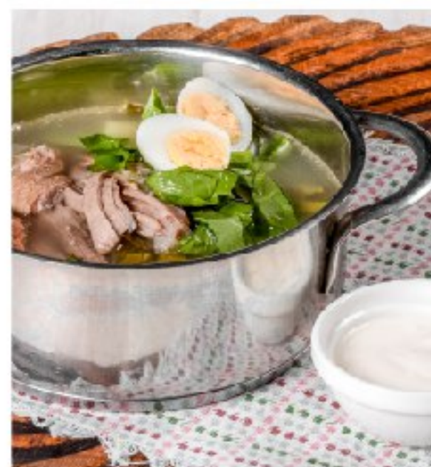
ЩИ из свежей капусты и щавеля с телятиной SHCHI (CABBAGE SOUP) WITH BEEF AND SORREL