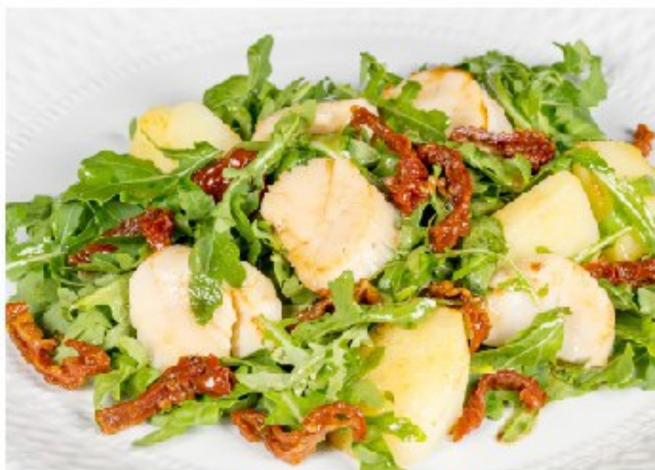
РУККОЛА С ОБЖАРЕННЫМ МОРСКИМ ГРЕБЕШКОМ , молодым картофелем и вялеными томатами ARUGULA WITH ROASTED SCALLOP