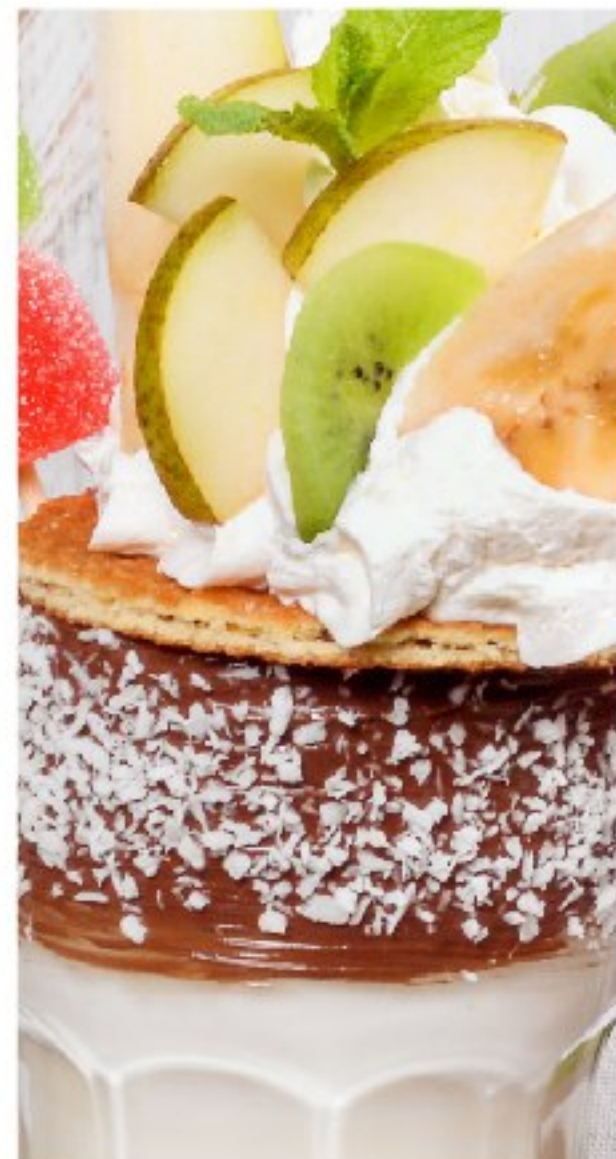
МОЛОЧНЫЙ КОКТЕЙЛЬ (на выбор) MILK SHAKE