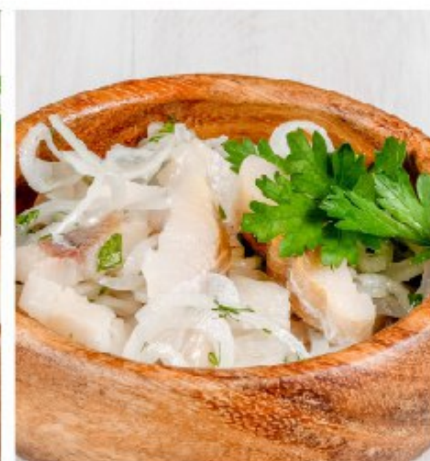
СОГУДАЙ из омуля или муксуна