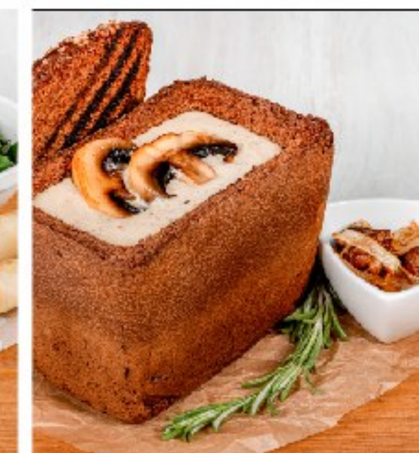
КРЕМ-СУП из лесных грибов на деревенских сливках MUSHROOM CREAM SOUP WITH FARMERS CREAM