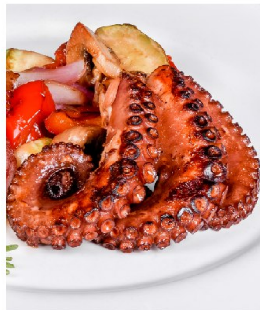
ОСЬМИНОГ НА ГРИЛЕ с овощами GRILLED OCTOPUS WITH VEGETABLES