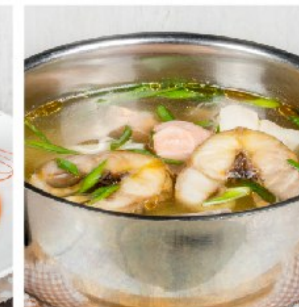
УХА со стерлядью, неркой и лососем UKHA WITH STERLET, SOCKEYE AND SALMON