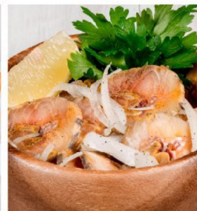
ЧУШЬ из стерляди