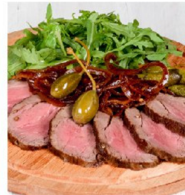
РОСТБИФ из телятины с рукколой и маринованным луком