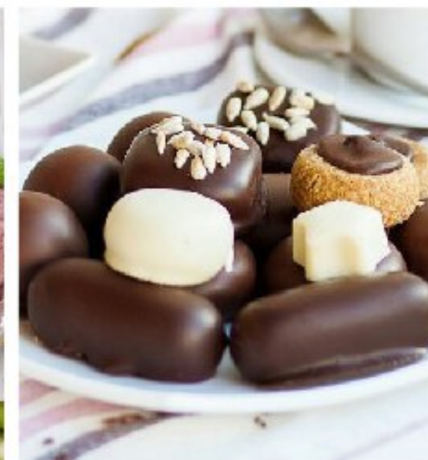
КОНФЕТЫ РУЧНОЙ РАБОТЫ