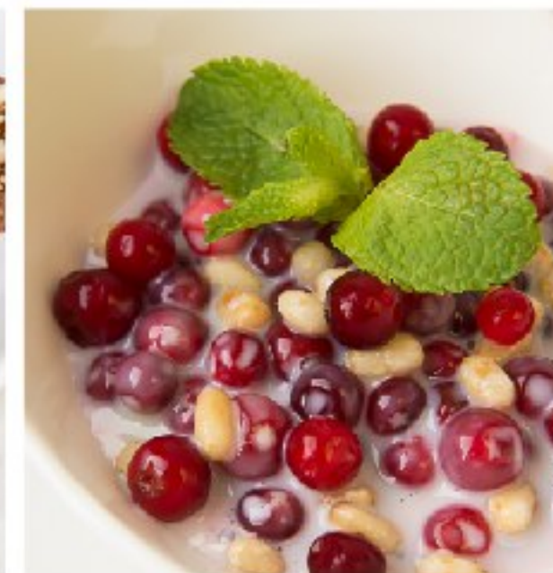
ДЕСЕРТ «ТАЁЖНЫЙ» DESSERT «TAIGA»