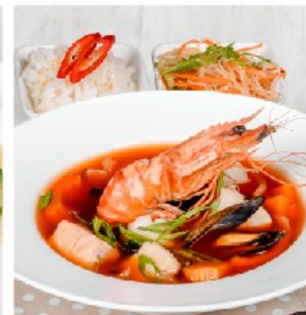
ХЕМУЛТАН острый сахалинский пикантный HEMUL'TAN HOT PIQUANT SAKHALINIAN SOUP