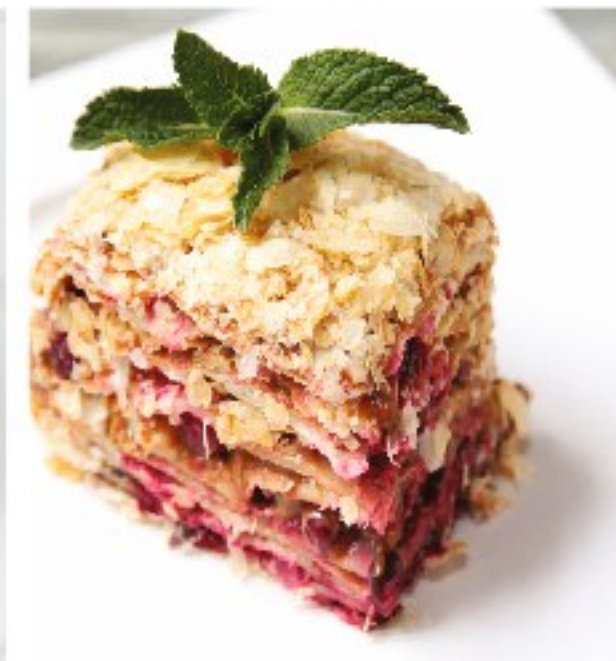
ДОМАШНИЙ СЛОЁНЫЙ ТОРТ с варёной сгущённой и брусникой