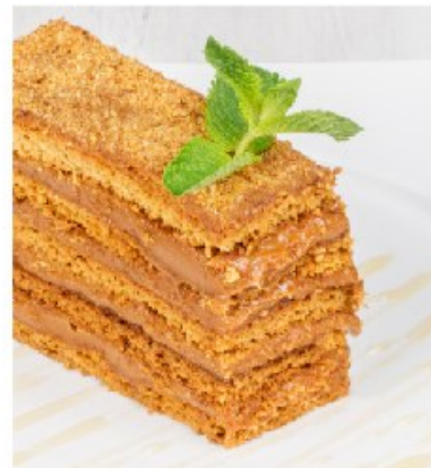
ТОРТ «МЕДОВЫЙ» HONEY CAKE