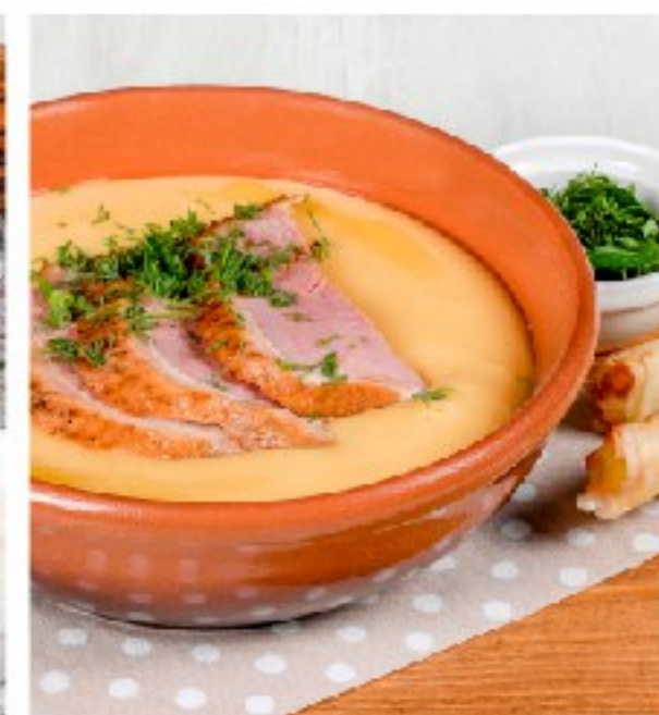
ГОРОХОВЫЙ КРЕМ-СУП с копчёным гусём PEA CREAM SOUP WITH SMOKED GOOSE