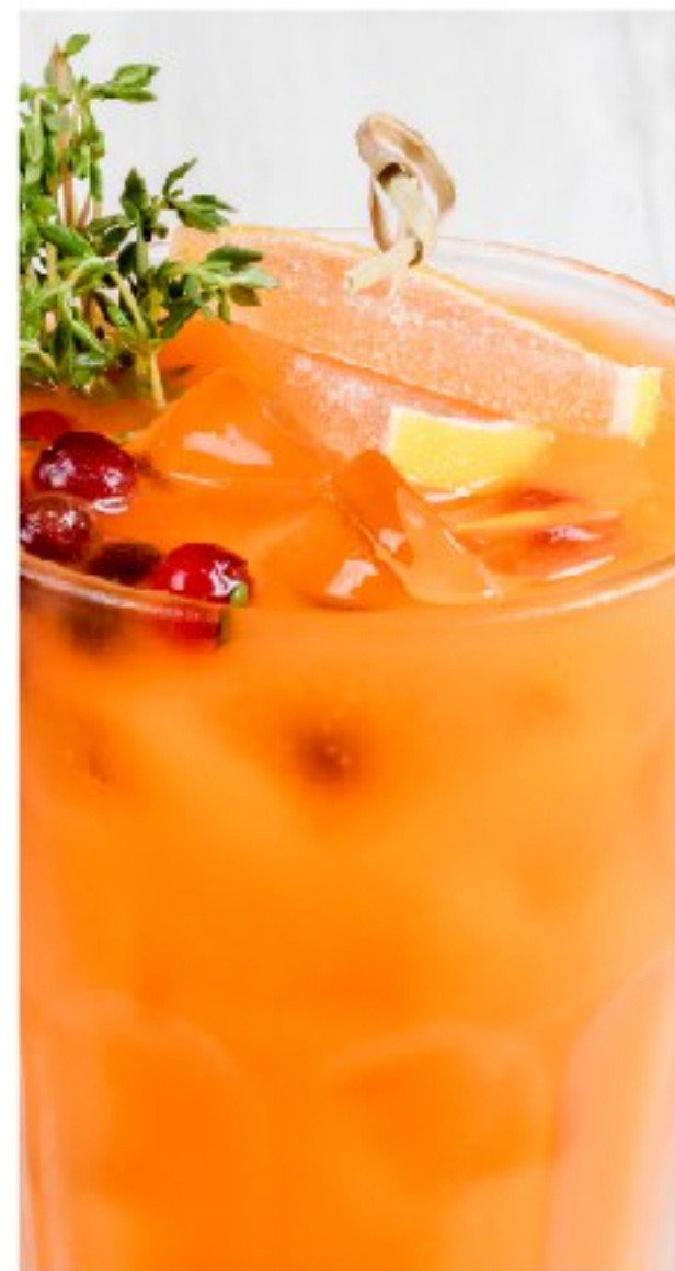
ДОМАШНИЙ ЛИМОНАД облепиховый HOMEMADE LEMONADE BUCKTHORN