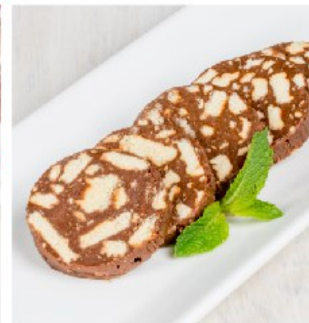
ШОКОЛАДНАЯ КОЛБАСКА с домашним печеньем

CHOCOLATE SAUSAGE WITH HOMEMADE COOKIE AND NUTS