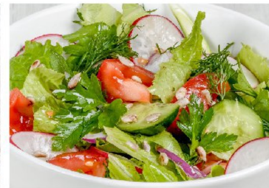
ДЕРЕВЕНСКИЙ САЛАТ с подсолнечным маслом или сметаной COUNTRY SALAD WITH SUNFLOWER OIL OR SOUR CREAM