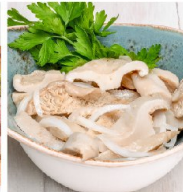
ГРУЗДИ СОЛЁНЫЕ с ароматным маслом или домашней сметаной