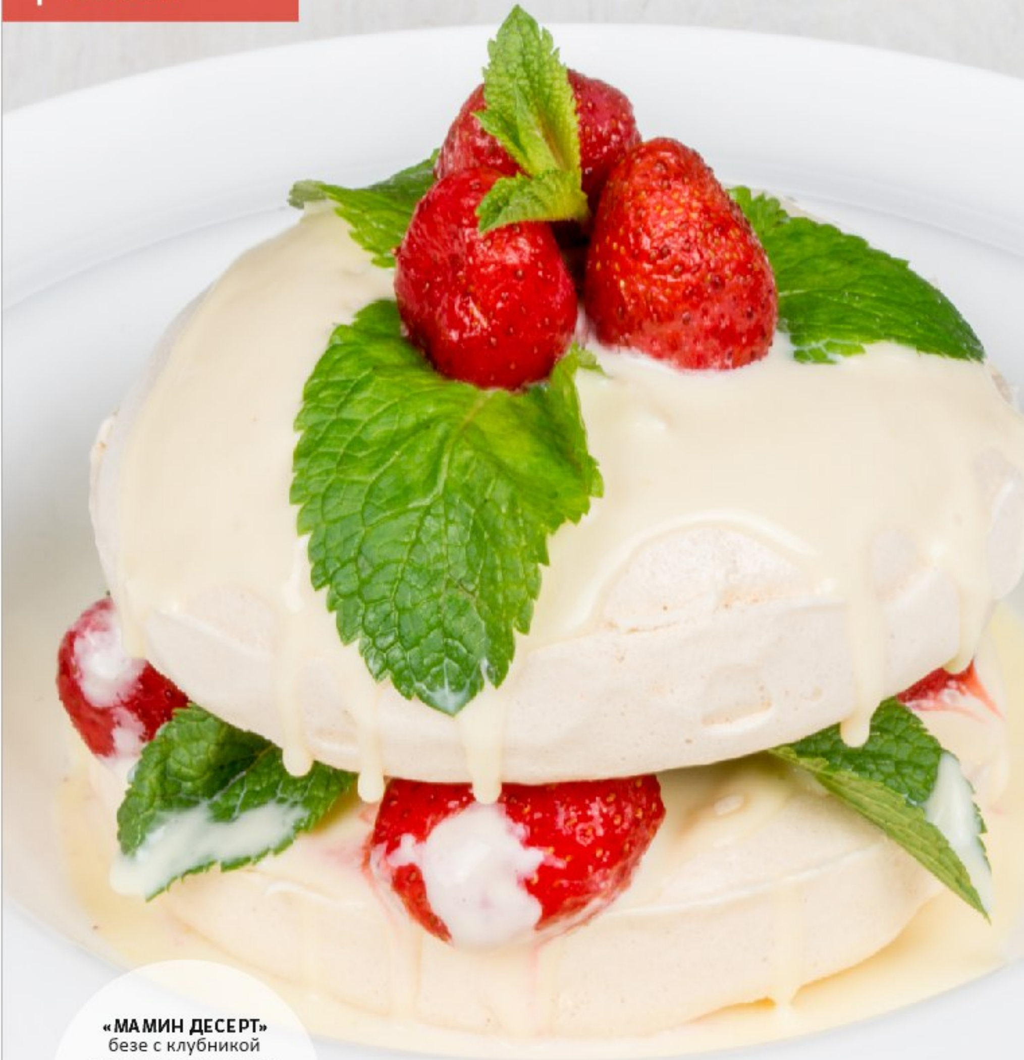
«МАМИН ДЕСЕРТ» безе с клубникой и сливочным кремом

«MOM'S DESSERT» MERINGUE WITH STRAWBERRIES AND BUTTER CREAM