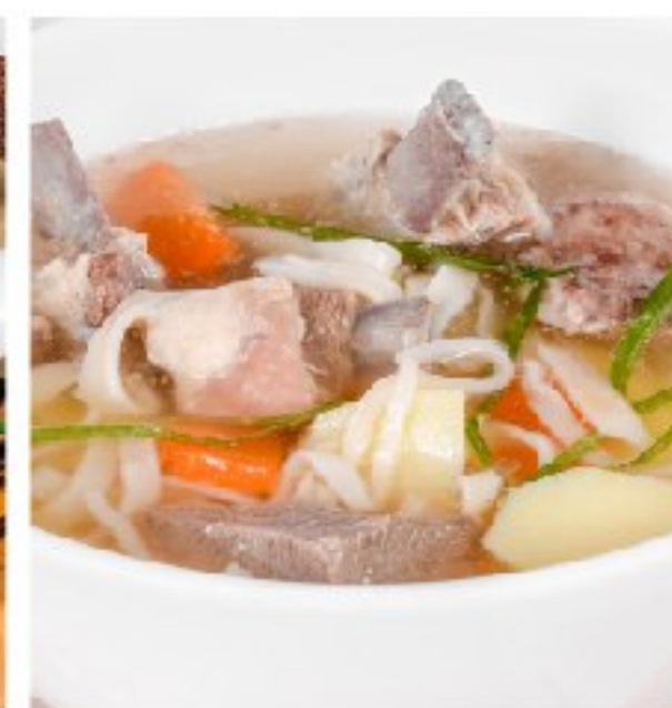
ШУЛЕН - наваристый бурятский суп из баранины и домашней лапши SHULEN - RICH BURYAT MUTTON SOUP WITH HOMEMADE NOODLES