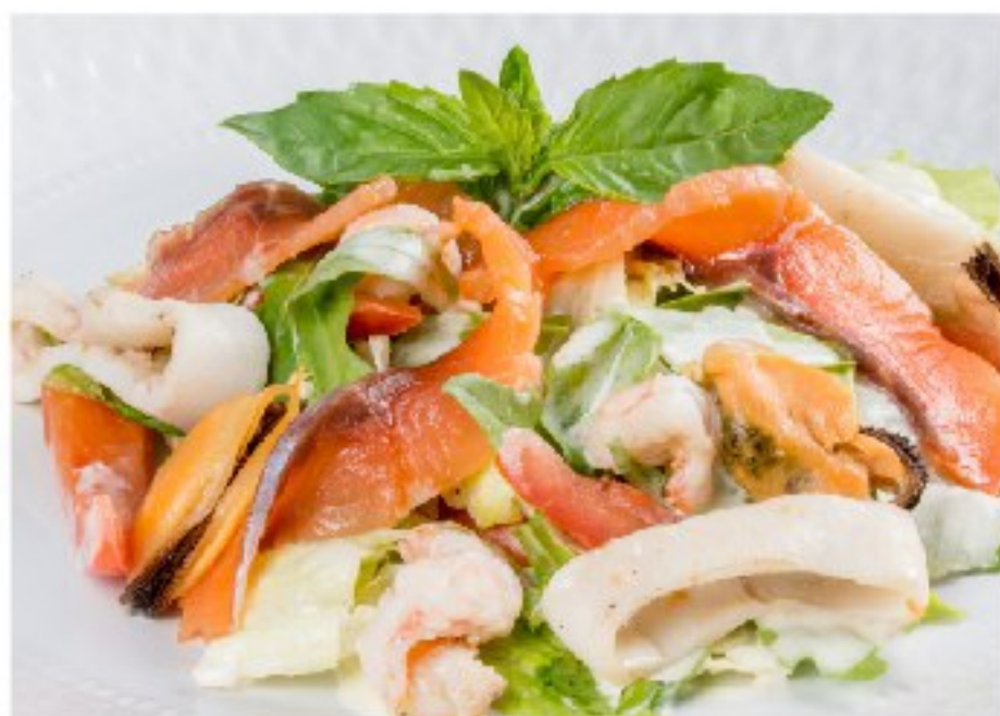
САЛАТ С МОРЕПРОДУКТАМИ И ЛОСОСЕМ на тёплом сливочном соусе SALAD WITH SEAFOOD WITH SALMON