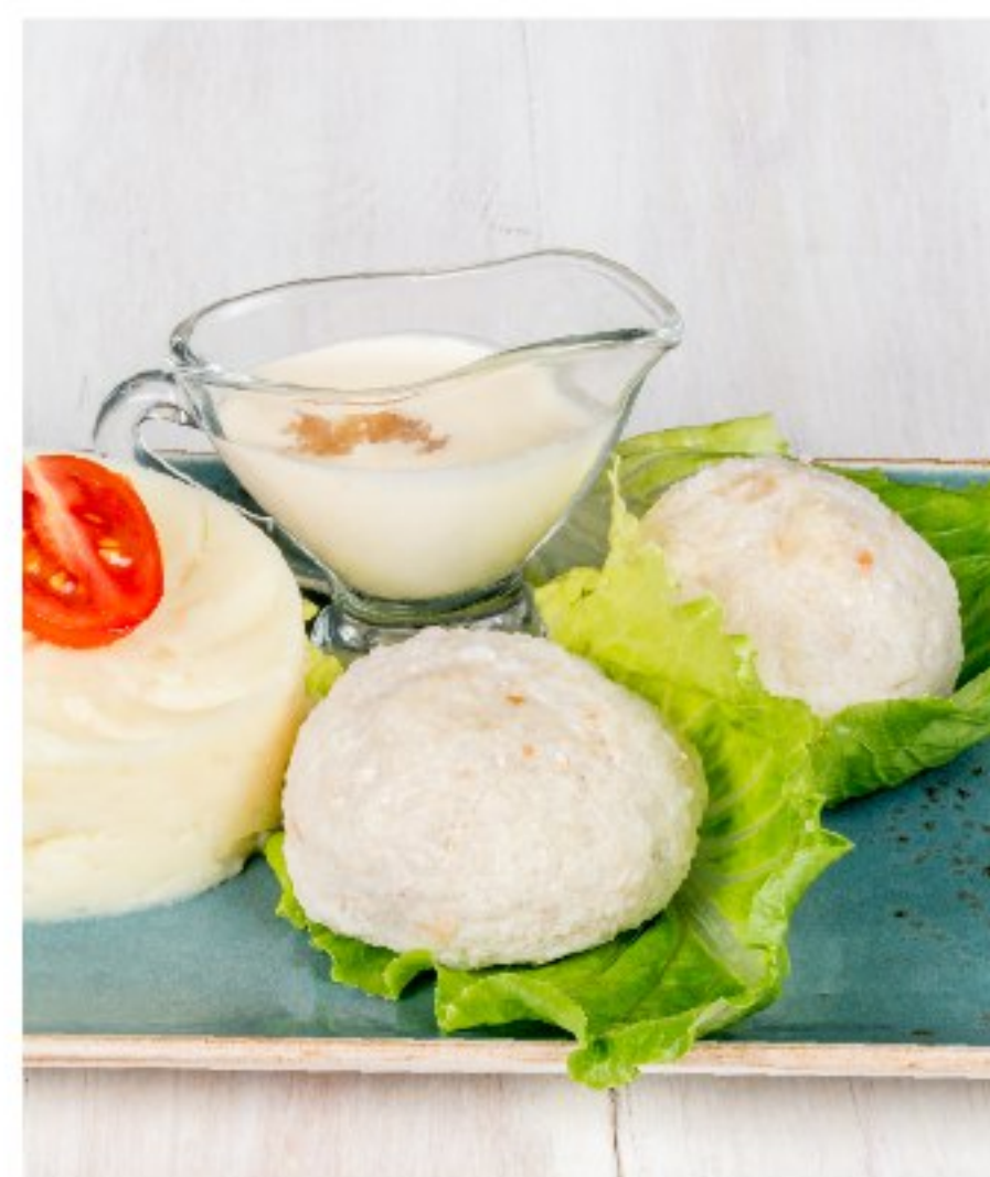
ЩУЧЬИ КОТЛЕТЫ на пару со сливочным соусом и щучьей икрой STEAM PIKE CUTLETS WITH CREAM SAUCE AND PIKE CAVIAR