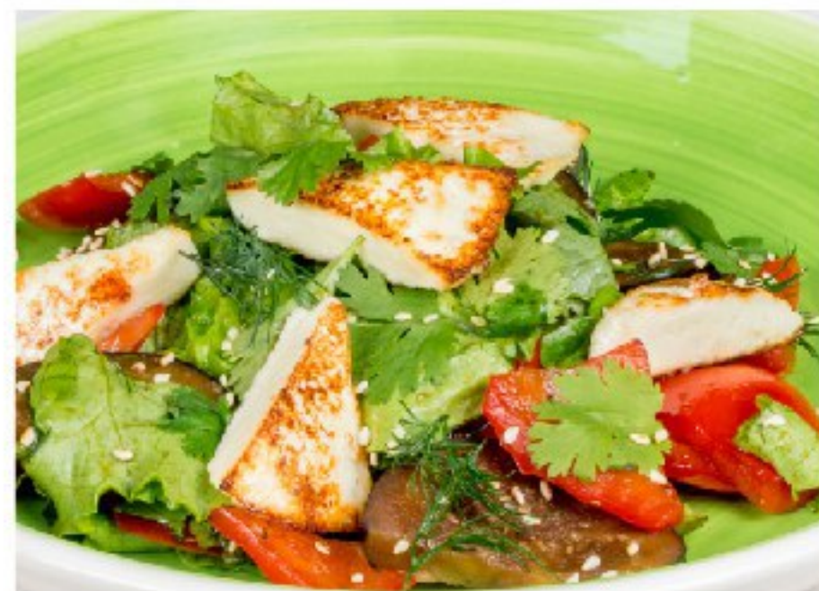
ТЁПЛЫЙ САЛАТ из печеных перцев и баклажанов с жареным адыгейским сыром и ароматной кинзой WARM SALAD WITH BAKED PEPPERS, AUBERGINES, FRIED ADYGEY CHEESE AND CILANTRO