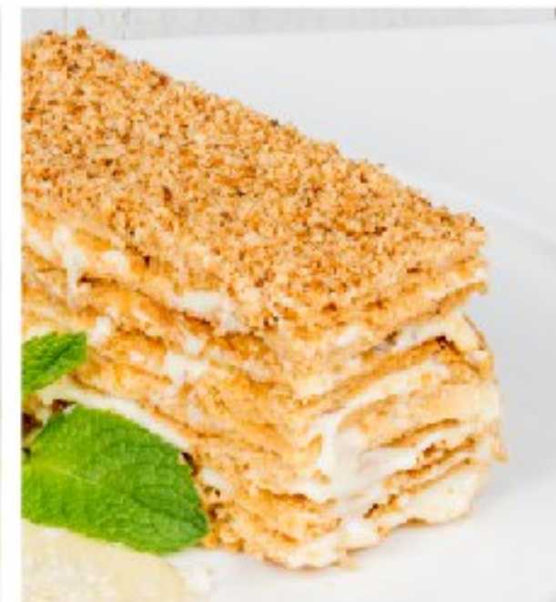
ТОРТ «НАПОЛЕОН» CAKE «NAPOLEON»