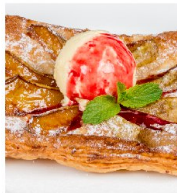
ГРУША на подушке из слоёного теста с мороженым

PEAR ON A PUFF PASTRY BED WITH ICE CREAM