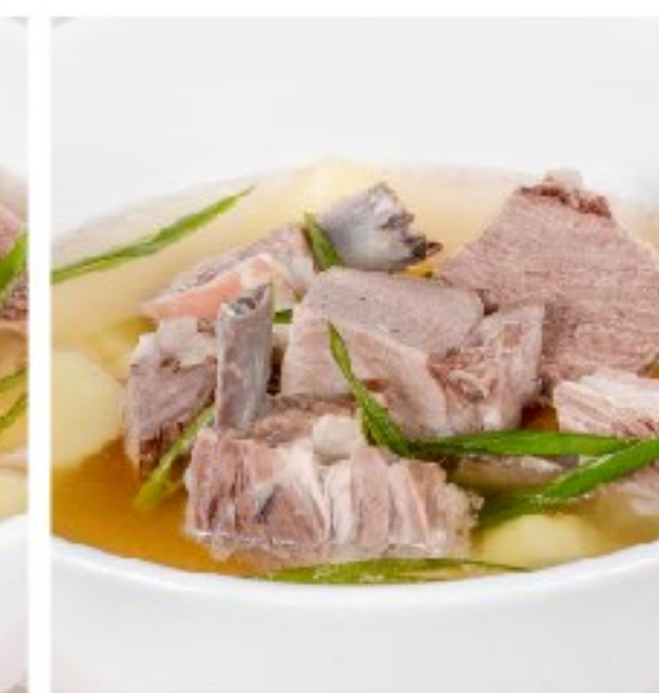
БУХЛЁР - наваристый бурятский суп из баранины и картофеля BOOHL'YER - RICH BURYAT MUTTON SOUP WITH POTATO