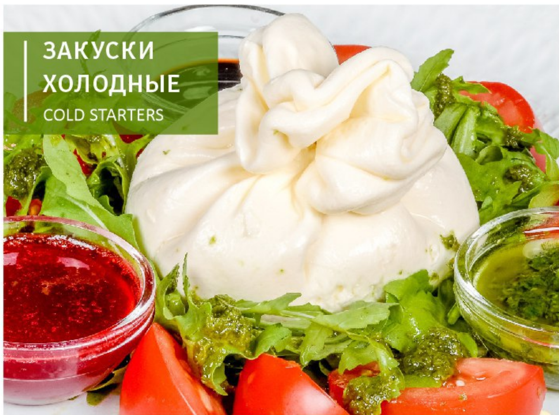
НЕЖНАЯ СЛИВОЧНАЯ БУРРАТА от сибирских фермеров TENDER CREAM BURRATA