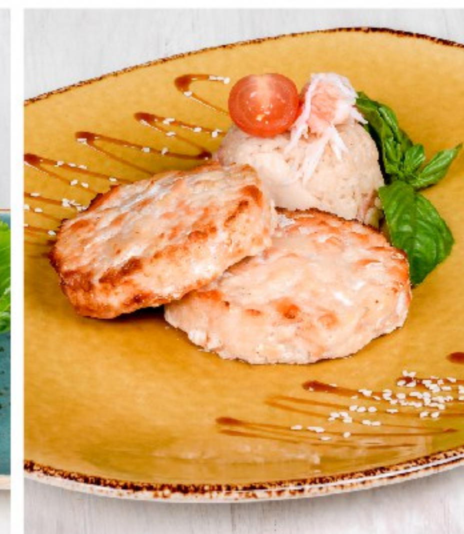
КОТЛЕТКИ из рыбы и морепродуктов с ароматным крабовым ризотто FISH CUTLETS WITH SEAFOOD AND CRAB RISOTTO