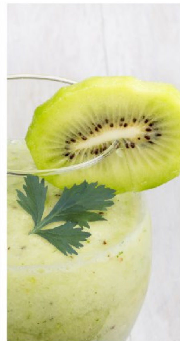
НЕЖНЫЙ МОЛОЧНЫЙ банан + груша + мороженое CREAMY MILK SMOOTHIE (banana, pear, ice cream)