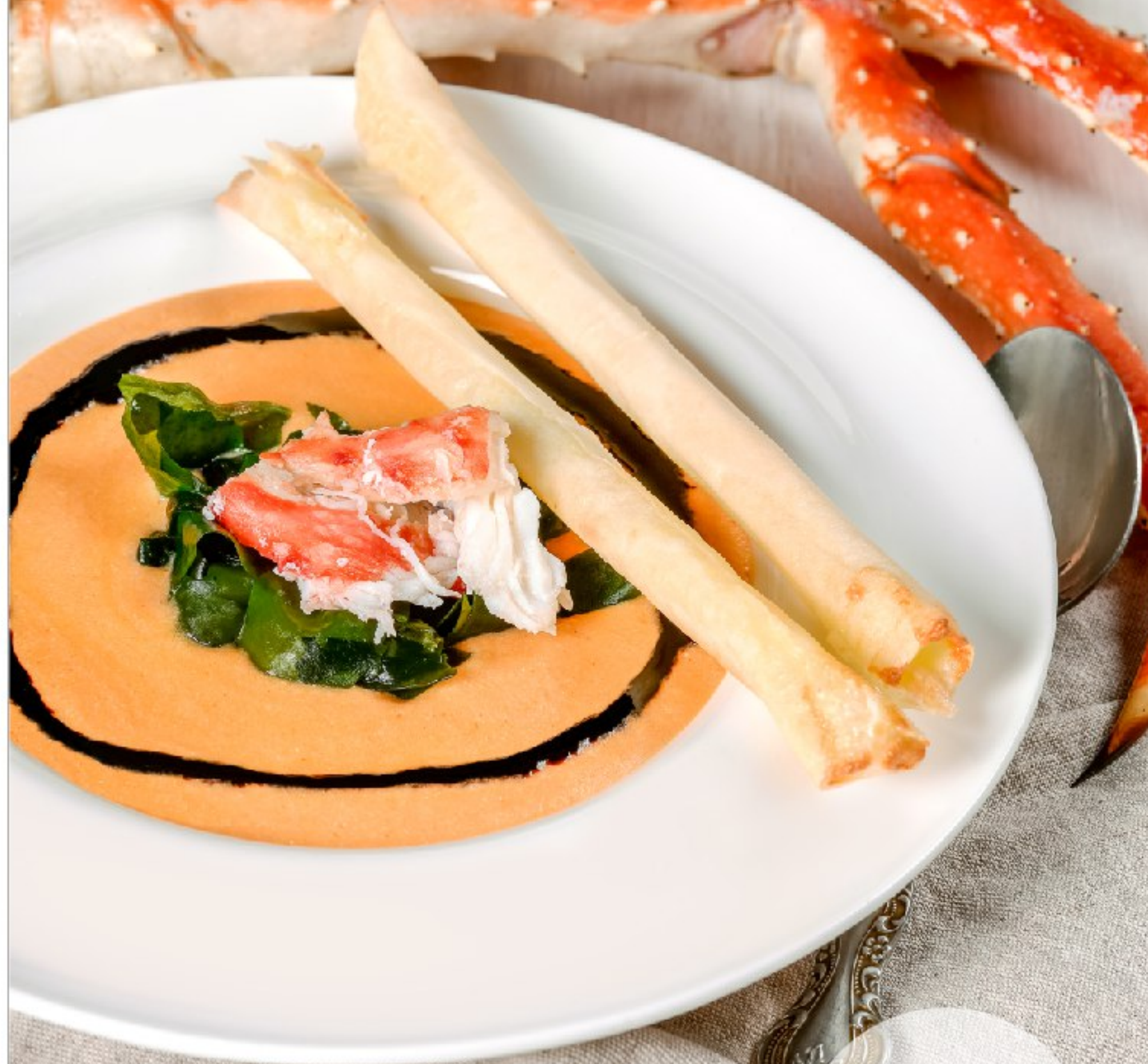
КРАБОВЫЙ СУП-ПЮРЕ CRAB CREAM SOUP 360 690