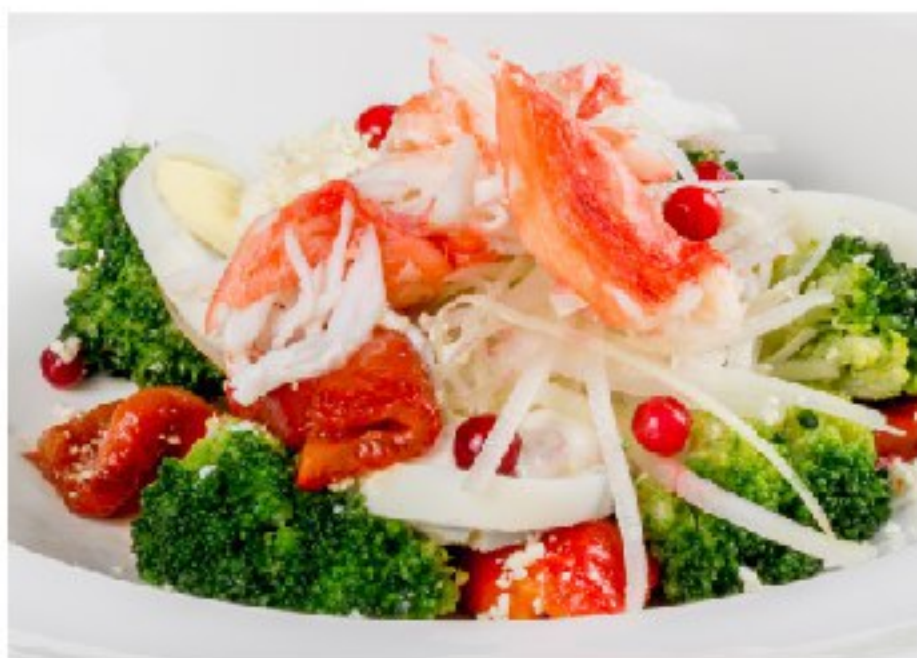
МЯСО КРАБА С СЕЛЬДЕРЕЕМ И БРОККОЛИ CRAB WITH CELERY AND BROCCOLI