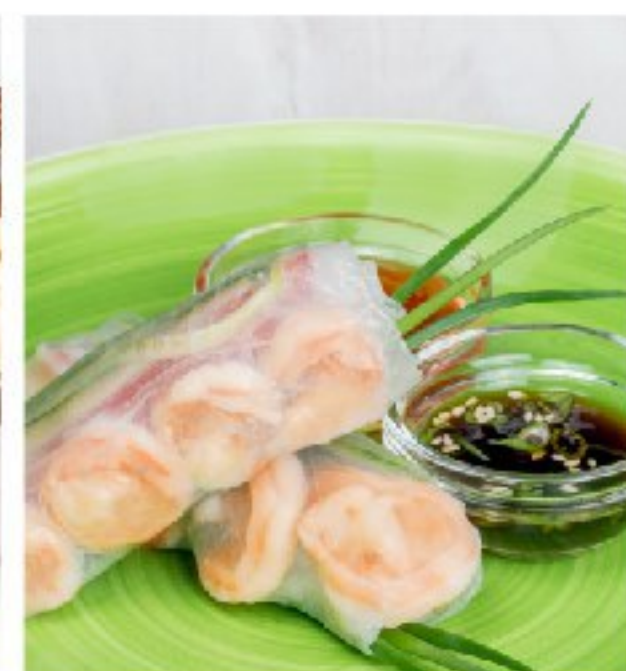
ДАЛЬНЕВОСТОЧНЫЕ БЛИНЧИКИ: спринг - роллы