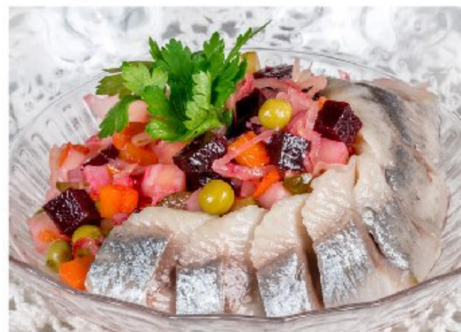
ВИНЕГРЕТ с тихоокеанской сельдью VINAIGRETTE WITH PACIFIC HERRING