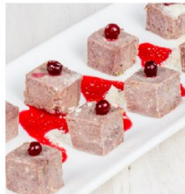
УРМА — бурятская сладость

HOMEMADE LAYER CAKE WITH DULCE CONDENSED MILK AND CRANBERRIES