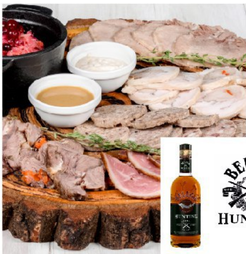
МЯСНЫЕ ДОМАШНИЕ ДЕЛИКАТЕСЫ: буженина из говядины, куриный рулет, язык, гусь копчёный, домашняя ливерная колбаса