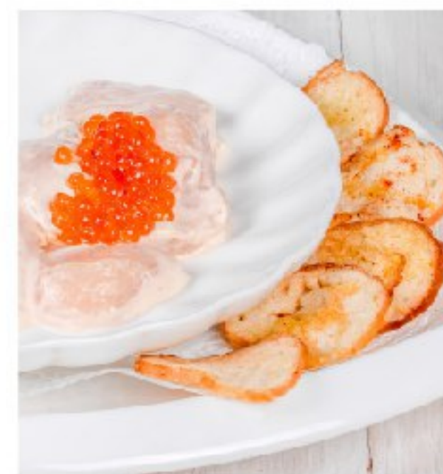
МОРСКОЙ ГРЕБЕШ ОК в горчичной заправке с сахалинской красной икрой