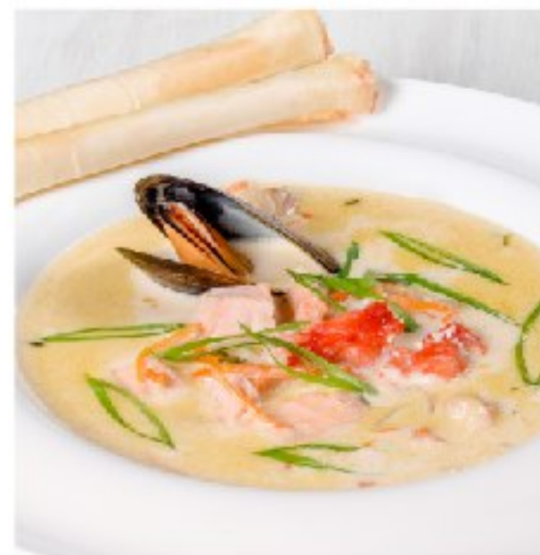
СЛИВОЧНЫЙ СУП с морепродуктами CREAMY SEAFOOD SOUP