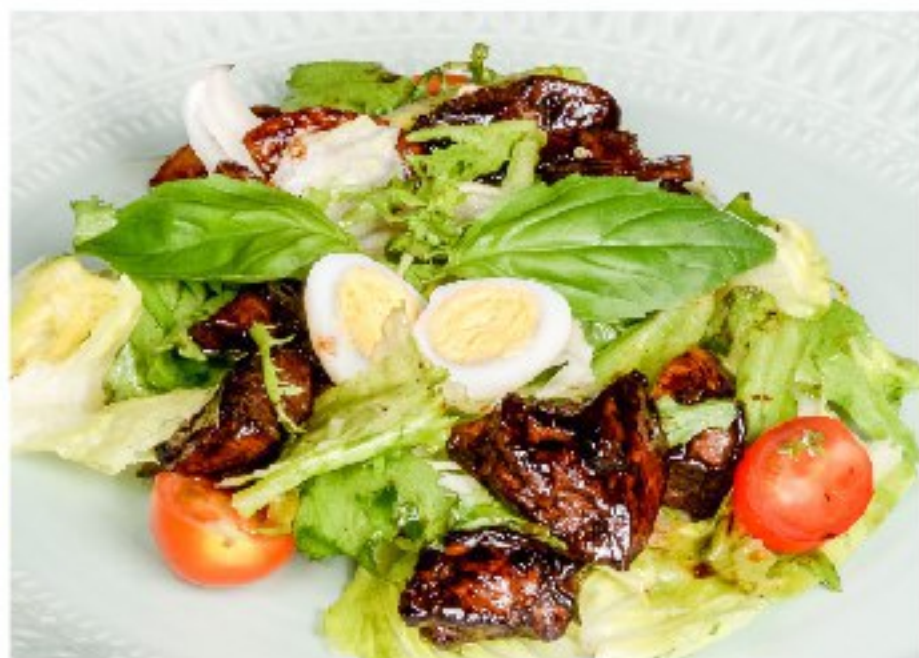
ТЁПЛЫЙ САЛАТ С КУРИНОЙ ПЕЧЕНЬЮ и шампиньонами WARM SALAD WITH HEN'S LIVER AND CHAMPIGNONS