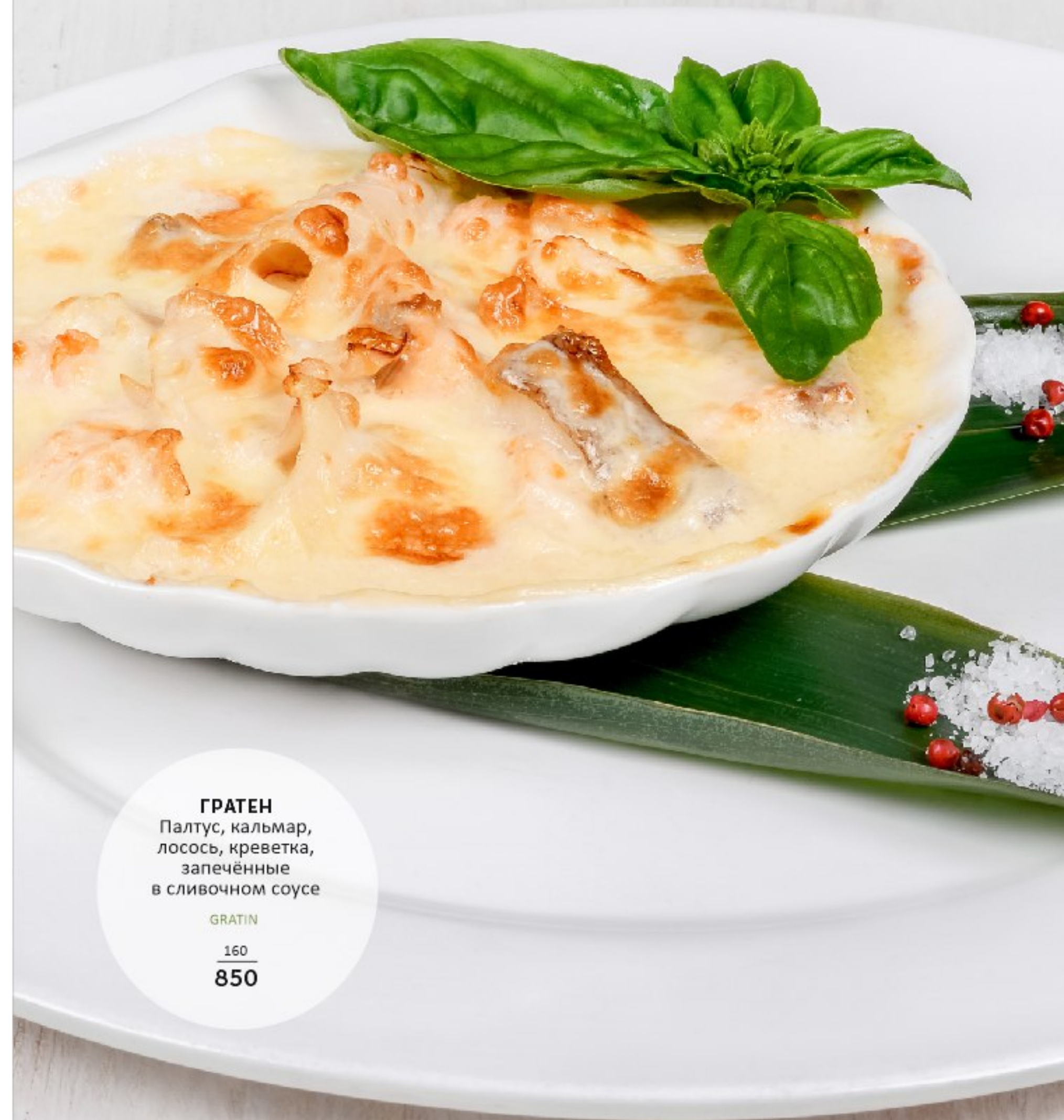
ГРАТЕН Палтус, кальмар, лосось, креветка, запечённые в сливочном соусе