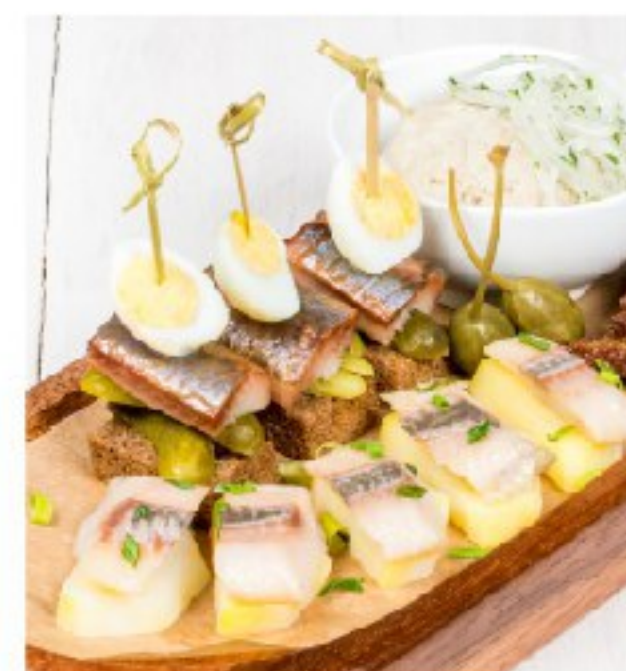
СЕЛЁДКА: слабой соли, копчёная и ледяной селёдочный сорбет