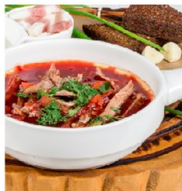
БОРЩ с говядиной BORSCH WITH BEEF