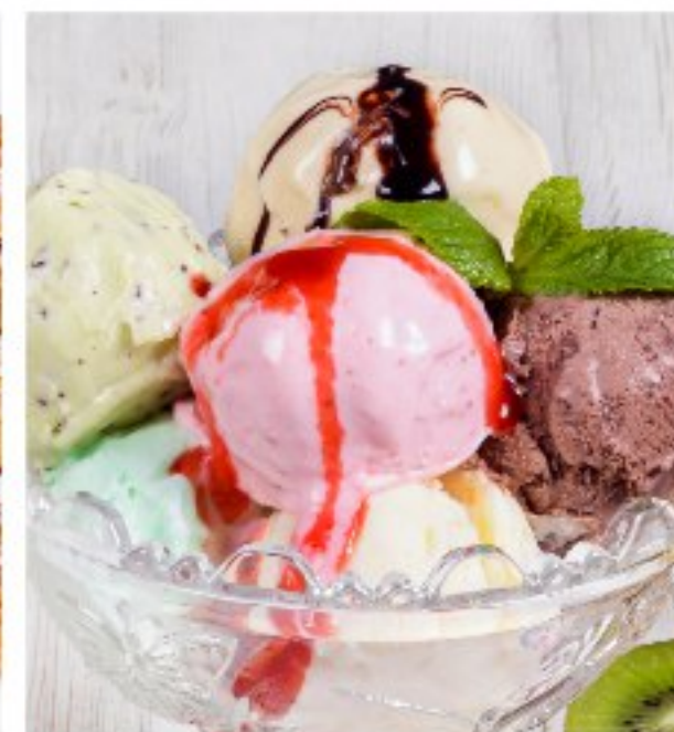
НАТУРАЛЬНОЕ МОРОЖЕНОЕ ручной работы