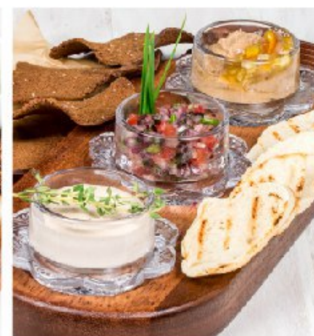
НАМАЗКИ: паштет из куриной печени, овощной тартар, тунец с плавленным сыром