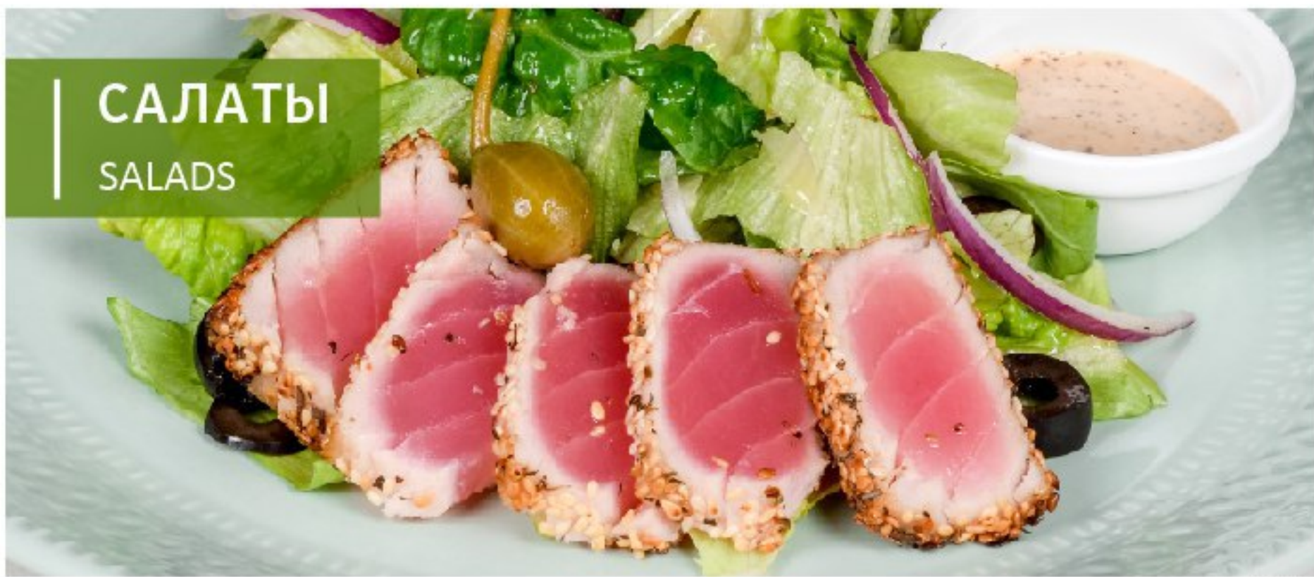
САЛАТ С ТУНЦОМ , запечённым в ароматных травах с кунжутом TUNA SALAD