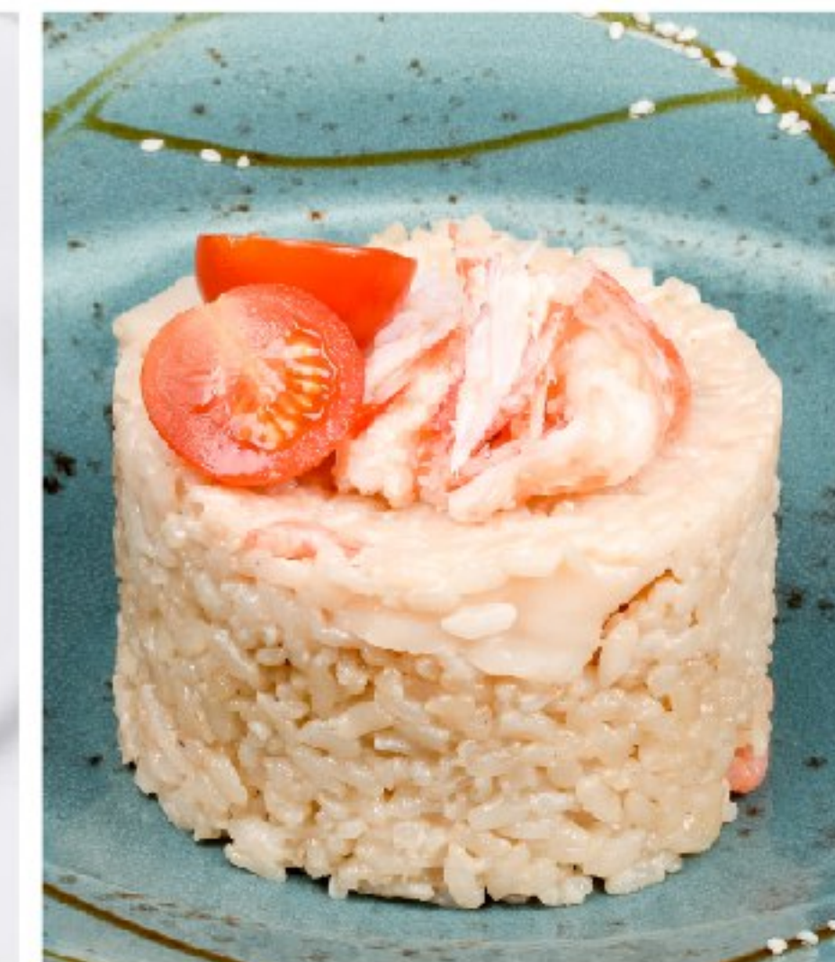
РИЗОТТО ПО-САХАЛИНСКИ с камчатским крабом, гребешком и креветками SAKHALINIAN RISOTTO WITH KAMCHATKA CRAB, SCALLOP AND MUSSELS