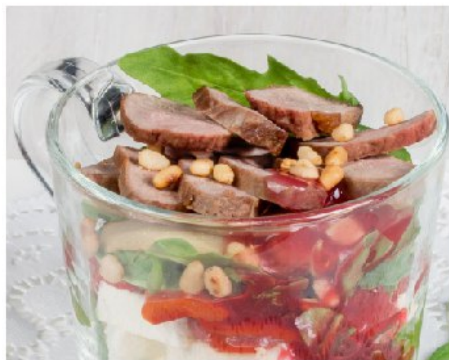
САЛАТ С УТКОЙ И ПЕЧЁНЫМИ ПЕРЦАМИ в малиновой заправке SALAD WITH DUCK AND BAKED PAPERS