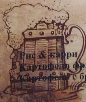
Рис & карри Картофель фри Картофель с брызгой