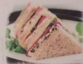
Закрытый сендвич с ветчиной и сыром