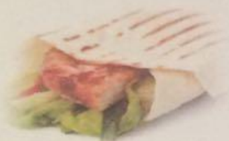
Ролл с ветчиной и томатами