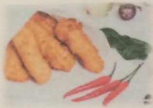
Ролл с куриной грудкой