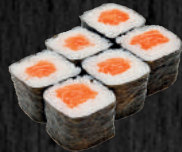
РИС ЯПОНСКИЙ, ЛОСОСЬ, ВОДОРОСЛИ НОРИ.