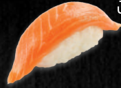
РИС ЯПОНСКИЙ, ФИЛЕ ЛОСОСЯ.