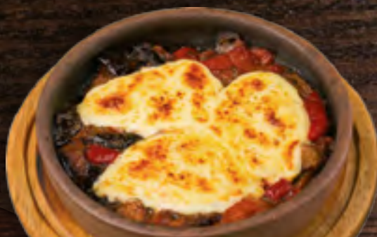
АДЖАПСАНДАЛ С СЫРОМ 340Р.