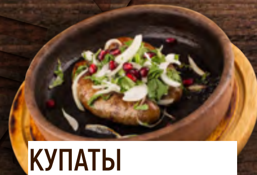
КУПАТЫ ПО-ДОМАШНЕМУ 400Р.