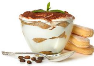
Тирамису 200 р