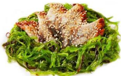
Чукка с угрем 300 р.

Копченый угорь, салат чукка, соус Гомодари