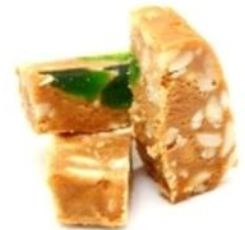
Щербет 250 р.