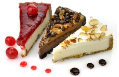
Чизкейк Нью-Йорк 200 р Чизкейк шоколадный 210 р Чизкейк клубничный 210 р