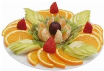
Фруктовая ваза 400 р