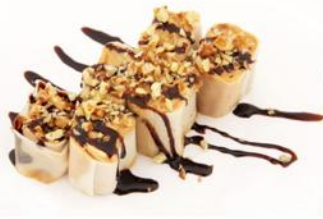
Сладкий ролл с фруктами 200 р