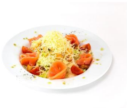
Цезарь с семгой 350 р.