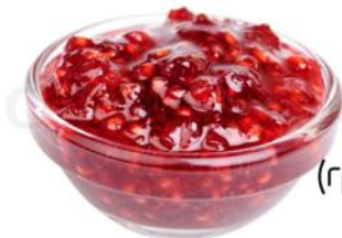
Варенье 150 р. (грецкий орех, лепестки роз, абрикос, белая черешня, клубника, малина)

Готовим десерты на заказ. Только свежие и только самые вкусные ингредиенты.