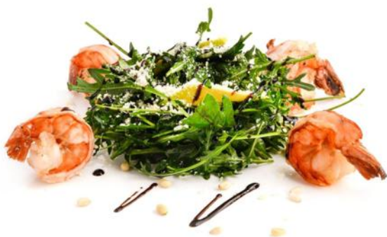
Фирменный 400 р.

Куриное филе, болгарский перец, огурцы, заправлен фирменным соусом