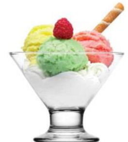
Мороженное 120 р (ваниль, клубника, шоколад, фисташка)