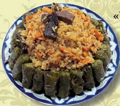
ПЛОВ «Чайханский» с долмой на костре (телятина или баранина на выбор)