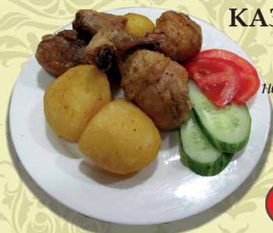
КАЗАН-КАБОБ из курицы (жареные куриные ножки с картофелем, специи)