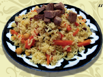
ПЛОВ “Праздничный” (телятина, рис, морковь, лук, нут, изюм, специи)