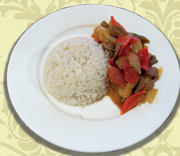
ГОН-ФАНГ (рис, поджарка из телятины и овощей, сельдерея, специи)