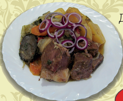
ДЫМЛЯМА на костре (телятина или баранина на выбор, овощи)