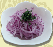
ЛУК МАРИНО- ВАННЫЙ в уксусе