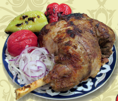
НОЖКА БАРАНЬЯ запеченная