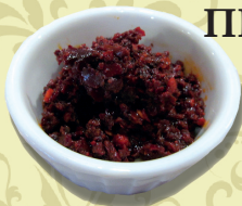
ПРИПРАВА ГОРЬКАЯ (перец горький, томат, специи, уксус)