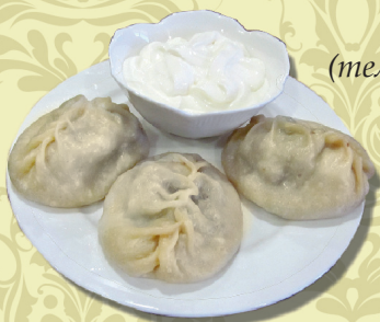
МАНТЫ (телятина, лук, специи, готовятся на пару)