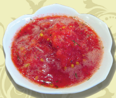
СОУС ИЗ ПОМИДОР (протёртые помидоры, зелень, чеснок)