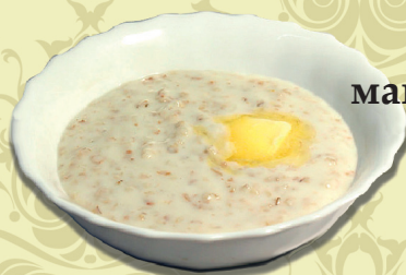
КАША манная/рисовая на молоке