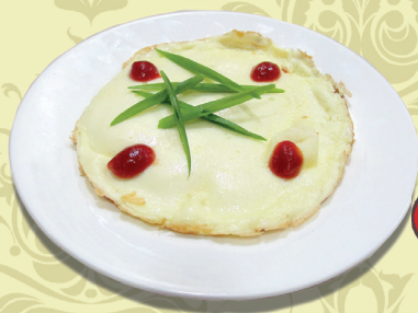
ОМЛЕТ из яиц