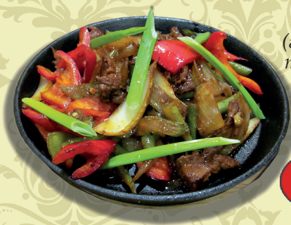
ГУШТ-САЙ (готовится в воке, телятина, овощи, чеснок, специи)