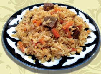
ПЛОВ “Чайханский” (телятина, рис, морковь, лук, специи)