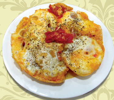
ЯИЧНИЦА с помидорами