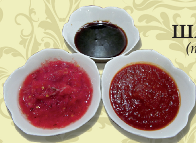
СОУС ШАШЛЫЧНЫЙ (томатный, ткемали, наришараб)