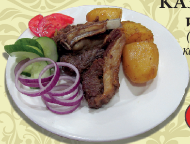
КАЗАН-КАБОБ из баранины (жареная корейка с картофелем, специи)