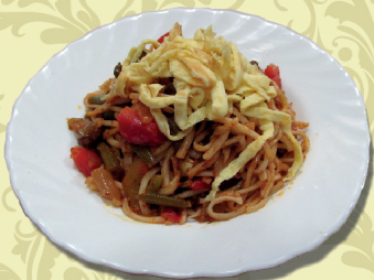
ЛАГМАН КАУРМА (домашняя лапша, обжаренная с телятиной и овощами, омлет яичный, специи)