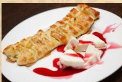
ШТРУДЕЛЬ с фруктами (подаётся с мороженым)