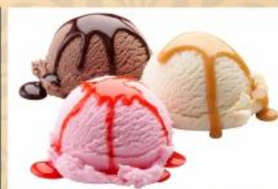
МОРОЖЕНОЕ (клубничное, ванильное, шоколадное)