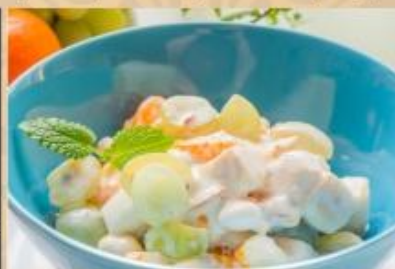
ФРУКТОВЫЙ САЛАТ (банан, яблоко, апельсин, йогурт)