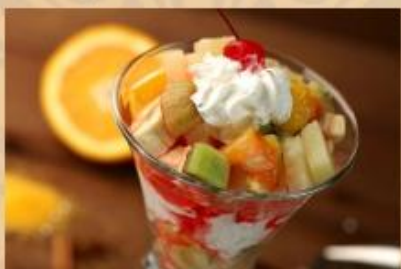
МОРОЖЕНОЕ с фруктами (мороженое, банан, апельсин, яблоко)