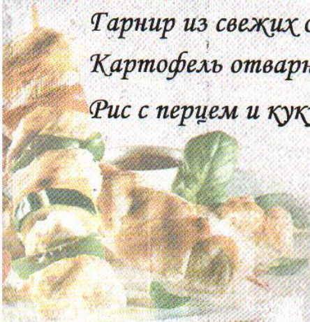
Рис с перцем и кукурузой 200 100=

Картофель отварной с сливочным маслом 200 100=