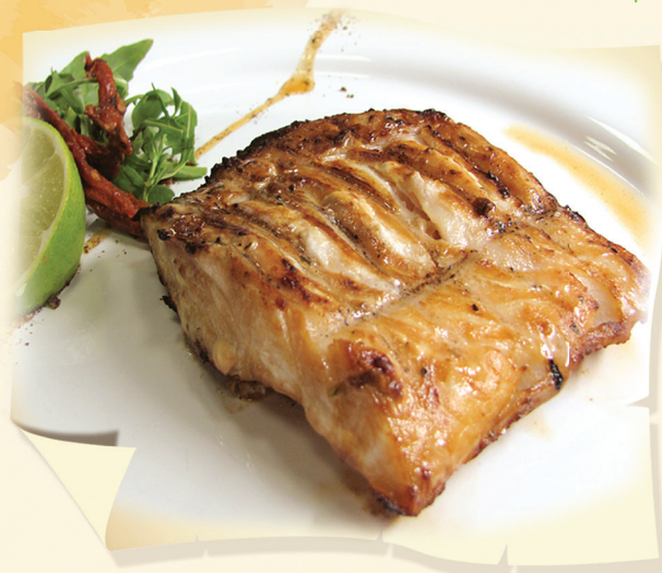
Филе трески (200/50 г) ..... 650 руб. Северное море