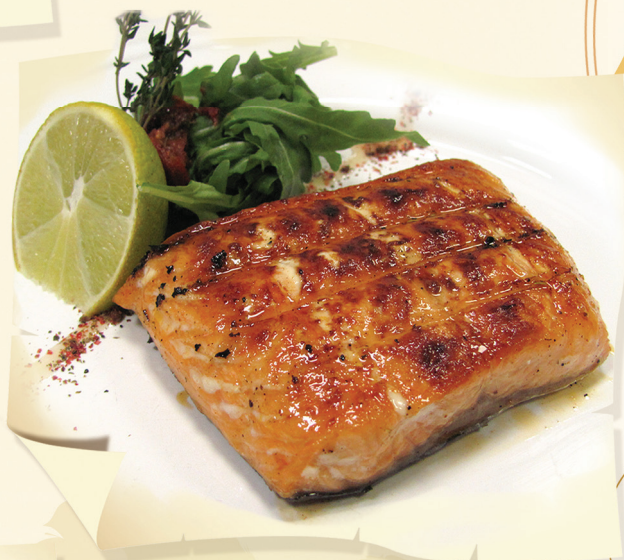
Филе сёмги (200/50 г) ..... 750 руб. Фарерские острова