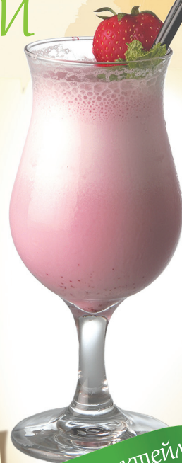
Молочный коктейль клубничный

Тархун, облепиховый, малиновый, огуречный или имбирный