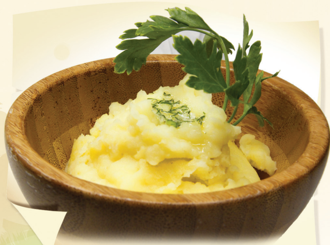
Картофельное пюре (100 г) ..... 210 руб.