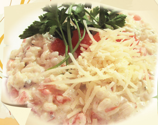
Рис «Арборио» с сырами «Дор блю», «Пармезан», «Маасдам», сливками и свежей зеленью