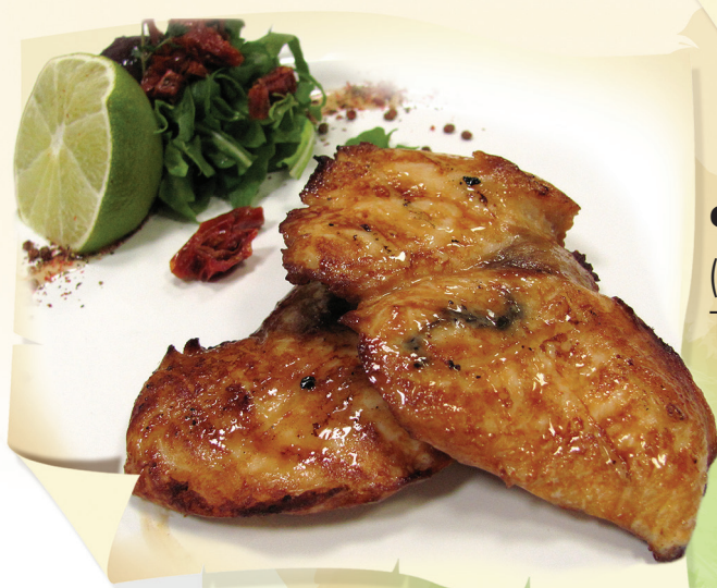
Филе масляной рыбы (200/50 г) ..... 650 руб. Тихий океан