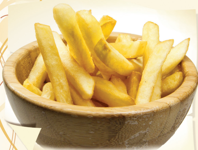
Картофель фри (100 г) ..... 210 руб.