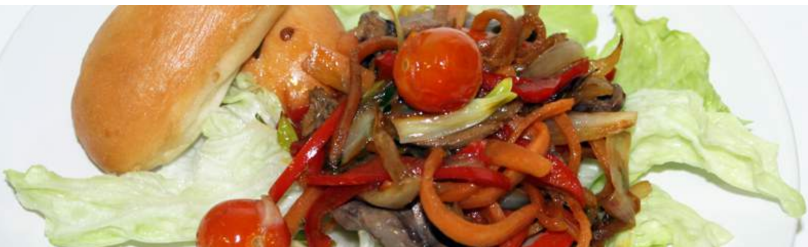
Тёплый салат с языком 270гр 295₽ Телячий язык, овощи, обжаренные с острым соусом, на хрустящих листьях салата.