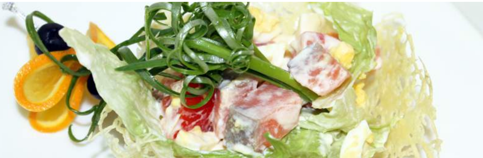
Салат «Ницца» 250гр 285₽ Филе маринованной сёмги с овощами, в сливочном соусе, подаётся в корзинке из Пармезана