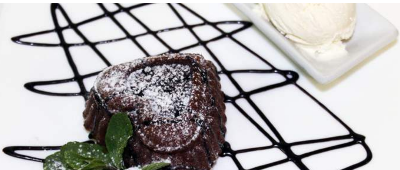
Шоколадный кекс 160гр 220₽ С вытекающей начинкой, подается с шариком ванильного мороженого.