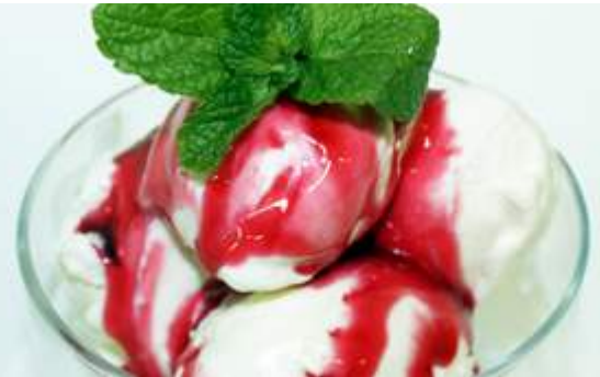
Мороженое 100гр 50₽ на выбор: орехи, шоколад, сироп