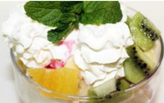
Мороженое с фруктами 100гр 60₽ кусочки фруктов в ягодном соусе под шапочкой из взбитых сливок