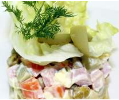
Столичный салат на выбор 200гр 225₽ С ветчиной, курицей или слабосоленой сёмгой.