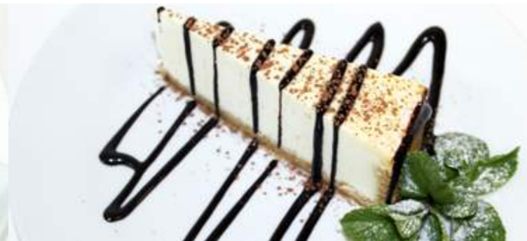
Чизкейк ванильный 90гр 210₽ Традиционный Американский, сырный десерт.