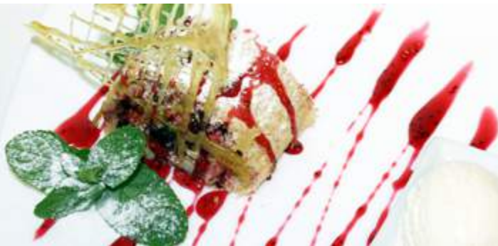
Вишневый штрудель 220гр 180₽ Традиционный Венский штрудель со свежей вишней и яблоками в слоеном тесте. Подается с шариком ванильного мороженого и шоколадным соусом