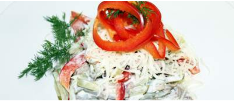
С языком и болгарским перцем 200гр 260₽ Перец болгарский, сыр Моцарелла, сельдерей, корнишоны, язык говяжий, майонез