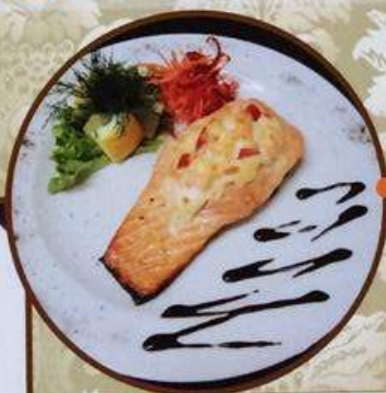
Судак в белом вине