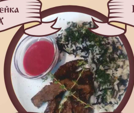
Вырезка телятины с розмарином