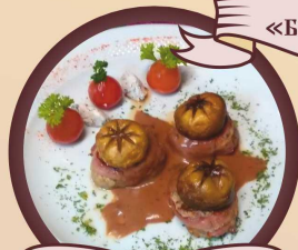
Медальоны из телятины