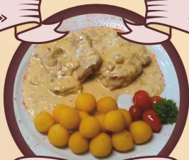
Свинина под соусом из белых грибов