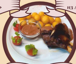
Баранья корейка на ребрах