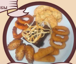
Большой пивной микст