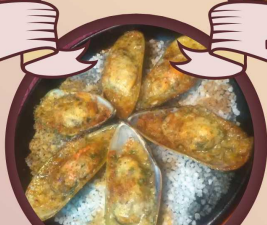
Мидии «Гигант киви»