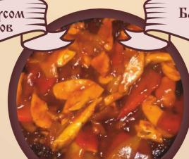
Фахитас из телятины