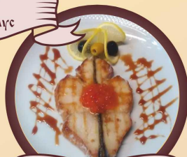
Стейк из масляной рыбы