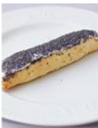
«Белучи» 60г. - 50руб.

Трубочка из нежного рубленого слоеного теста с маковой начинкой на основе мака, изюма и вареного сгущеного молока. Покрывается сахарной помадкой и обсыпается маком.