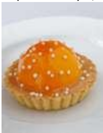
«Валенсия» 150г. - 120руб. В корзинку из песочного теста с добавлением апельсиновой цедры укладывается нежнейший сливочный мусс на основе натуральных сливок, мякоти апельсина и ликера «Куантр

Трубочка из нежного рубленого слоеного теста с маковой начинкой на основе мака, изюма и вареного сгущеного молока. Покрывается сахарной помадкой и обсыпается маком.