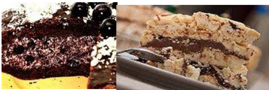
Торт с вишней. Торт с безе внутри