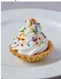
«Марибель» 50г. - 60руб.

Натуральные домашние конфеты из нежного бисквита в сочетании с кремом из сгущеного молока, покрытые шоколадом.