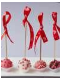
«Кейкпопс» 35г. - 40руб.

Натуральные домашние конфеты из нежного бисквита в сочетании с кремом из сгущеного молока, покрытые шоколадом.