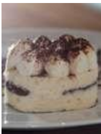
80г. - 110руб. Тирамису

Тонкий слой ванильного бисквита, покрывается массой «Чизкейк», состоящей из натуральных сливок, ванильного творожка и персика.