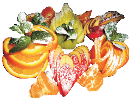
ФРУКТОВОЕ АССОРТИ 400гр - 500руб

(НАРЕЗКА ИЗ СЕЗОННЫХ ФРУКТОВ, УКРАШЕНИЯ 74ККАЛ)