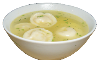
ЧУЧВАРА 300гр - 190 руб