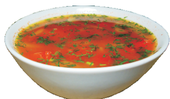
МАСТАВА 300гр - 190 руб

(АЗИАТСКИЙ СУП С РИСОМ И ОВОЩАМИ 174ККАЛ)