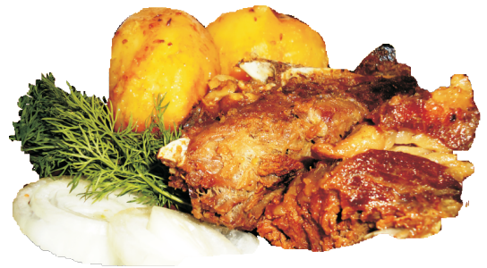
КАЗАН-КАБОБ 350гр - 390 руб (МЯСО ТОПЛЁНОЕ С КАРТОФЕЛЕМ 274ККАЛ)