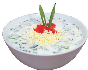
ОКРОШКА 350гр - 190 руб