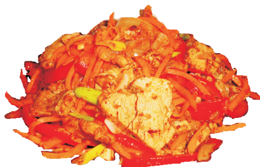
ХЕ ИЗ МЯСА 150гр - 190 руб (МЯСО ЗАВАРЕННОЕ В УКСУСЕ С ОВОЩАМИ 196ККАЛ)