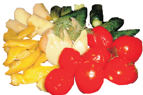
СОЛЁНОЕ АССОРТИ 500гр - 350руб

(ПОМИДОРЫ, ОГУРЦЫ, КАПУСТА РАЗНЫХ ПОСОЛОВ 72ККАЛ)