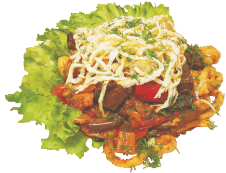
КАУРМА 300гр - 270 руб (ЖАРЕНАЯ УЙГУРСКАЯ ЛАПША С МЯСОМ, ОМЛЕТОМ И ОВОЩАМИ 236ККАЛ)