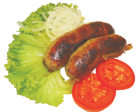
КОЛБАСКИ ЗА 100гр - 150 руб (ДОМАШНИЕ СВИНЫЕ КОЛБАСКИ 310ККАЛ)