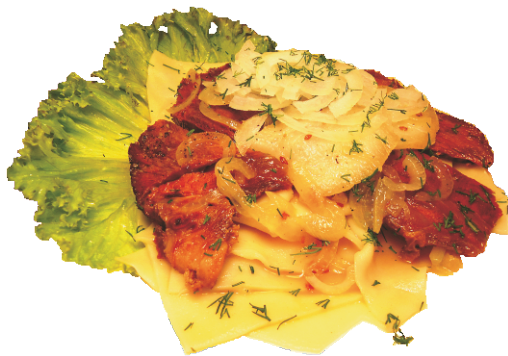
БЕШБАРМАК 300гр - 390 руб (КАЗАХСКОЕ НАЦИОНАЛЬНОЕ БЛЮДО ОТВАРНОЕ ТЕСТО С ВЯЛЕННЫМ МЯСОМ 254ККАЛ)