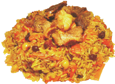
ПЛОВ (ОШ) 300гр - 250 руб (НАЦИОНАЛЬНОЕ ВОСТОЧНОЕ БЛЮДО 287ККАЛ)