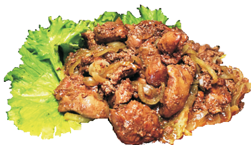
ДЖИГАРИКИ 200гр - 190 руб (ОБЖАРЕНАЯ КУРИНАЯ ПЕЧЕНЬ С ЛУЧКОМ 218ККАЛ)