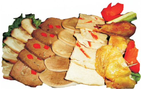
МЯСНОЕ АССОРТИ 500гр - 950руб

(РУЛЕТЫ: ГОВЯЖИЙ, КУРИНЫЙ, СВИНОЙ, САЛО 247ККАЛ)