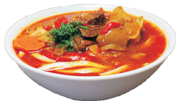
ЛАГМАН 350гр - 270 руб

(УЙГУРСКАЯ ЛАПША С МЯСОМ И ОВОЩАМИ 186ККАЛ)