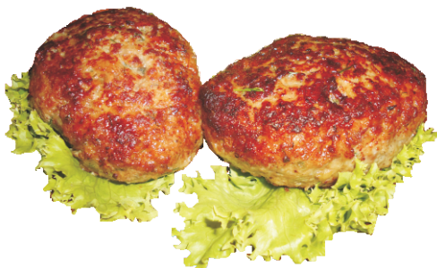
КОТЛЕТЫ ДОМАШНИЕ 250гр - 290 руб (СВИНО-ГОВЯЖИЙ ФАРШ 246ККАЛ)