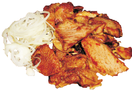
ДЖИЗ ГОВЯДИНА за 100гр - 250 руб (ФИЛЕ ОБЖАРЕННОЕ В СОБСТВЕННОМ СОКУ 253ККАЛ)