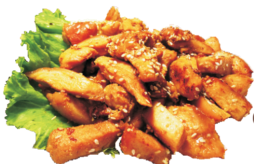
ЖУЖАЛАРКА 150гр - 190 руб

(ОБЖАРЕННОЕ КУРИНОЕ ФИЛЕ В СОЕ С КУНЖУТОМ 152ККАЛ)