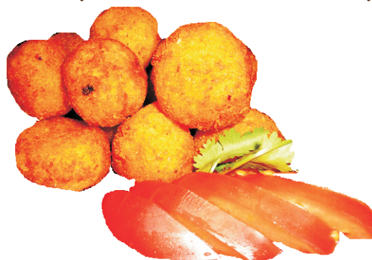
БУГИРСОКИ 150гр - 90 руб (ЖАРЕНИЕ КАРТОФЕЛЬНЫЕ ШАРИКИ 198ККАЛ)

(ОБЖАРЕННОЕ КУРИНОЕ ФИЛЕ В СОЕ С КУНЖУТОМ 152ККАЛ)