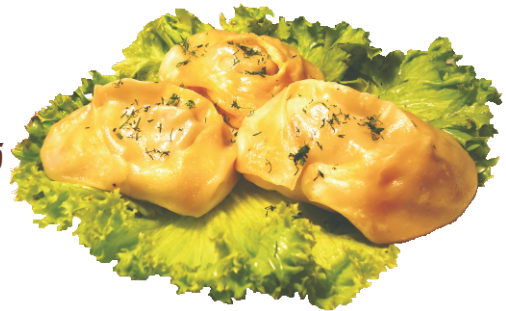
МАНТЫ (1шт) 90гр - 80 руб МАНТЫ ЖАРЕННЫЕ (1шт) - 90 руб (С НАЧИНКОЙ ИЗ РУБЛЕННОГО МЯСА 204ККАЛ)