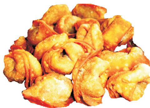
ЧУЧВАРЯТА 200гр - 190 руб (ЖАРЕНИЕ ВОСТОЧНЫЕ ПЕЛЬМЕШКИ 226ККАЛ)