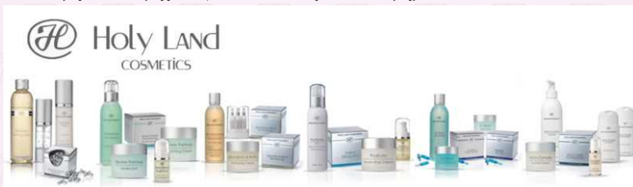
Holy Land - уникальная косметика (Израиль)

Компания HL Laboratories (Holy Land) разрабатывает и производит косметическую продукцию, предназначенную только для профессионалов в области косметологии - дерматологов, эстетистов, пластических хирургов. Компания HL Laboratories (Holy Land) в 2013 году отметит тридцатилетие со дня основания и все это время не только противостоит жесткой конкуренции на косметическом рынке, но и постоянно развивается и радует специалистов новыми уникальными разработками.