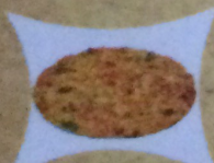
Пицца с мясом акулы

рыба акула, креветки, сыр, соус итальянский, помидоры маслины, томаты