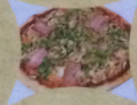
Пицца с курицей и беконом

(сыр, беки, курица грудки, маслины, итальянский соус)