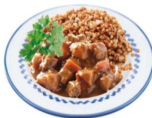
Гречка с Гуляшом по «Венгерски» 120/170 гр