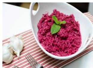
Свекла с Майонезом 125гр