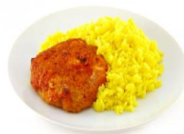
Котлета(куриная) с Рисом 160/120 гр