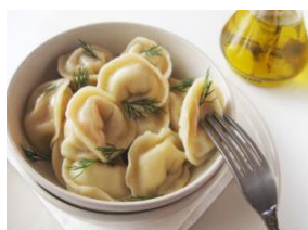
Пельмени Русские ( Сметана) 220гр