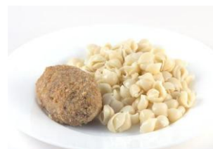
Котлета(рубленая) с Макаронами 160/120 гр