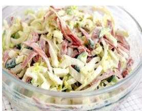
Салат Днестровский 125гр