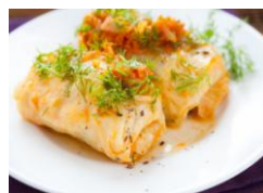
Голубцы (Сметана) 270гр