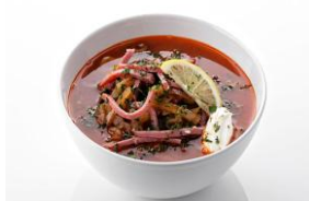
Солянка сборная 250гр