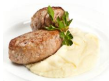
Пюре с Котлетой 170/130