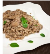
Гречка с печенью 180/120гр