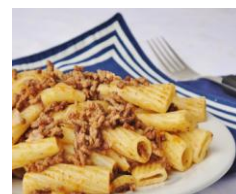
Макароны по-флотски 270гр