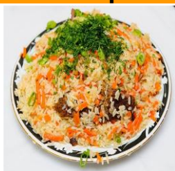
Плов «Бухарский» 300гр