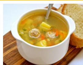
Суп с Фрикаделями 250гр