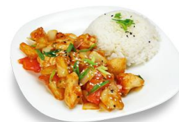
Рис с курицей в кисло-сладком соусе 120/170