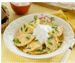
Вареники с Сметаной 250гр