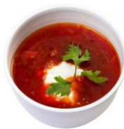
Борщ Украинский 250гр