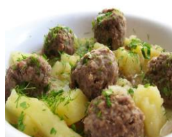
Картошечка С тефтелями 170/130гр