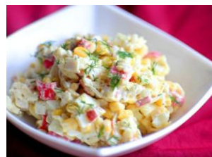
Салат с Крабовых палочек 125гр