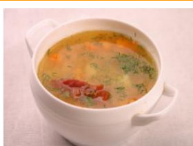
Суп Гороховый 250гр