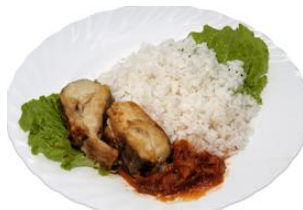
Рис с рыбой 180/120гр