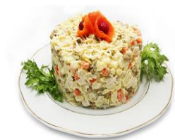
Салат Оливье 125гр