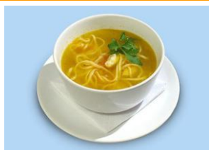
Суп с курицей и лапшой 250гр