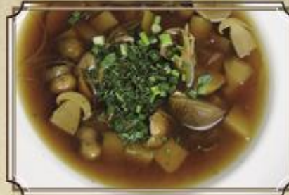
Похлебка грибная ..... 350 с перловой дробью 400/50 г.