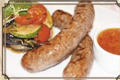
Колбаски из баранины ..... 420 с рататюем из овощей и соусом из свежих помидоров 160/120/50 г.