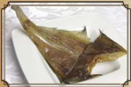
Ёрш морской ..... 250 вяленый (блюдо подается на вес) 100/10 г.