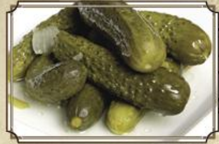
Маринованные огурчики ..... 120 150 г.