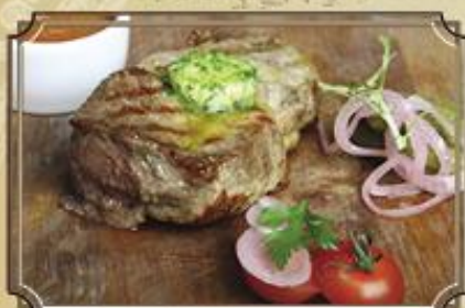
Стейк из свиной шен ..... 420 175/50/35 г.