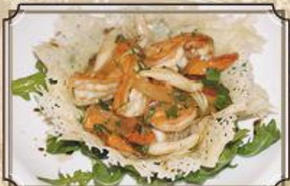
Обжаренные морепродукты с муссом из лесных грибов в сырной корзинке 220 г. 470