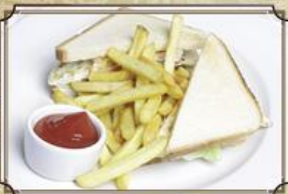
Большой клубный сэндвич 340 с жареной куриной грудкой, яйцом и беконом 220/100/50 г.