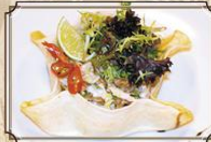
Теплый салат с куриным филе 270 и жареными грибочками в хлебной корзинке 180 г.