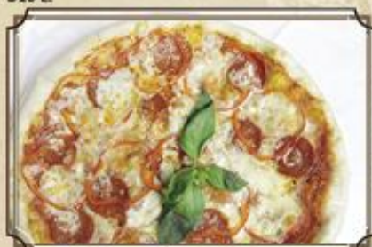
Пицца Пепперони ..... 390 Моцарелла, колбаски Пепперони 410 г.