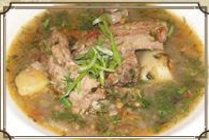
Похлебка из чечевицы ..... 320 со свиными ребрышками 400/80/50 г.