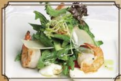
Салат из авокадо 390 с тигровыми креветками 195 г