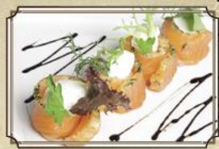
Роллы из лосося ..... 330 130/4 г.