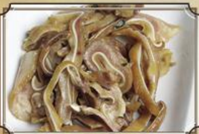
Маринованные свиные уши ..... 260 150/50 г