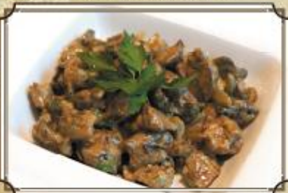
Потрошки по-ирландски ..... 440 300 г.