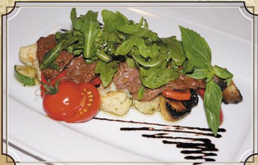
Теплый салат с говядиной 390 и соусом Песто 200 г