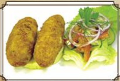
Котлета по-киевски ..... 350 150/75/75 г.