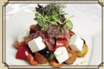
Греческий салат 250 из свежих овощей с сыром Фета и бальзамическим уксусом 285 г