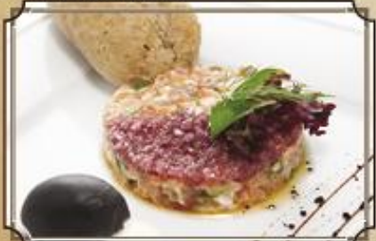
Тартар из лосося ..... 330 70/25/5/40 г.