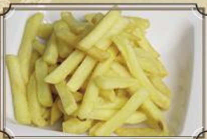
Картофель фри ..... 120 с кетчупом и сырным соусом 150/50 г