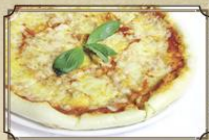
Пицца Маргарита ..... 260 томатный соус, сыр Моцарелла 340 г.