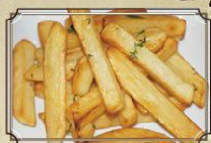
Жареная домашняя картошка 110 150 г.