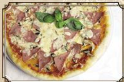
Пицца с ветчиной и грибами ..... 390 Моцарелла, шампиньоны, ветчина 410 г.