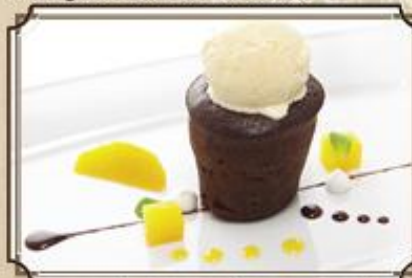
Шоколадное «МАЛЮ» ..... 250 с шариком мороженого 80/40/20 г.