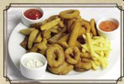
Ассорти «Фри» ..... 790 кольца кальмара, кольца лука, сырные палочки, айдахо, фри 650/150 г.