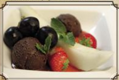
Мороженое с фруктами ..... 240 100/135/30/1 г.