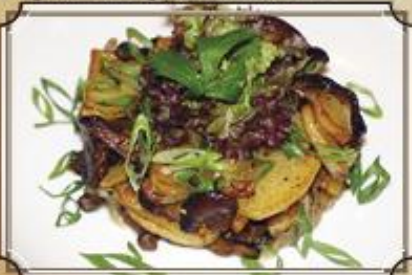
Картофель жареный 310 с лисичками и сметаной 270/50 г.