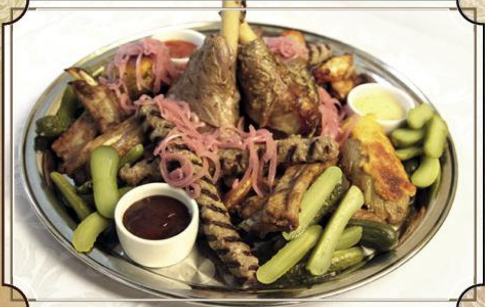
Большой мясной стол ..... 3400 ножка ягненка, куриные крылья, ребра свиные, кебаб, айдахо, запеченный картофель, овощи. На 4-6 человек. 2200 г.