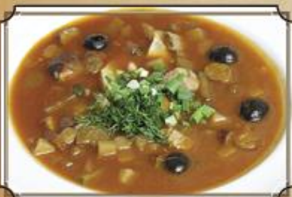
Солянка мясная ..... 320 400/50 г.