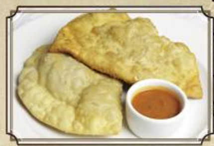
Чебуреки ..... 310 на Ваш выбор: с мясом или сыром и беконом 200/50 г.