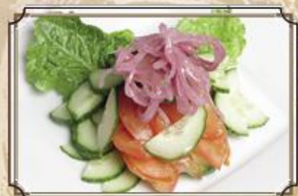
Овощной салат 120 помидоры, огурцы, зелень, маринованный лук 150 г.