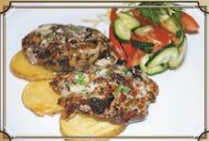
Говядина по-французски ..... 510 200/100/80/5 г.