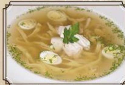
Куриный бульон ..... 240 и домашней лапшой и перепелиными яичками 400 г.