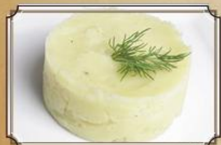
Картофельное пюре 110 150 г.