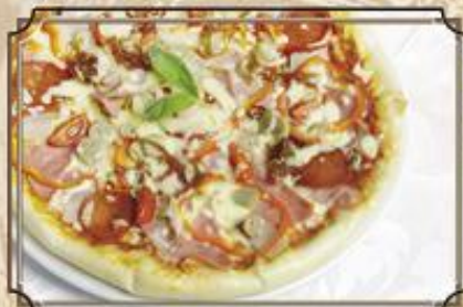
Пицца Soldi ..... 520 Моцарелла, бекон, ветчина, паприка, шампиньоны, черри, пепперони, лук 580 г.