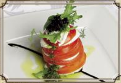
Сыр Моцарелла и помидоры 320 200/20/4 г