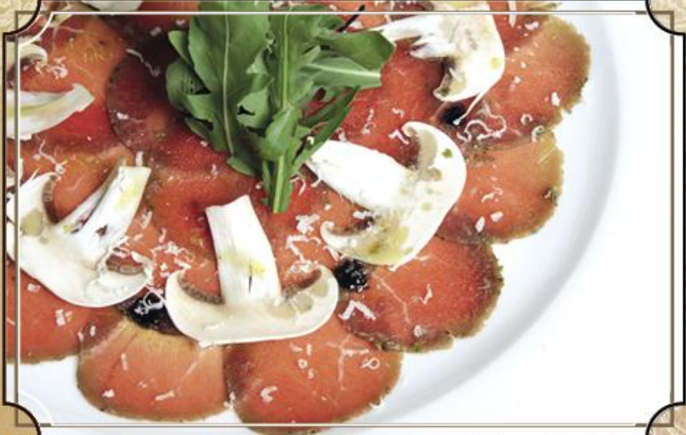
Карпаччо из говядины ..... 330 75/55 г.