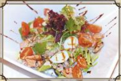
Теплый салат с морепродуктами 390 запеченными грибами и фирменным соусом 200 г.