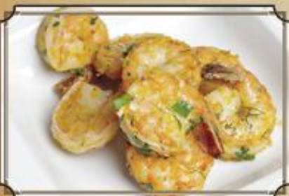
Тигровые креветки ..... 390 жареные с чесноком и зеленью 120/50 г.