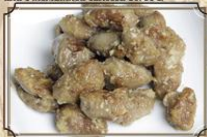
Жареные сердечки цыплят ..... 250 120/50 г