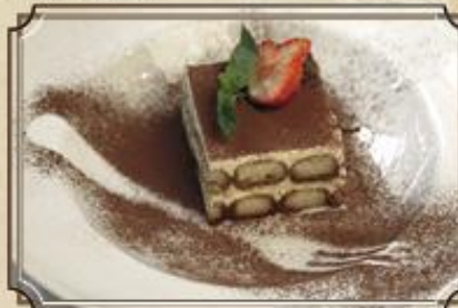
Тирамису ..... 290 Итальянский десерт из сыра Маскарпоне и сахарных палочек 120/25/1 г.