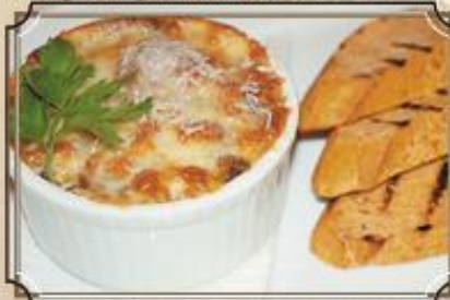
Куриный жульен 280 с грибами в сливочном соусе с сыром 180/40 г.