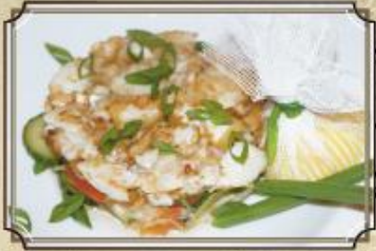
Теплый салат с тунуской и свежими овощами 250/50/2 г. 320