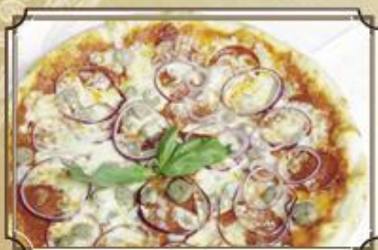
Пицца с колбасой ..... 480 Моцарелла, колбаса Черизо, баварские сосиски, пепперони, красный лук 440 г.