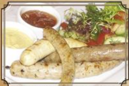
Ассорти из колбасок стандартное ..... 460 с салатом из свежих овощей 70/65/70/20/60 г.