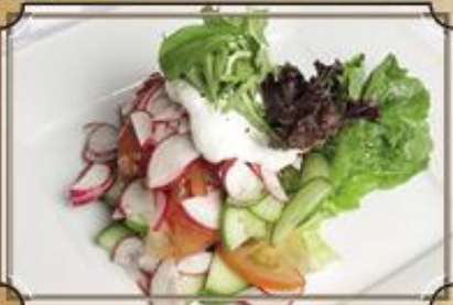
Салат из свежих овощей 190 на Ваш выбор со сметаной 280 г./ с маслом 260 г.