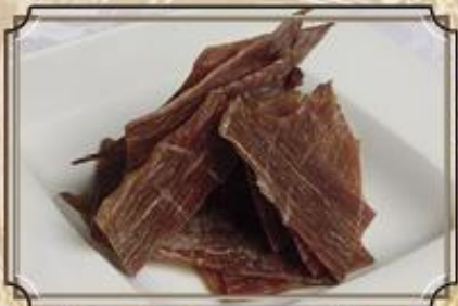
Мясные чипсы ..... 290 из говядины или свинины 50 г.