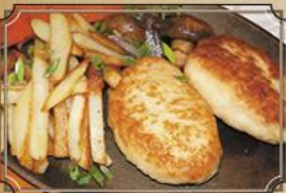
Куриные котлеты 360 с жареным картофелем и соусом из томатов. 200/150/100/50 г.