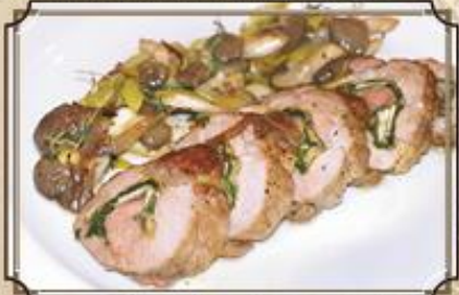
Рулет из свинины с ароматными травами в лимонной цедре с чесноком и вешенками 190/120/2 г. 540