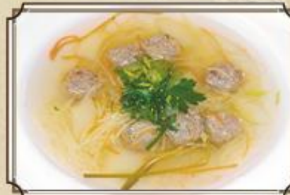
Суп с фрикадельками ..... 240 и лапшой 410 г.