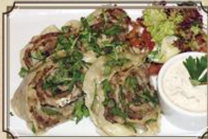
Рулеты из баранины 420 на тонком тесте с овощами и острым соусом 250/130/50 г.