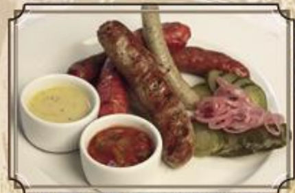
Ассорти из колбасок стандартное ..... 640 310/80/100 г.