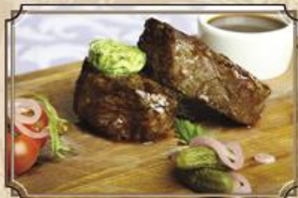
Медальоны из говядины ..... 720 150/50/35 г.