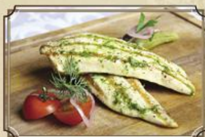
Филе цыпленка ..... 320 130/35/15 г.