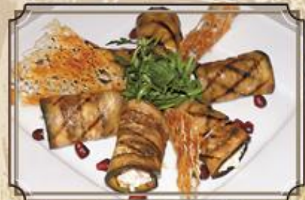
Баклажанные рулетики ..... 240 со сливочным сыром, травами и пармезаном 180/10/15 г.