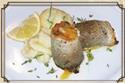
Рулетики из форели с овощами в соусе Морне и нежным картофельным пюре 150/120/50 г. 500