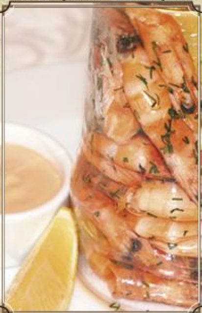
Отварные тигровые креветки ..... 420 с канадским соусом 300/50 г.