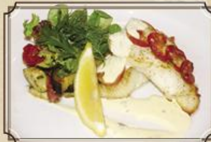
Запеченное филе палтуса ..... 560 с сыром и соусом Дор Блю 200/150/50 г.