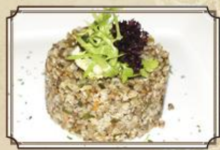
Греча домашней рецептуры 100 80 г.