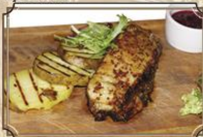
Грудинка свиная печеная 510 с брусничным соусом 250/90/20/40 г.