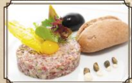
Тартар из говядины ..... 330 110/50/2/40 г.