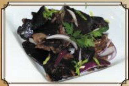
Грузди черные ..... 290 соленые бочковые 150/40 г.