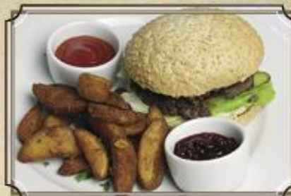
Шиллинг бургер с Айдахо ..... 470 260/100/60 г.