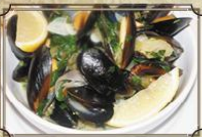
Дюжина голубых мидий ..... 500 в ассортименте: в диве, в белом вине, в сливочном соусе, собственном соку 300 г.