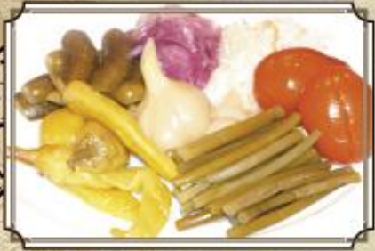
Соленья ..... 250 огурчики, чесночок, черемша, помидорки, капуста, лучок маринованный 400 г.