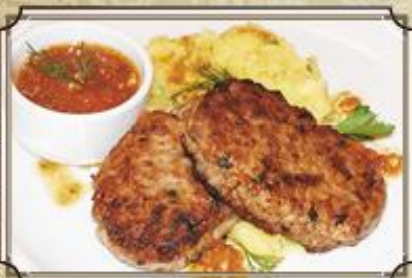
Домашние котлеты ..... 420 с картофельным пюре и соусом из свежих помидоров 200/150/50 г.