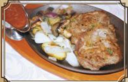
Свинные отбивные на сковороде с обжаренными овощами 175/160/50/2 г. 520