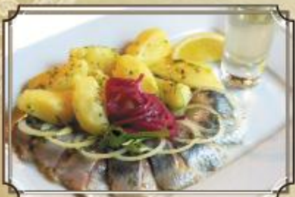
Сельдь канительная ..... 230 слабой соли с рыжикой хреноухи на меде 120/120/50 г.