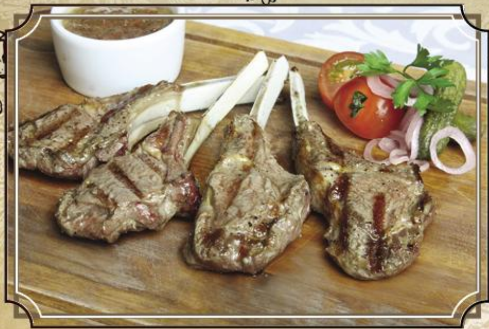
Котлетки агненка на косточке ..... 1100 Новая Зеландия 200/50/15 г.