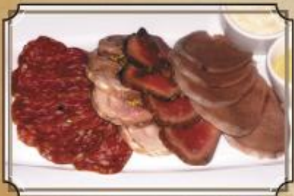
Мясная тарелка ..... 520 из бурженины, ростбифа, лэyka и копченой колбасы с горчицей и хреном 240/60 г.