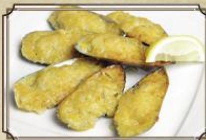
Гигантские мидии ..... 390 запеченные с сыром Пармезан 200 г.