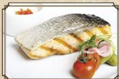
Стейк из лосося ..... 580 150/50/35 г.