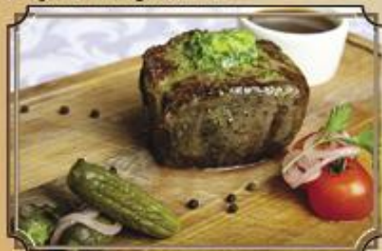
Стейк из говядины ..... 720 на ваш выбор: перечный, классический или минутный 150/50/35 г.