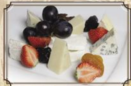
Сырная тарелка ..... 420 мягкие и твердые сыры с виноградом, сухофруктами и клубникой 120/150 г.