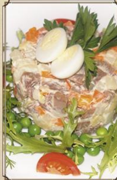
Салат Оливье 290 210 г.