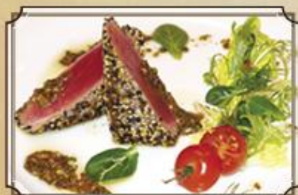
Стейк из тунца ..... 490 с обжаренным кунжутом и соусом Винегрет 200 г.