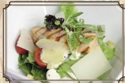
Салат Цезарь из свежих листьев с фирменным соусом 320 и перепелными яйцами 240 г с курицей или тигр. креветками 240 г 390 с лососем 240 г