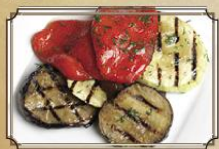
Овощи гриль 210 150 г.