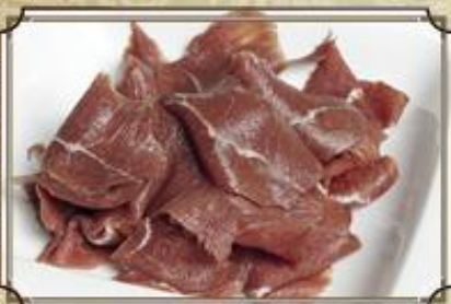
Оленина сырокопченая ..... 340 80 г