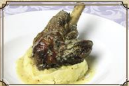
Ножка ягненка 650 с картофельным пюре и горчичным соусом 300/150/30 г.