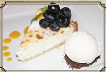
Фирменный чизкейк ..... 290 с шариком мороженого и соусом манго 130/40/40/30/2 г.