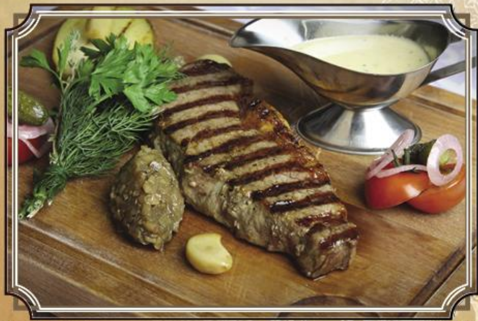
Нью-Йорк Стейк ..... 1290 замоченый в красном вине и обжареный на гриле 200/180 г.