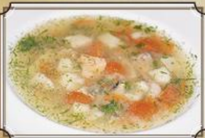
Уха ..... 290 из лосося, палтуса и карпа 400 г.