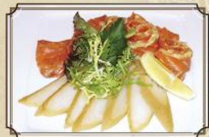
Рыбная тарелка ..... 390 лосось х/к, лосось слабой соли, палтус х/к 225 г.