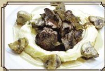
Куриная печень 340 с картофельным пюре 110/100/50/20 г.