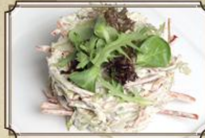
Салат из копченой свинины 340 с ростбифом, маринованным огурчиком и сладким перцем 280 г.