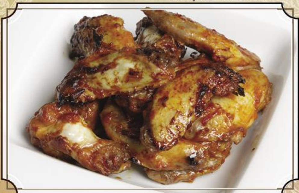
Куриные крылья ..... 350 300/50 г.