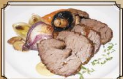
Ростбиф из нежной говядины в специях с обжаренными овощами и хреном 150/140/30/2 г. 720