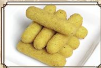
Сырные палочки ..... 300 в хрустящей панировке, с брусничным соусом 180/50 г.