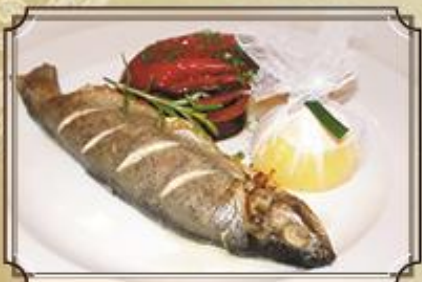
Запеченная форель фаршированная креветками и грибами в сливочном соусе 250/100/40 г. 590