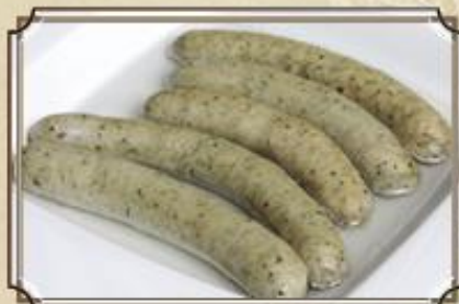
Баварские сосиски ..... 310 с горчицей 140/30 г