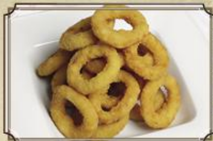
Кольца лука в пивном кляре ..... 210 200/50 г