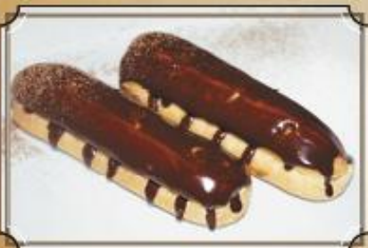
Эклер (1 штука) ..... 65 с французским заварным кремом и шоколадной глазурью 60 г.