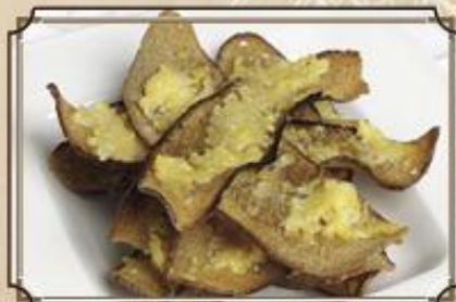
Сухарики ..... 170 на Ваш выбор: с сыром Пармезан 110 г или с томатной сальсой 80/50 г