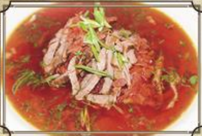
Борщ со сметаной ..... 320 и картофельными клецками 400/80/50 г.