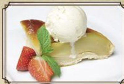
Тарте Татин ..... 190 грушевый пирог с шариком мороженого 120/50/20/1 г.