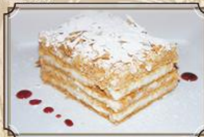
Фирменный торт «Наполеон» ..... 230 140 г.