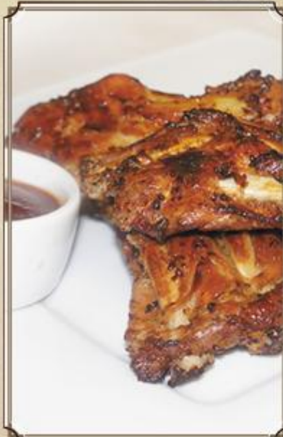
Запеченные свиные ребра ..... 560 в специях и соусом Барбекю 300/50 г.