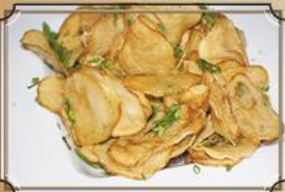
Чипсы картофельные ..... 190 на Ваш выбор: с сыром, беконом и зеленью 150 г