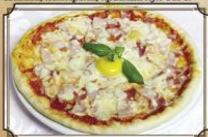
Пицца Карбонара ..... 390 Моцарелла, бекон, желток 460 г.