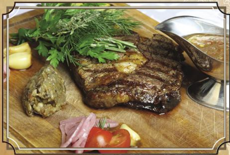
Рибай Стейк ..... 1290 200/180 г