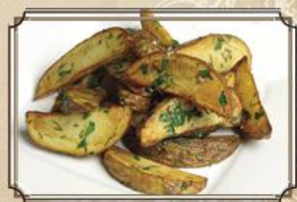
Картофель по-деревенски 110 150/50 г.