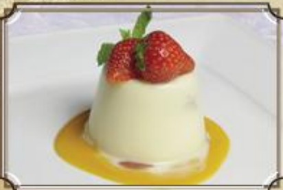
Панна Котта ..... 190 Желе из сливок с ягодами и ароматом апельсиновой цедры 110/25/20/1 г.