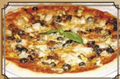
Пицца с морепродуктами ..... 560 450 г.