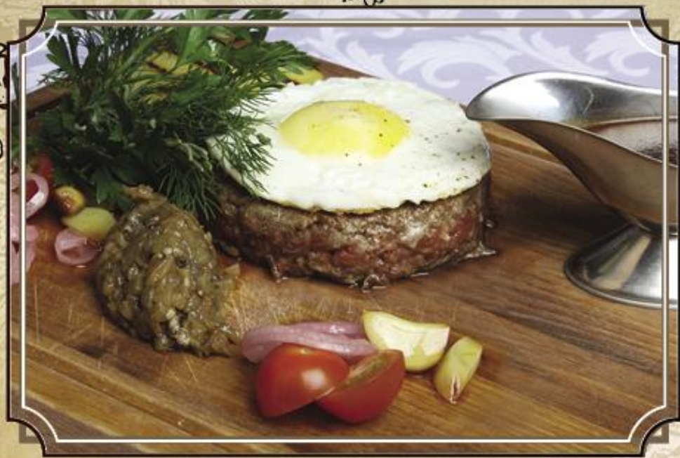
Рубленый бифштекс с яйцом ..... 790 приготовленный из мраморной вырезки 125/180/40 г