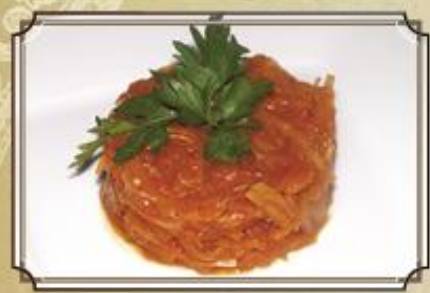
Тушеная капуста 90 150 г.