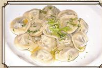
Пельмени самолепные ..... 330 тройные 250/40 г.