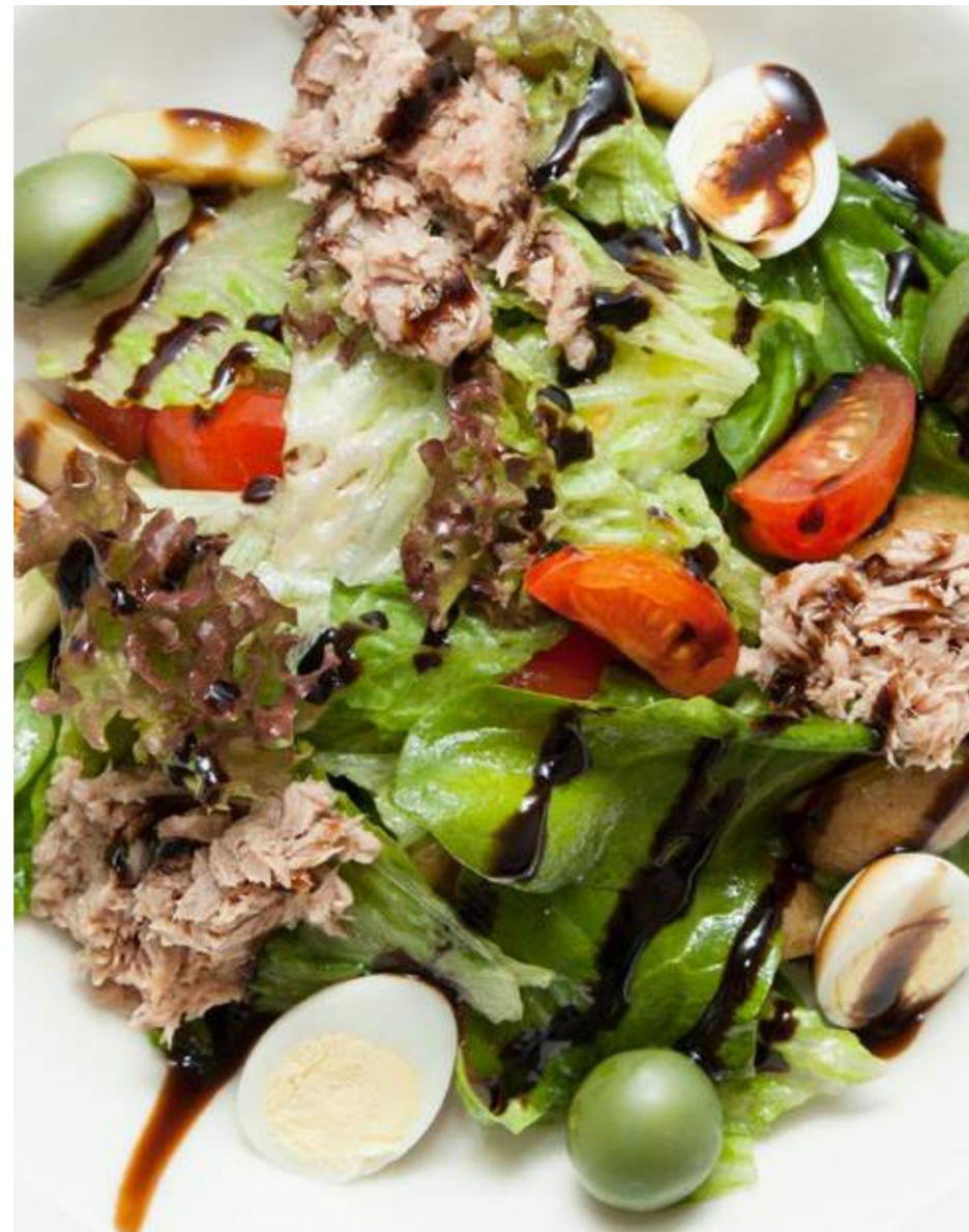
Салат с тунцом, оливками и картофелем