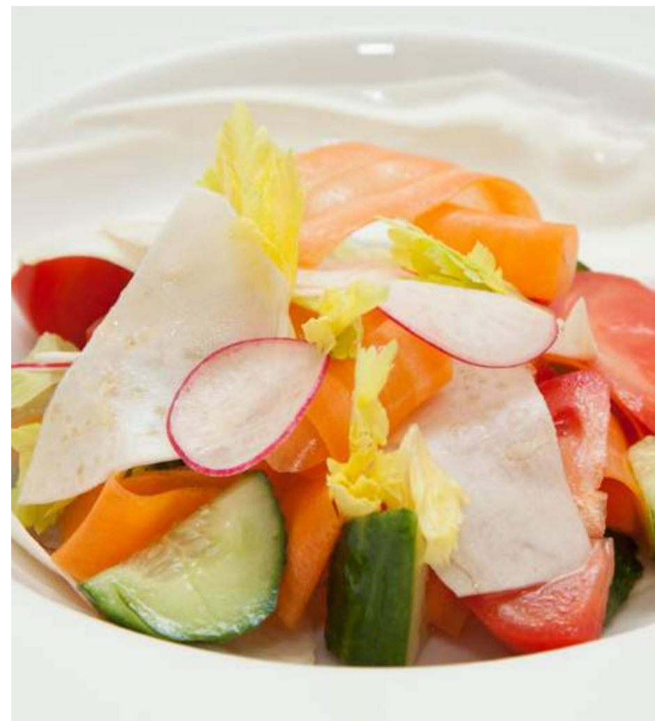
Овощной салат со сметаной