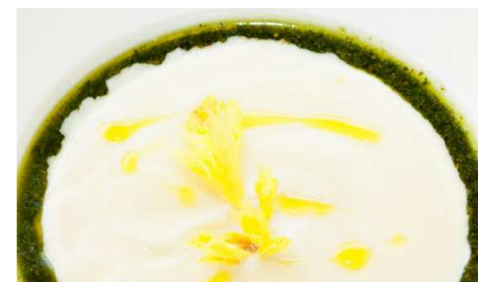
Крем-суп из корня сельдерея