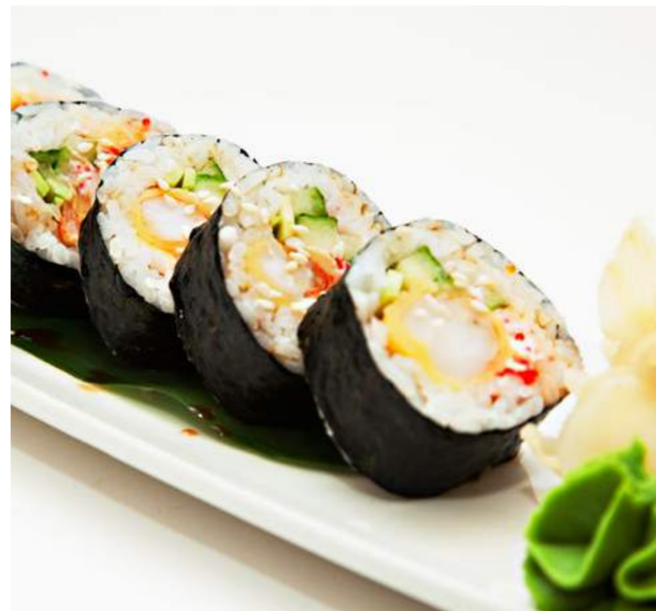
Ролл с креветкой темпура