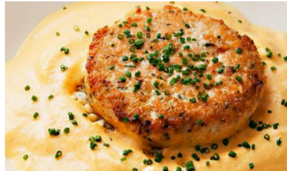
Котлеты из лосося с гарниром из кус-куса