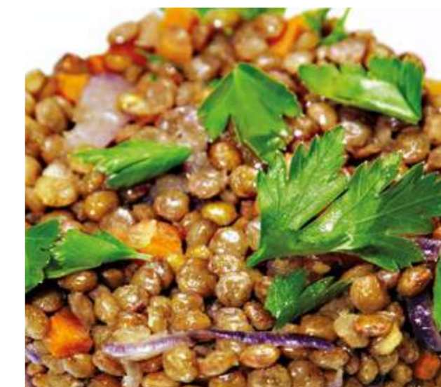
Чечевица с красным луком