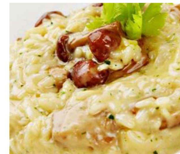
Ризотто с белыми грибами