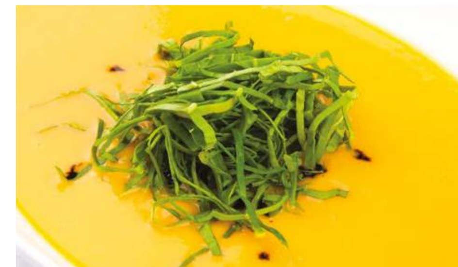
Тыквенный суп со шпинатом