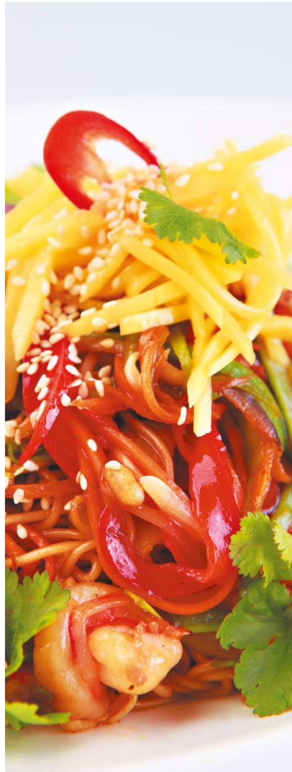
Вок с креветками и манго