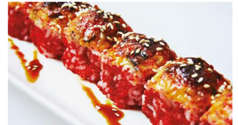
Запеченный ролл с креветкой, угрем и сыром Филадельфия