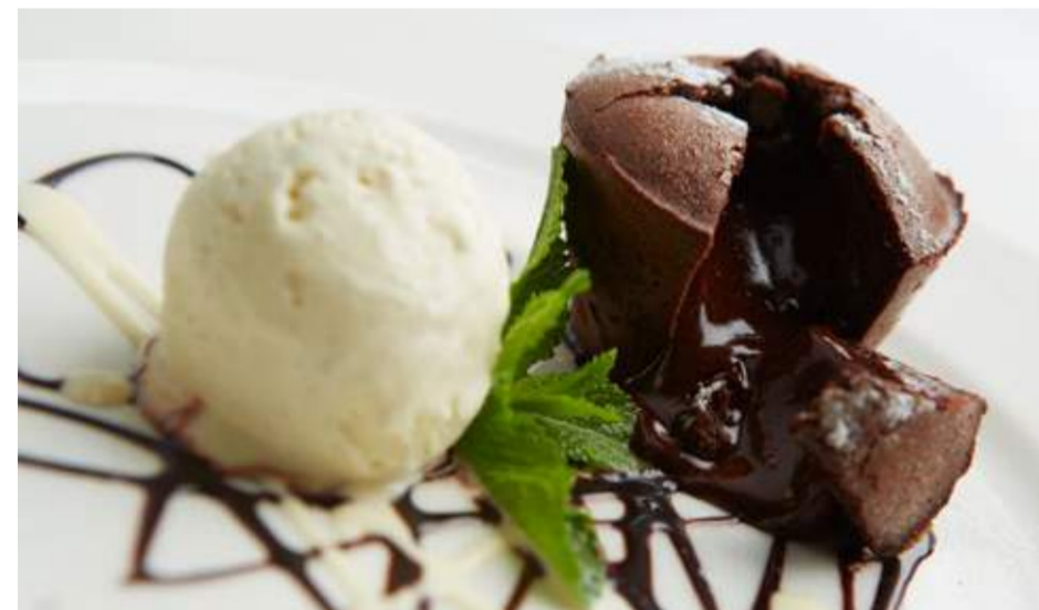
Шоколадный кекс 350 р.