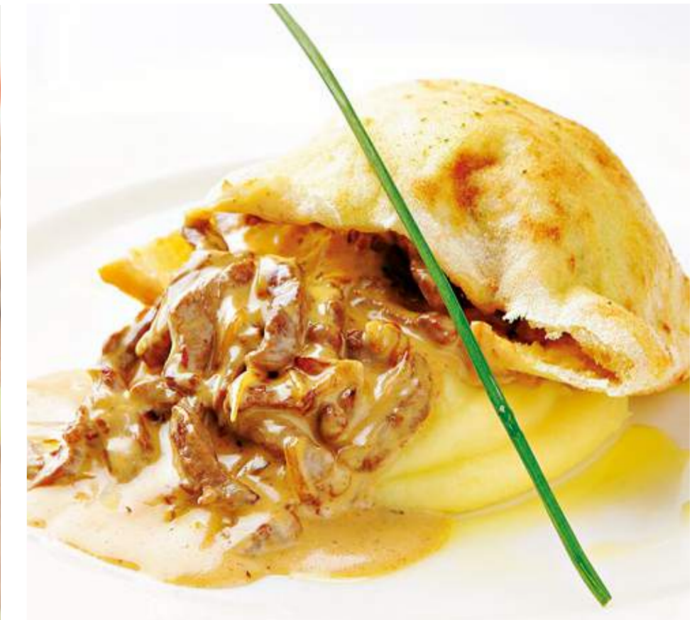
Бефстроганов с пюре