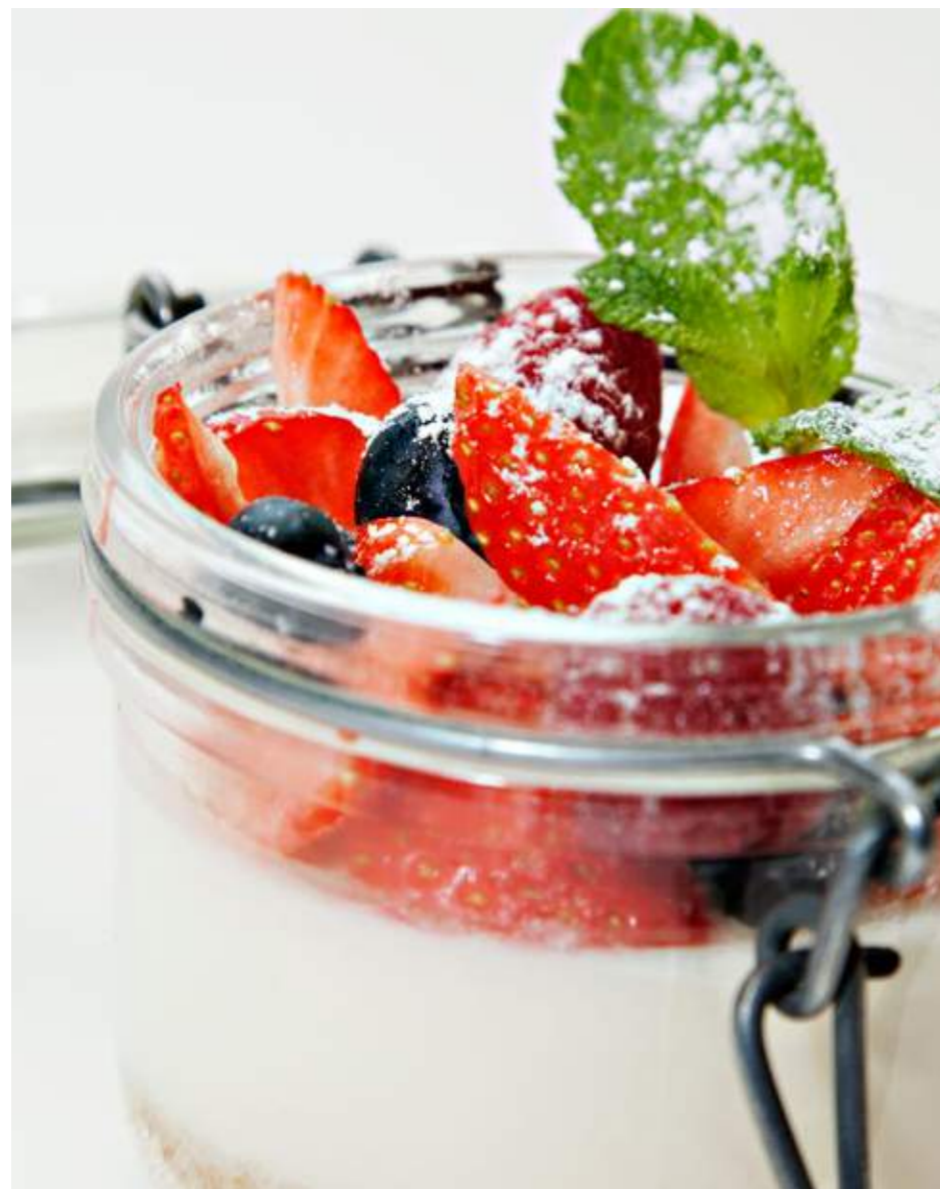
Баночка «ПаннаКота» с лесными ягодами