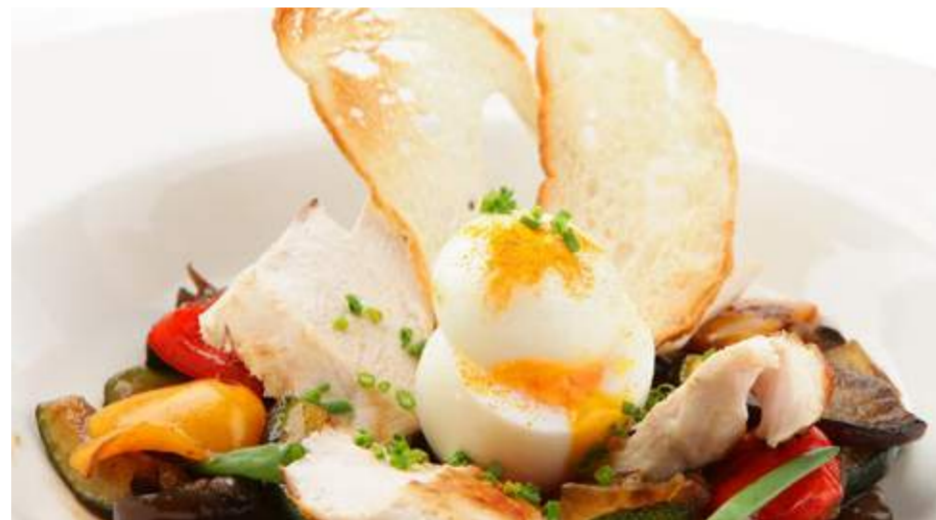
Теплый салат с фермерским яйцом и куриным филе