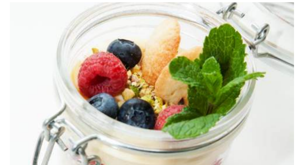
Крема Шантили ди Боско