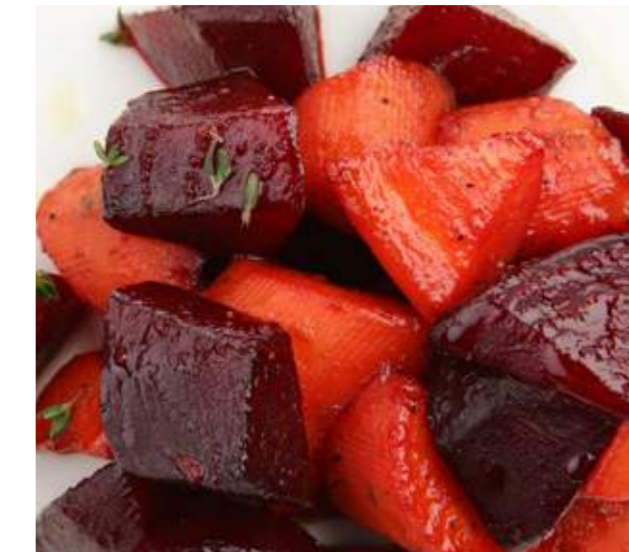
Свекла и морковь