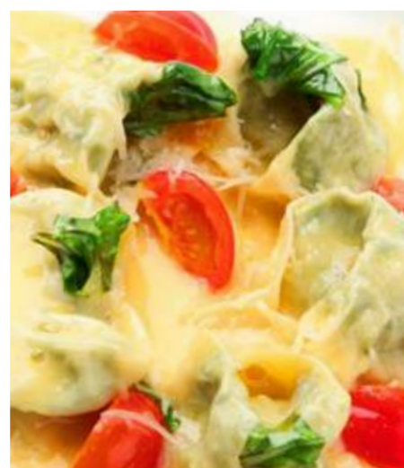
Тортилони с рикоттой и шпинатом