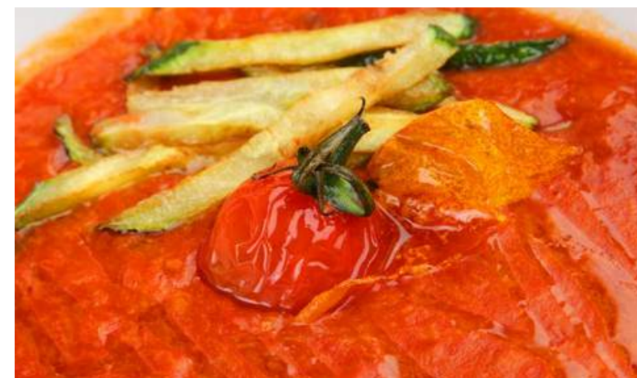
Паппа аль помodoro