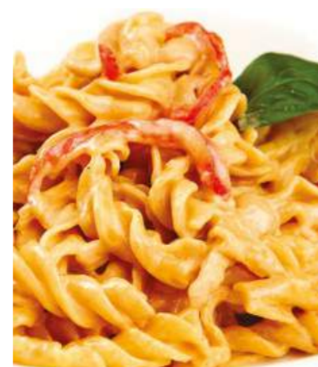
Фузилли с куриным филе и паприкой