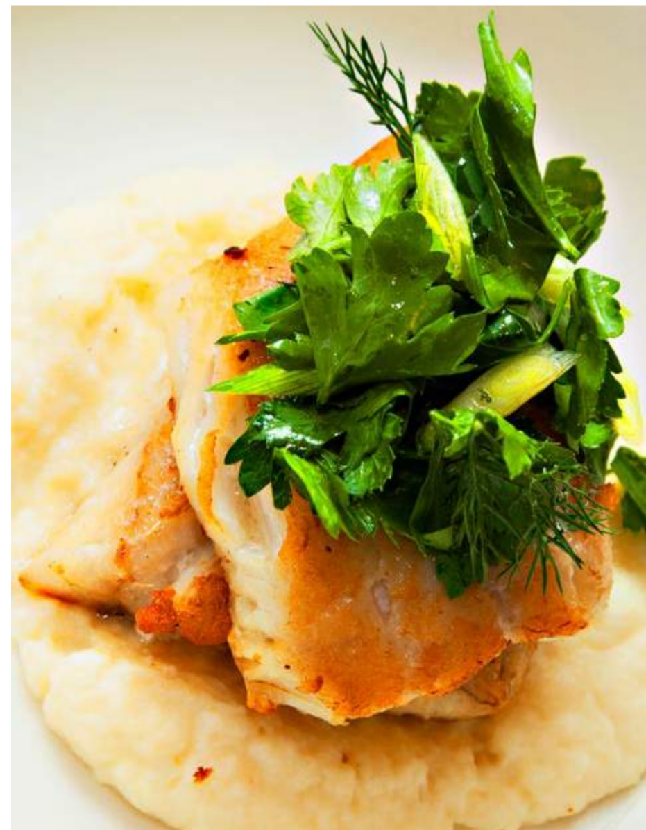
Судак на креме из корня сельдерея