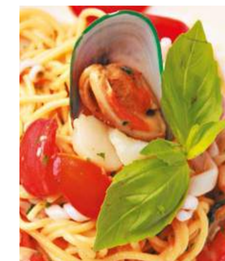
Спагетти с морепродуктами