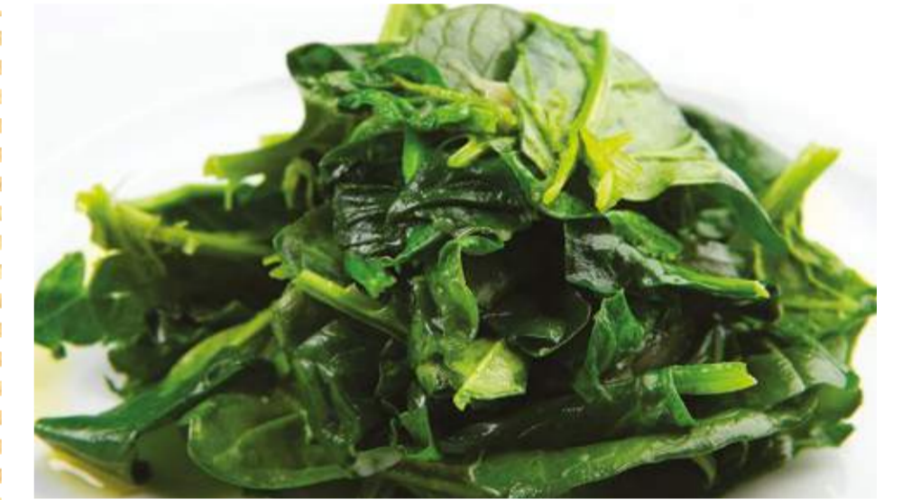
Шпинат с пармезаном