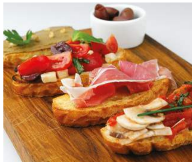
Брускетты на выбор