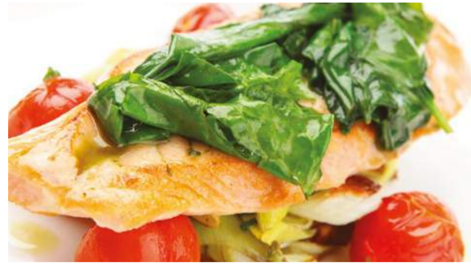
Норвежский лосось на помидорини со шпинатом