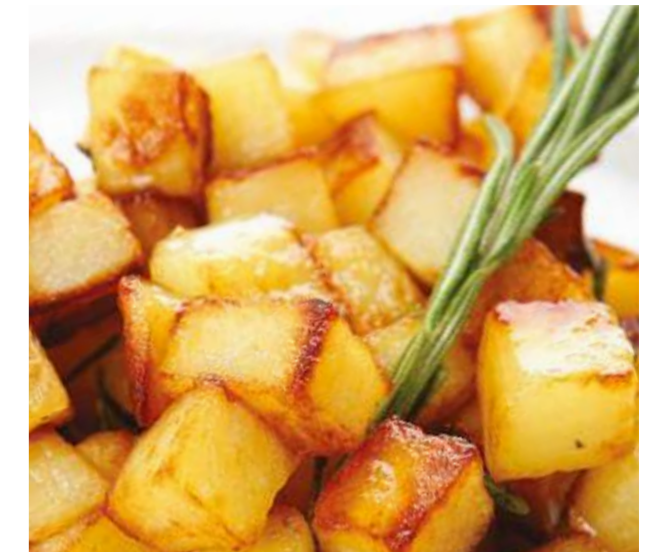
Картофель с розмарином