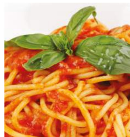
Спагетти со свежими томатами и базиликом