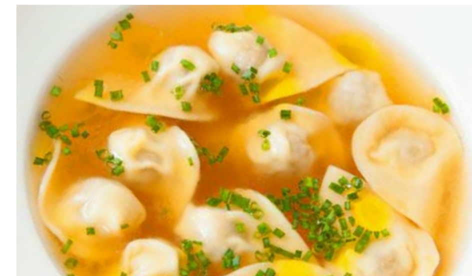
Тортеллини в бульоне