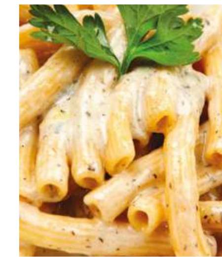
Маккерони 4 сыра с черным трюфелем