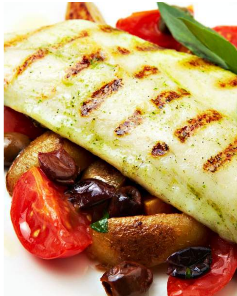
Бранзино с помидорини, оливками и картофелем