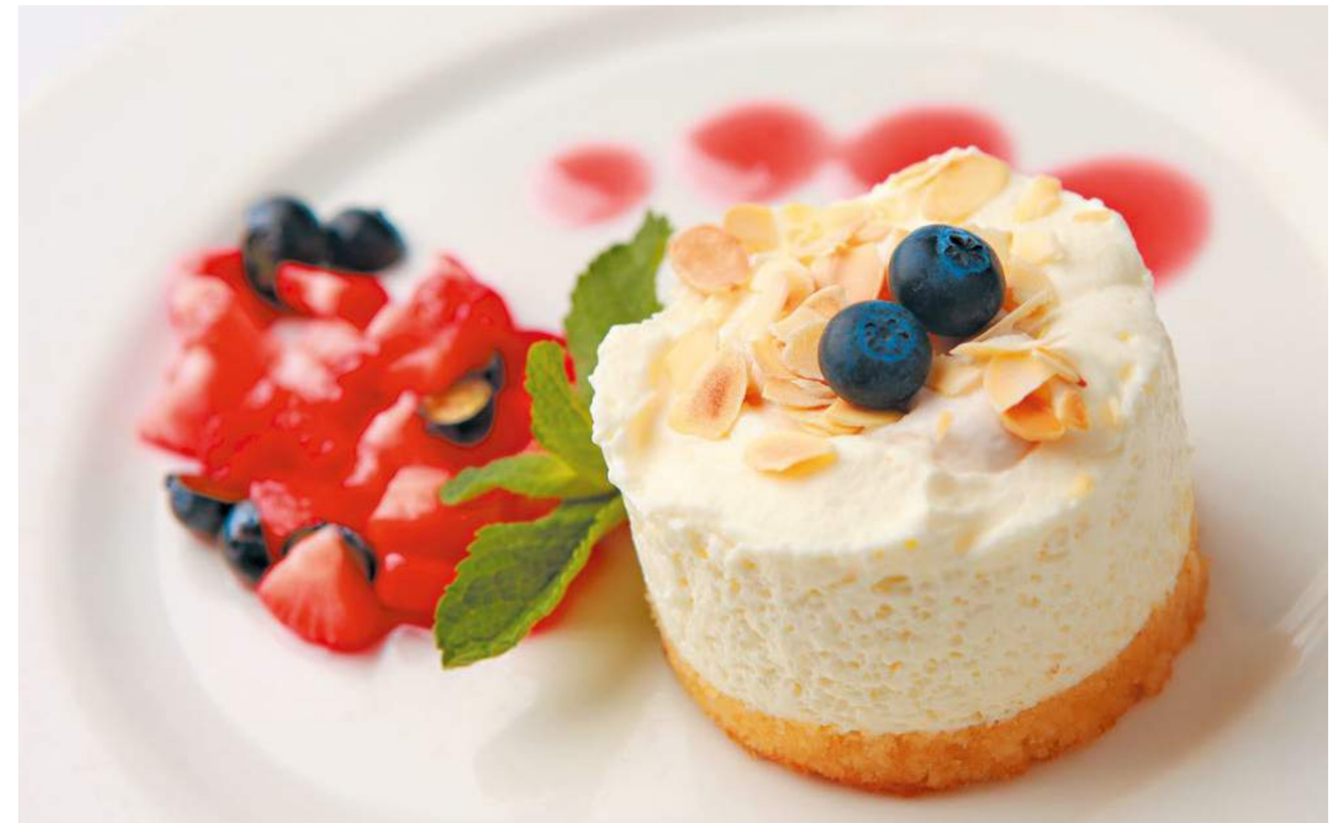
Домашний чизкейк с клубникой и голубикой