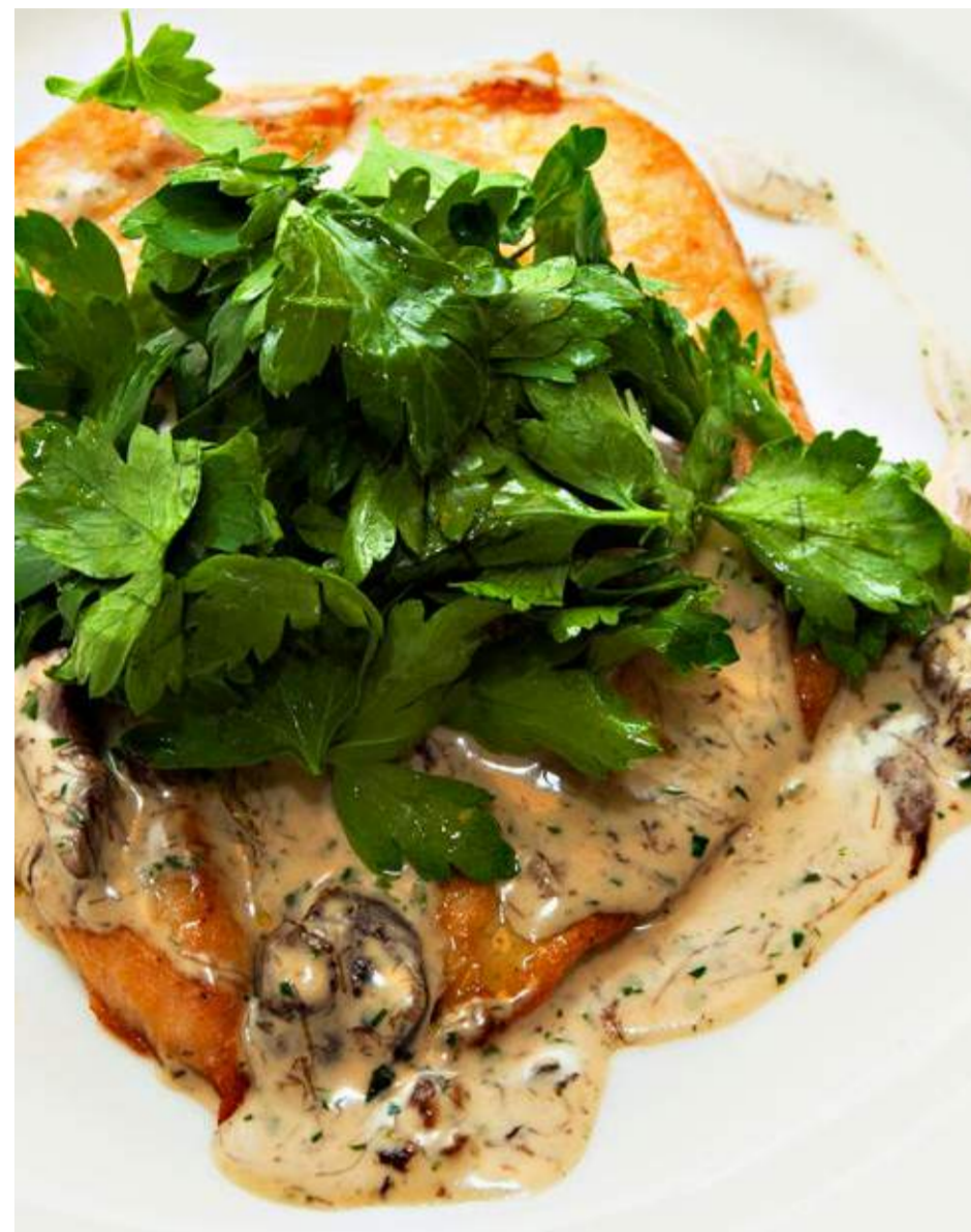
Куриная грудка с соусом из лесных грибов