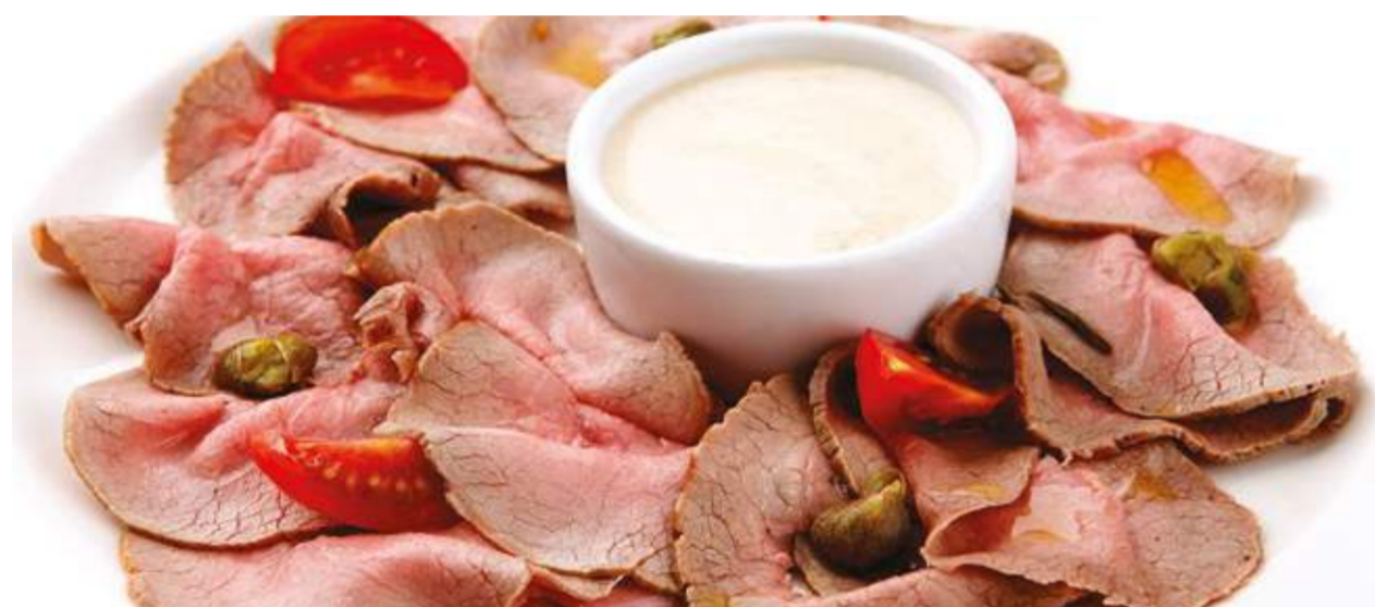
Телятина под соусом из тунца