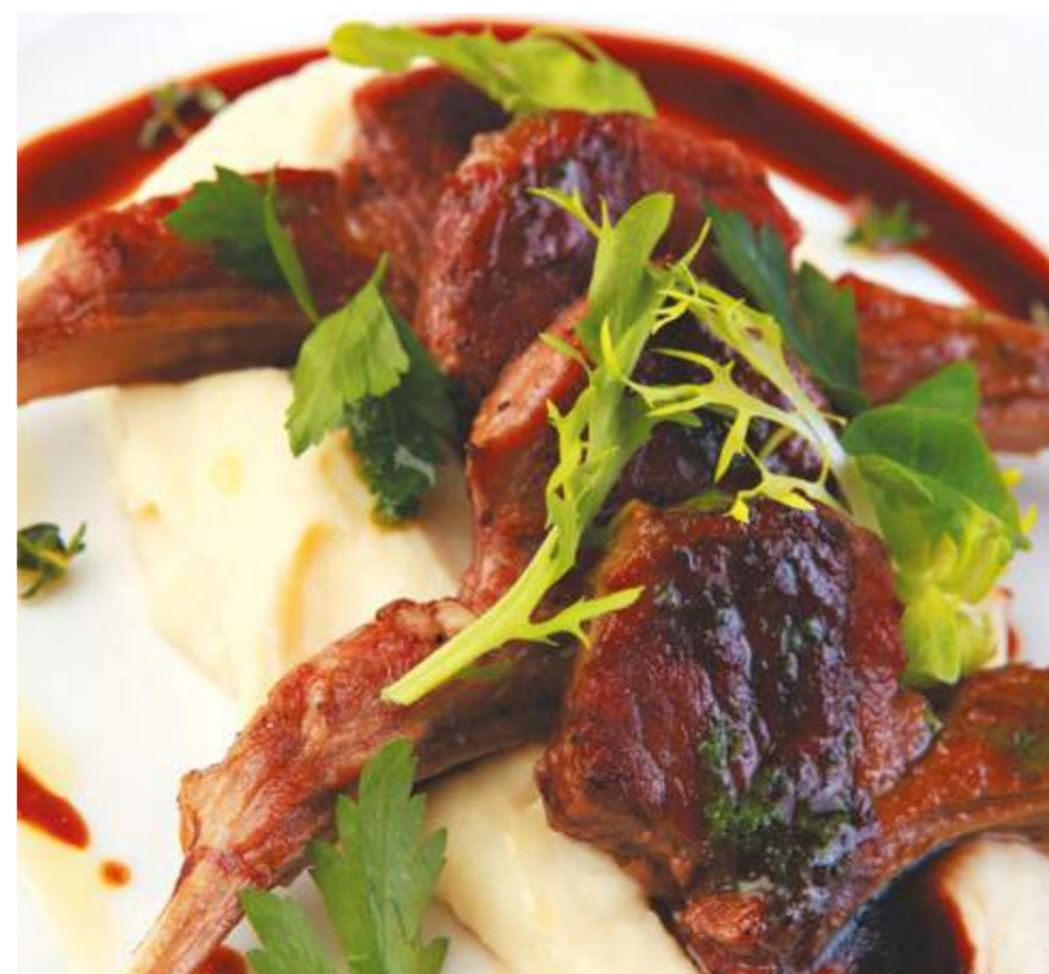
Ребра ягненка на креме из корня сельдерея