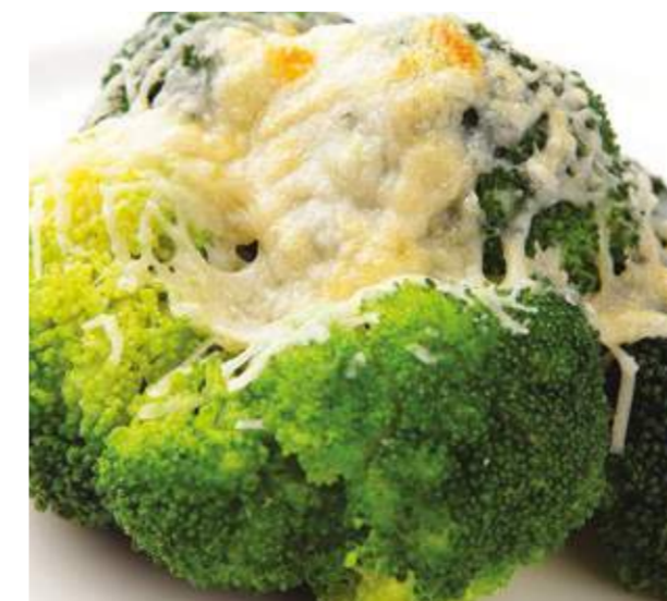
Брокколи с пармезаном