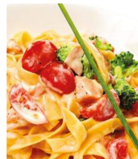
Тортилони с лососем и брокколи