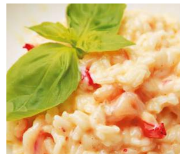
Ризотто с креветками и сыром Таледжио