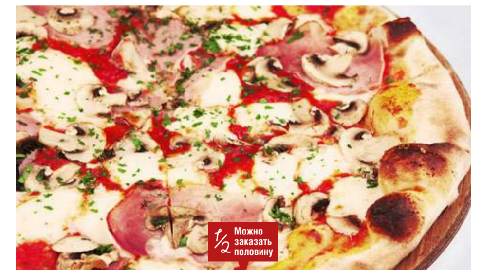
С белыми грибами и баклажанами