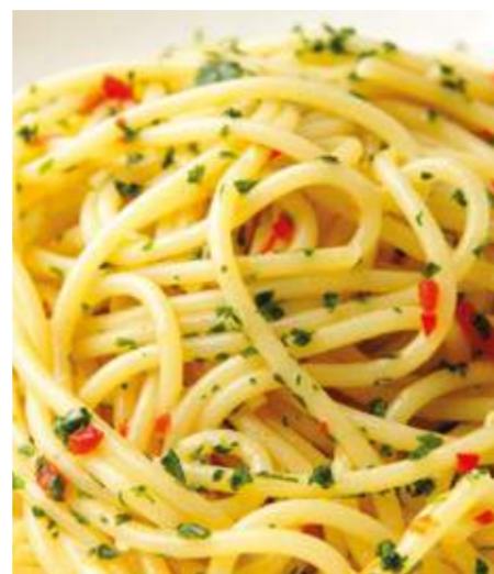
Спагетти алио, олио, пеперончино