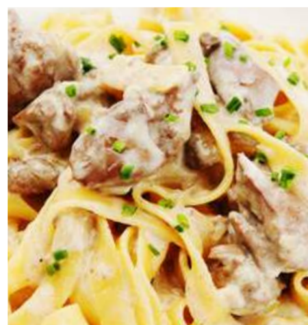
Тортилони с куриной печенью в сливочном соусе