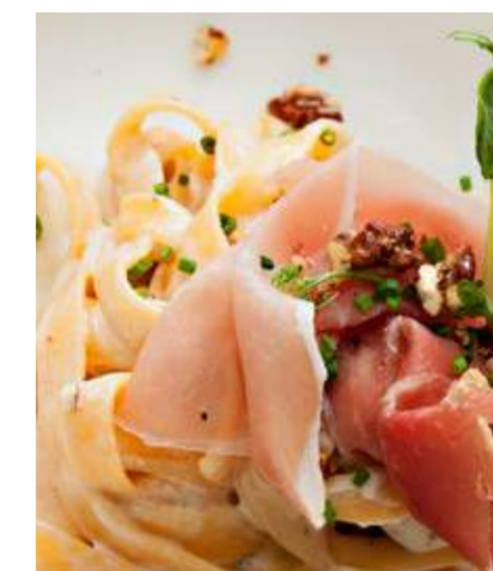
Тортилони с горгонзоллой и пармской ветчиной