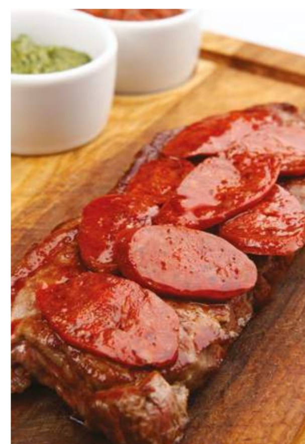
Стриплойн стейк с Чоризо