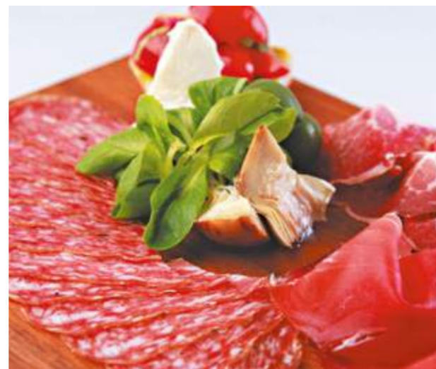
Антипасто из мясных деликатесов