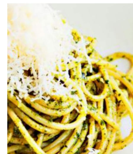
Тортилони с соусом песто