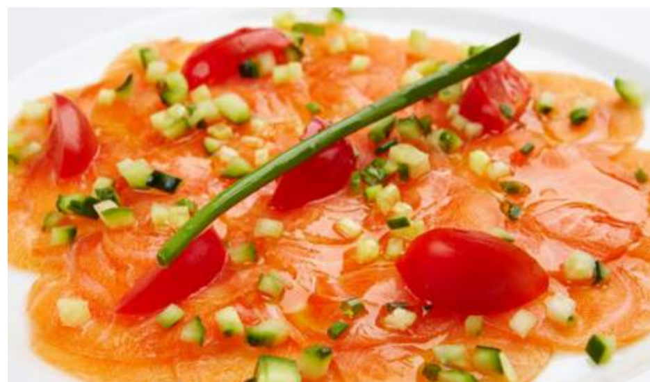
Карпаччо из лосося