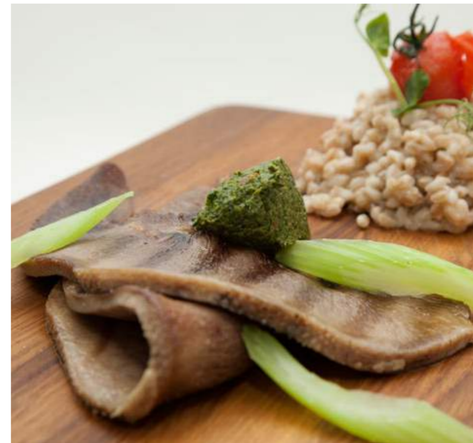
Говяжий язык с гарниром из полбы