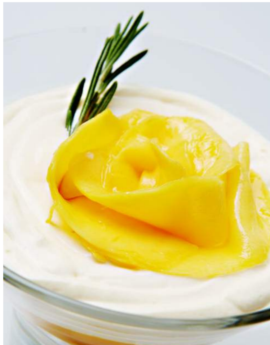
Крем Маскарпоне с манго