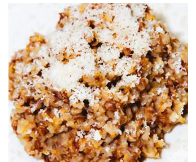
Греча с пармезаном