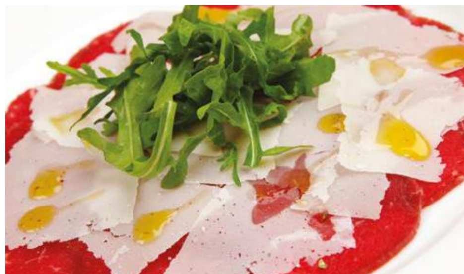
Карпаччо из говядины