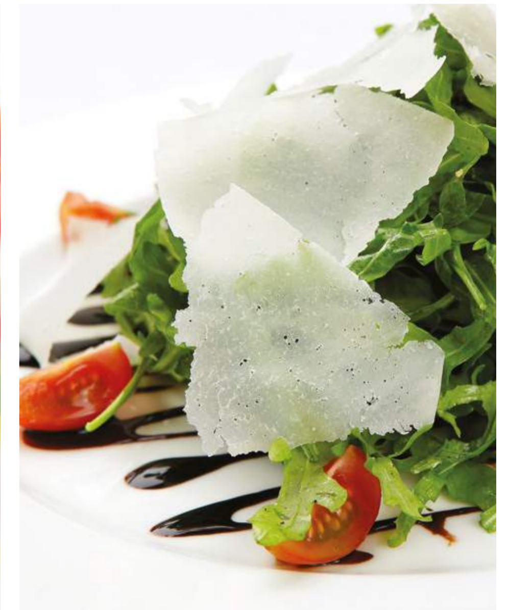
Рукола с пармезаном и черри.