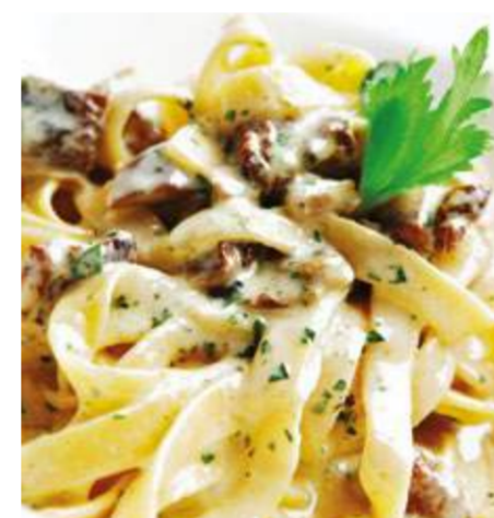
Тортилони с белыми грибами в сливочном соусе