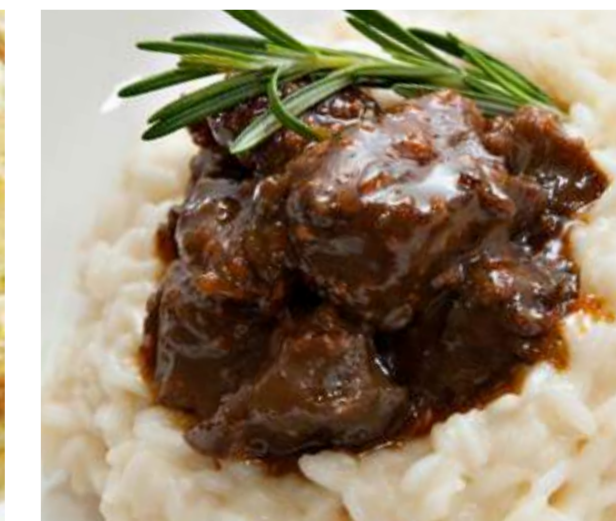
Ризотто с телячьими щечками