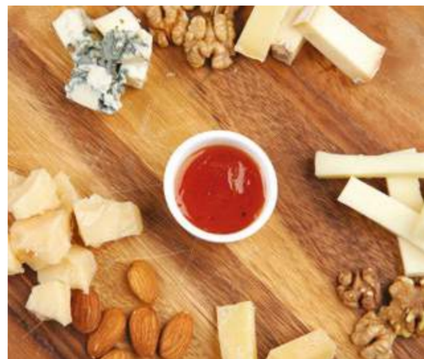
Тарелка с фермерскими сырами и медом