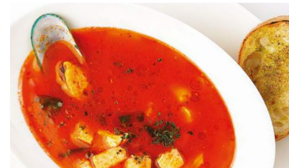
Суп с морепродуктами