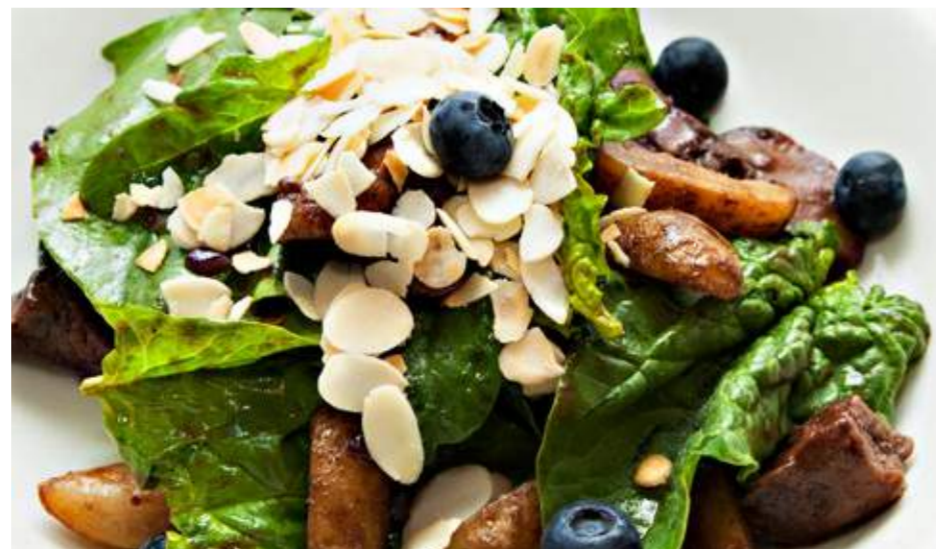
Салат с куриной печенью и шпинатом