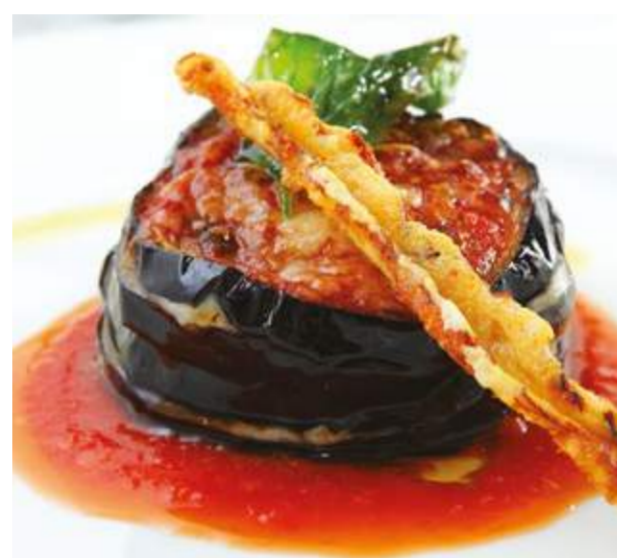
Баклажаны алла Пармиджана