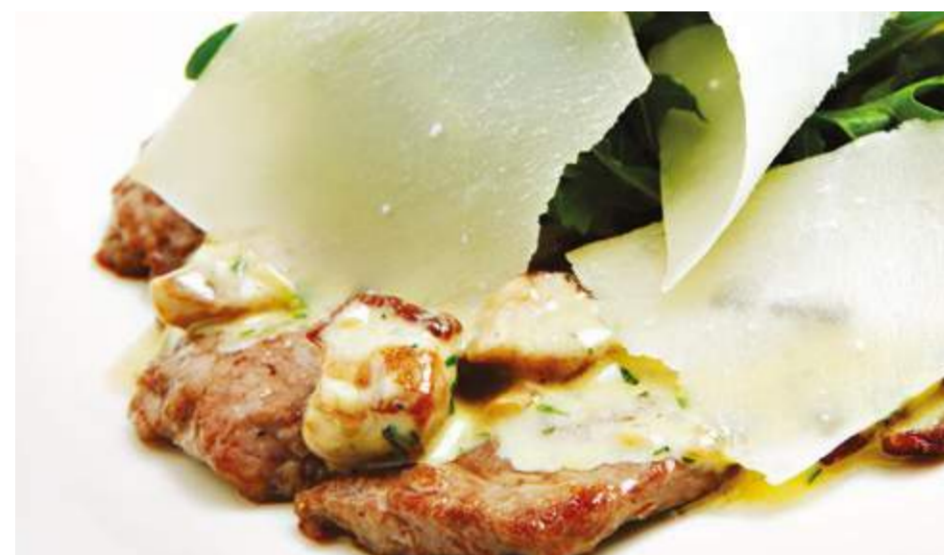
Тонкий стейк из телятины с белыми грибами