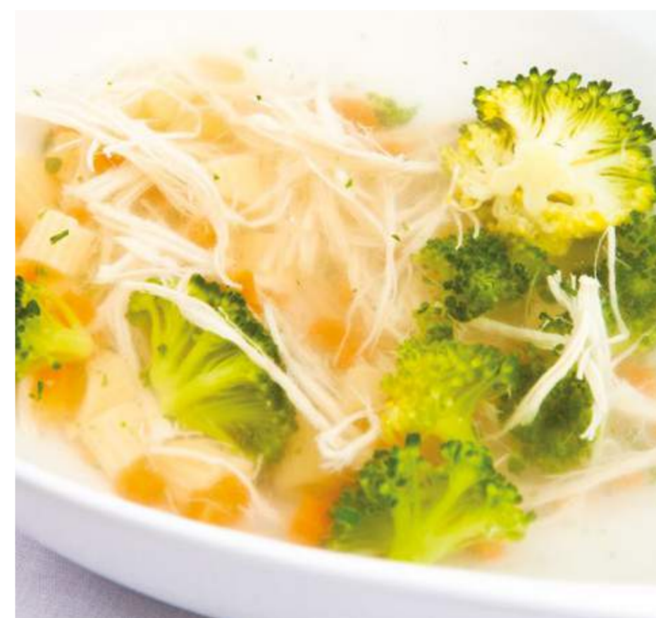
Куриный суп с овощами и домашней пастой