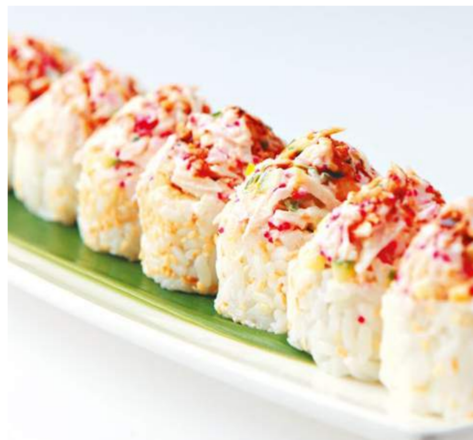
Ролл с крабом, лососем и сыром Филадельфия