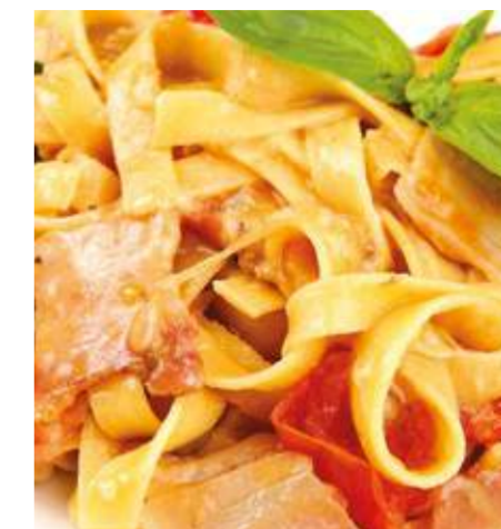
Тортилони с лесными грибами и панчеттой