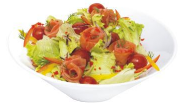
Сяке кунсей сарада

салат из копченого лосося, свежих овощей с томатами черри и зеленью