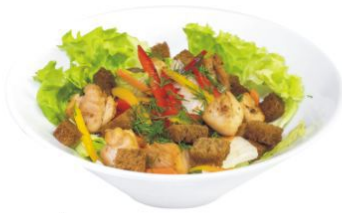
Тори ясай сарада

салат из куриного филе, свежих овощей с пикантными сухариками и соусом скияки