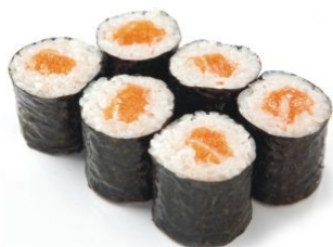
Саке кунсей хосомаки