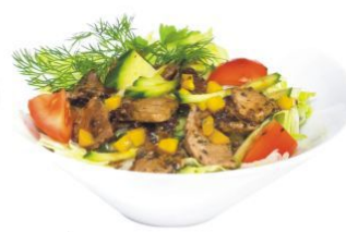
Тю яку сарада

салат из филе говядины, свежих овощей с зеленью и соусом терияки