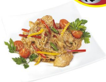
Кайсен яки удон

японская лапша с морепродуктами и овощами под устричным соусом