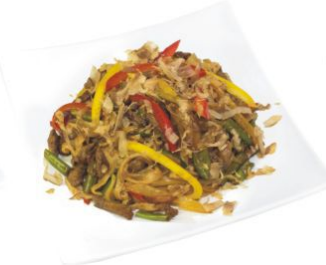
Гью яки удон

японская лапша с говядиной под соусом яки удон со стружкой тунца