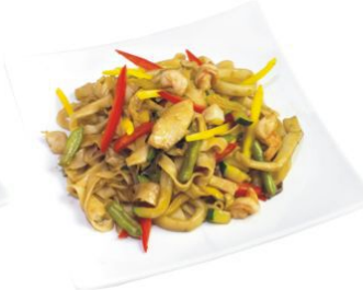
Тори яки соба

филе курицы, жаренное с овощами, шампиньонами и гречневой лапшой в соусе терияки