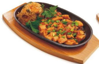
рис с лососем, кальмарами, тигровой креветкой, морским гребешком, овощами, яйцом и зеленым луком