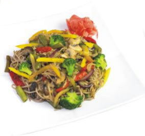
Асай яки соба