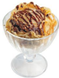
Мороженое в темпуре