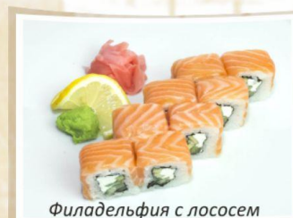
Филадельфия с лососем