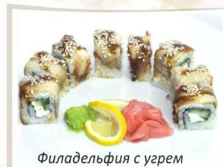
Филадельфия с угрем