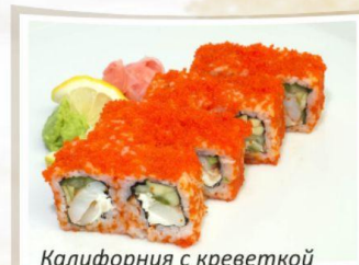
Калифорния с креветкой

Ролл «Цезарь» 250 гр..... 170,- (куриное филе, рис, сыр «Пармезан», помидор, салат «Айсберг», соус «Цезарь»)