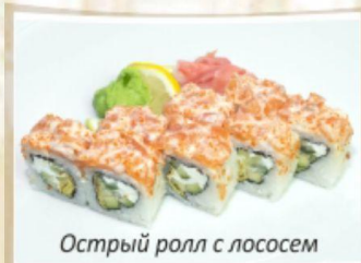
Острый ролл с лососем