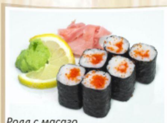
Ролл с масаго