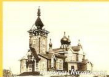
Церковь Духа Святого