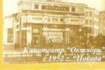
Кинотеатр "Октябрь" с 1952 г. "Победа"