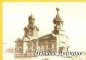
Церковь Духа Святого