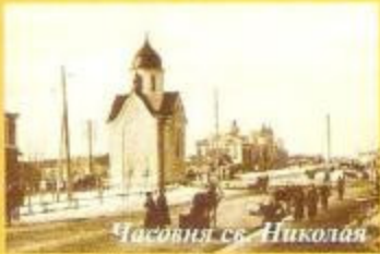
Часовня св. Николая