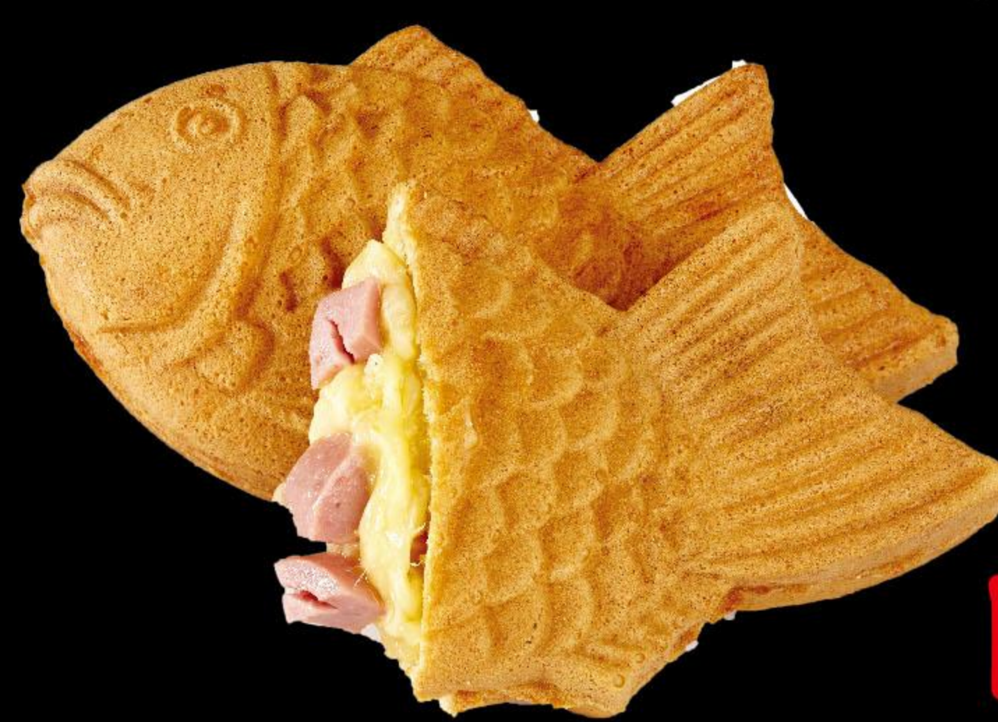
Сыр с ветчиной