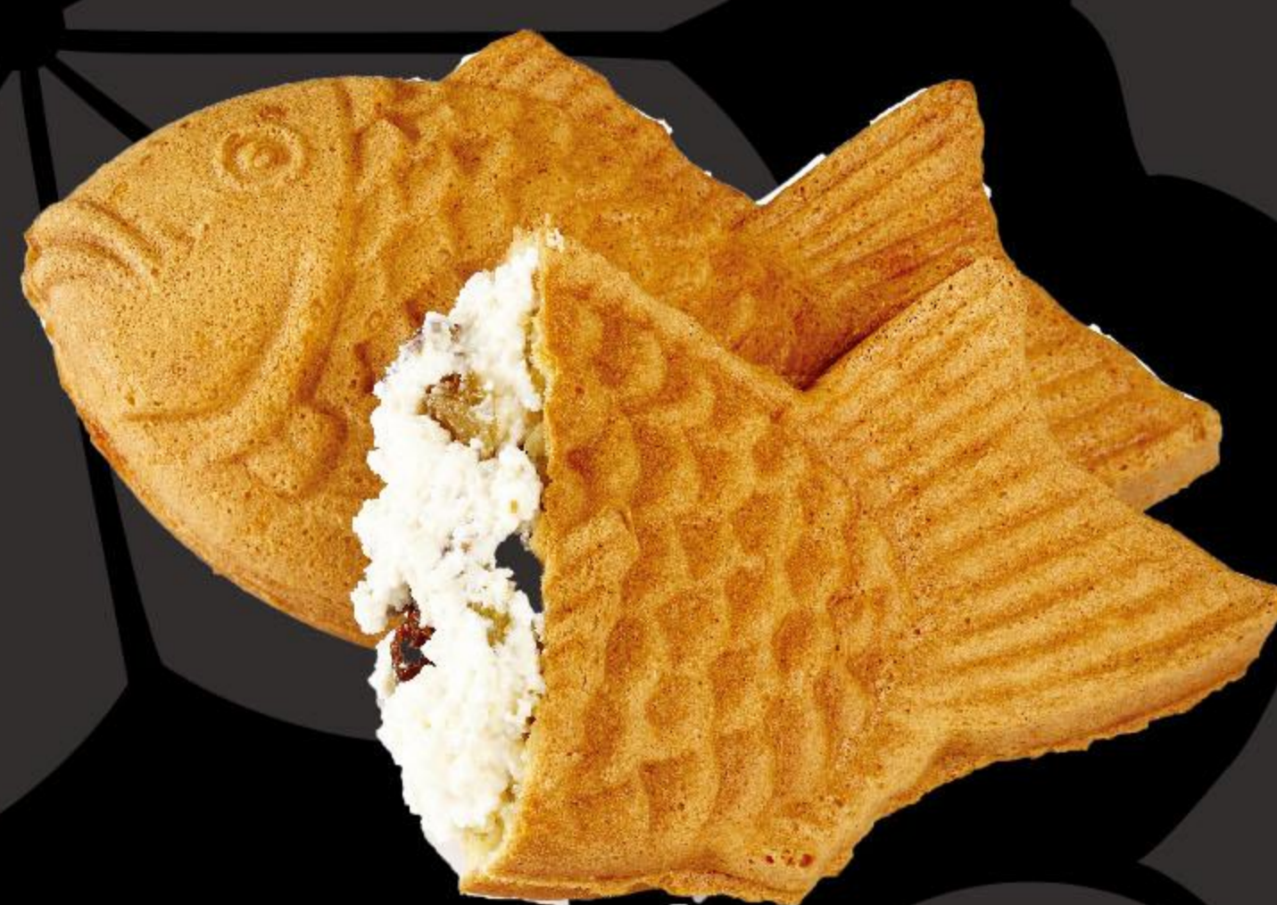
Творог с изюмом