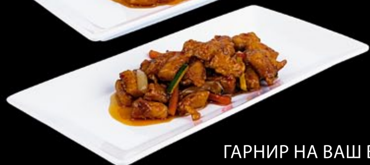
Морской окунь по шанхайски сервируется овощами 340 руб

Shanghai-style sea perch served with vegetables