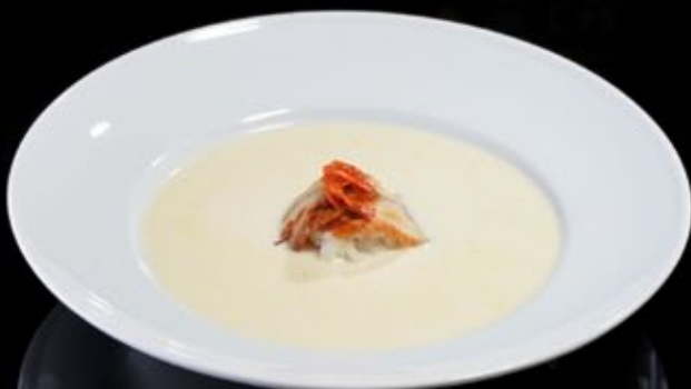
Сливочный суп с угрем и кунжутным маслом 220 руб Cream soup with eel and sesame oil