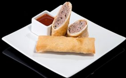
Спринг ролл с говядиной 260 руб

С сельдереем и ледяными грибами с остро-кислым соусом Spring roll with beef Celery and mashrums served ice sharp-sour sauce