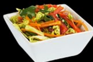
Микс из свежих овощей Mix from fresh vegetables