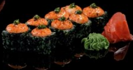
Йокогама 330 руб

Лосось, моцарелла, бонито Bonito-maki Salmon, mozzarella, bonito