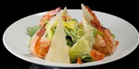
Салат Цезарь с креветками 380 руб

Salmon carpaccio with pesto and pine nuts