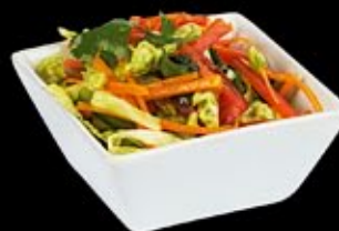
Микс из свежих овощей Mix from fresh vegetables