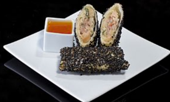
Спринг ролл с окунем и паприкой 260 руб

С паприкой и кунжутным соусом Spring roll with chicken Served with paprika and sesame sauce