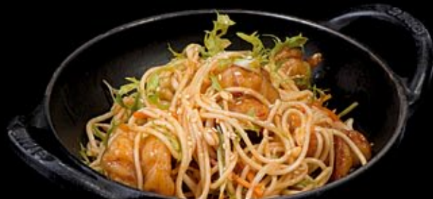
Креветки в карамели

Сервированный бамбуком и устричным соусом Pike perch sun-shu Served with bamboo and oyster sauce