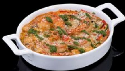
Гратин с креветками и овощным жульеном 260 руб

Gratin with shrimp and vegetable julienne