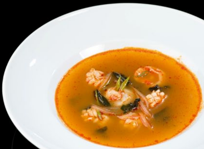
Том-Ям Тайский суп 260 руб Thai Tom Yam soup