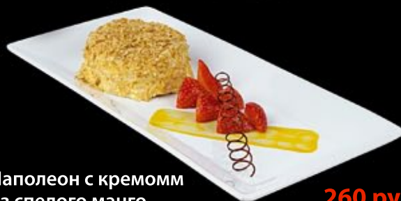
Наполеон с кремом из спелого манго