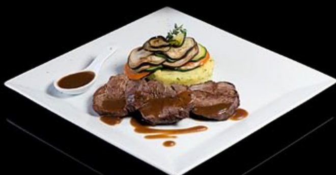
Медальоны из говядины Angus 950 руб

Сервированные овощным рататумом и соусом из выдержанного портвейна Medallions of Angus Beef served with vegetable ratatouille and port wine sauce