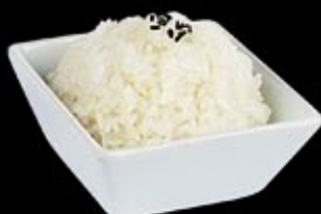
Белый рис на пару Steamed rice

ГАРНИР НА ВАШ ВЫБОР: Garnish of your choice