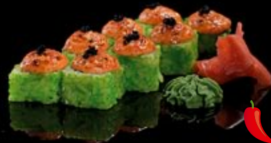
Чикен-маки 260 руб

Креветка, филадельфия, огурец Shrimp-philadelphia Shrimp, philadelphia, cucumber