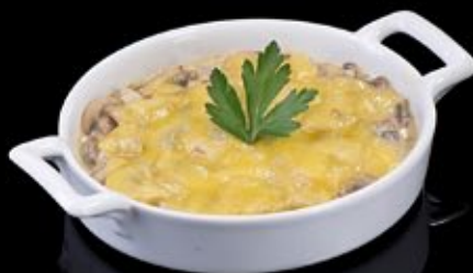
Гратин из шампиньонов в сметане 220 руб

Gratin with shrimp and vegetable julienne