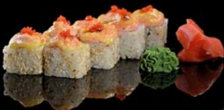
Бонито-маки 280 руб

Курица, паприка, сыр Chicken-maki Chicken, paprika, cheese