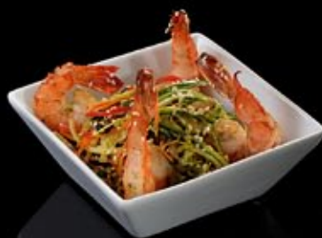
Салат из королевских креветок с японским рисом и шиитаки 330 руб

Harbin salad with smoked eel and chicken breast in sesame marinade