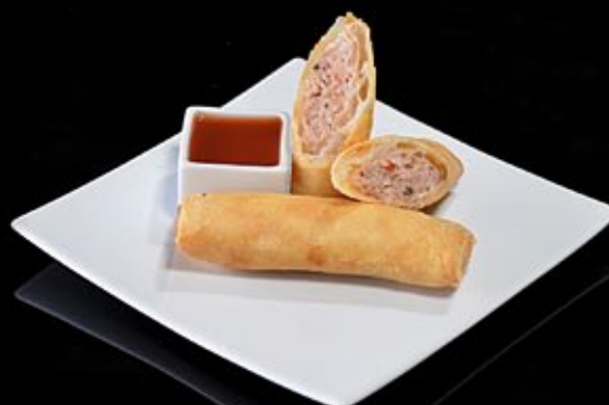
Спринг ролл с мясом цыпленка 260 руб

С соусом из йогурта и мяты Spring roll of mutton Served with sauce of johgurt and mint