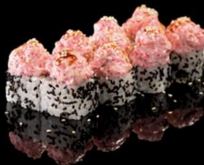
Нагано 300 руб

Тунец, филадельфия, огурец Kosinaga-maki Tuna, philadelphia, cucumber