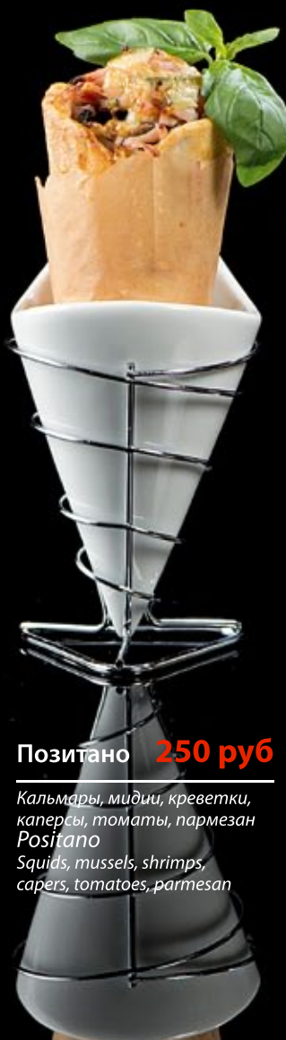
Позитано 250 руб

Бекон, грибы, сливки, яйцо, пармезан Carbonara Bacon, mushrooms, cream, eggs, Parmesan