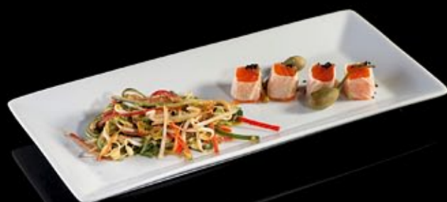
Салат с копчёным лососем и хрустальной лапшой 300 руб

Salad with smoked salmon and crystal noodle