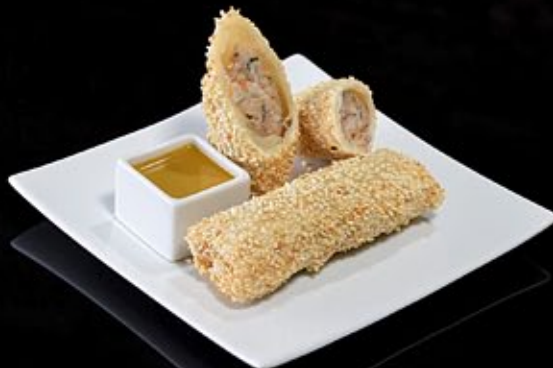
Спринг ролл со свиной 270 руб

С сельдереем и ледяными грибами с остро-кислым соусом Spring roll with beef Celery and mashrums served ice sharp-sour sauce