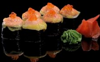
Креветка-филадельфия 280 руб

Окунь, креветка, огурец Maki-mix Perch, shrimp, cucumber