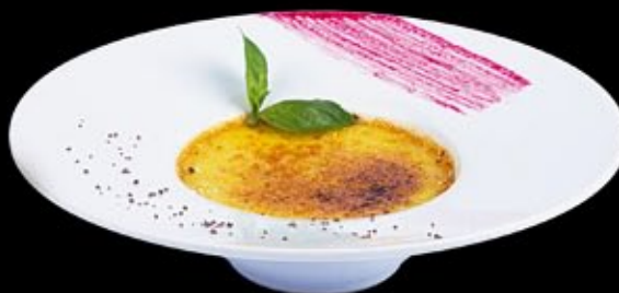
Крем брюле с пьяной вишней в золотой карамели