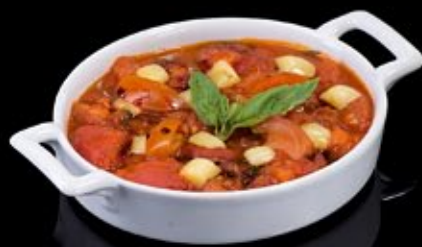
Гратин с томатами и базиликом 200 руб