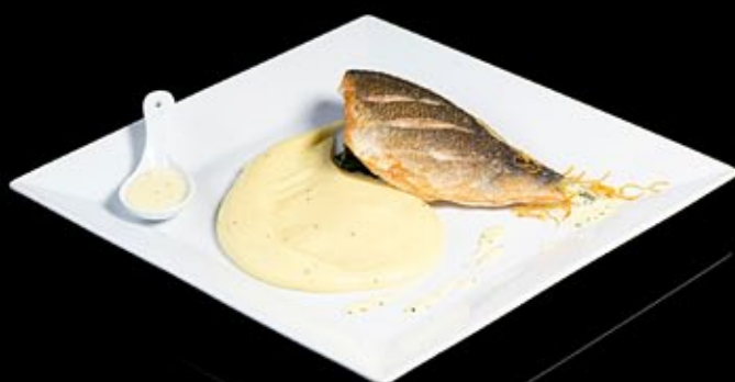
Филе дорадо в глазури из зелени 550 руб

Сервированное картофельным пюре и конфи из шпината Fillet of dorado in the glaze of greens Served mashed truffles and artichoke