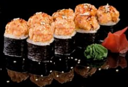
Мидии-маки 290 руб

Лосось, кальмар, угорь, окунь, огурец, филадельфия Nagano Salmon, squid, conger, cucumber, bass, philadelphia cheese