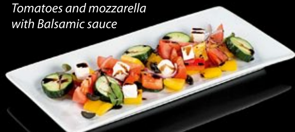
Греческий салат 260 руб

Vegetables fried on grill with pine nuts and pesto sauce