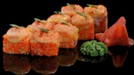
Маки-микс 300 руб

Окунь, креветка, огурец Maki-mix Perch, shrimp, cucumber