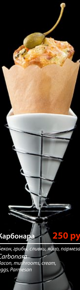
Карбонара 250 руб

Испанские колбасы, томаты, грибы, перец Чили, пармезан Picanto Spanish sausage, tomatoes, mushrooms, chilli, parmesan