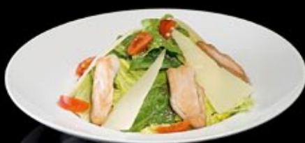
Салат Цезарь с ломтиками куриной грудки 380 руб

Salad of grilled vegetables with smoked tuna