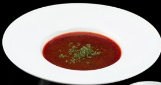
Борщ 220 руб Borsch