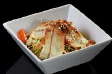
Харбинский салат с копчёным угрем и куриной грудкой 330 руб

Harbin salad with smoked eel and chicken breast in sesame marinade