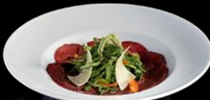
Карпаччо из говядины с белыми грибами и пармезаном 380 руб

Carpaccio of beef with porcini mushrooms and Parmesan cheese