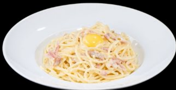
Спагетти а ля карбонара 330 руб

Spaghetti with seafood, sauce of fresh tomatoes and parmesan