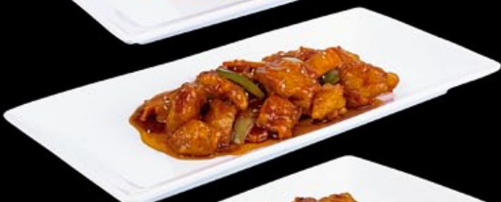
Нежный судак в карамели 375 руб

Salmon fillet in sichuan sauce with soy sprouts