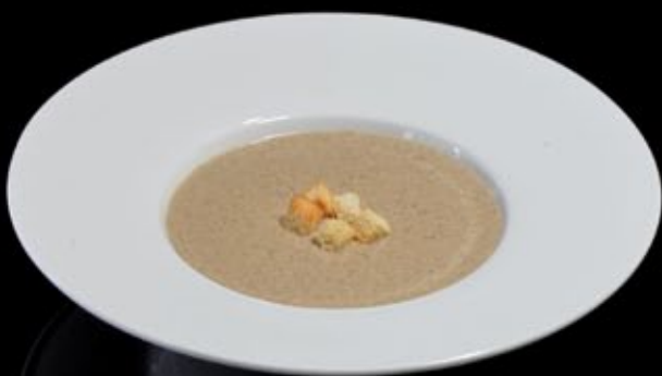
Грибной крем-суп 260 руб Mushrooms cream soup