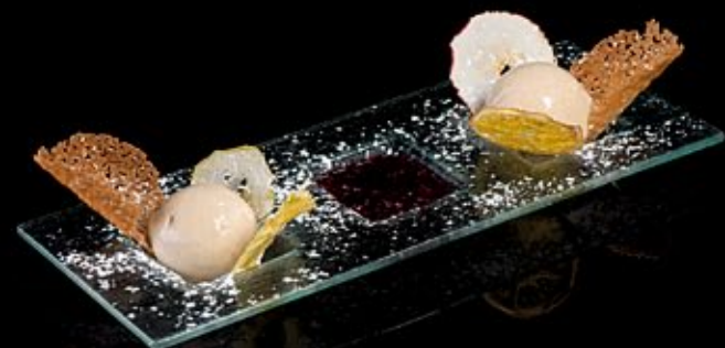
Мороженное Топленое молоко