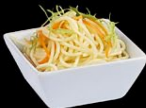
Яичная лапша Egg noodles