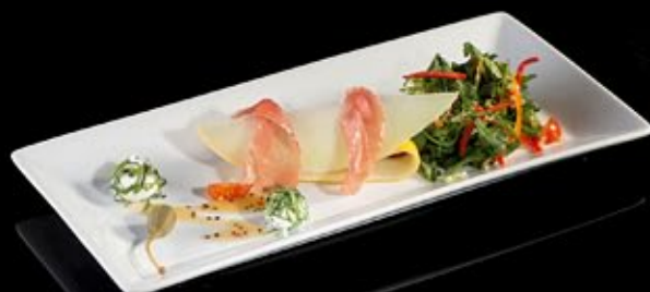
Салат из дыни с пармской ветчиной и сыром фета 300 руб