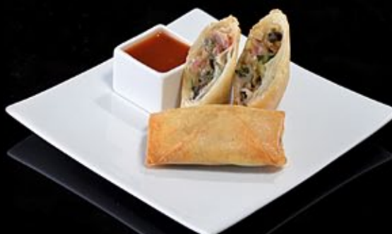
Спринг ролл с беконом и пармезаном 260 руб

И водорослями в томатном соусе Spring roll with seafood Served with seaweed in a tomato sauce