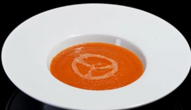
Крем-суп из томатов 180 руб Tomato cream soup