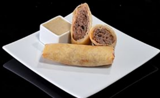
Спринг ролл из баранины 340 руб

С кисло-сладким соусом Spring roll with bacon and parnesan Served with sour-sweet sauce