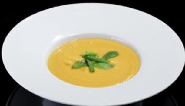
Гороховый крем-суп 180 руб Pea cream soup