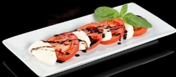
Томаты и моцарелла с соусом бальзамик 350 руб

Salad with smoked salmon and crystal noodle