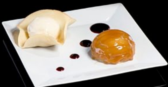
Тёплый яблочный пирог

С растаявшим сердцем, сервируется мороженым из топленого молока Mi-cru mit-cuit chocolate Praline, with a burnt milk ice-cream