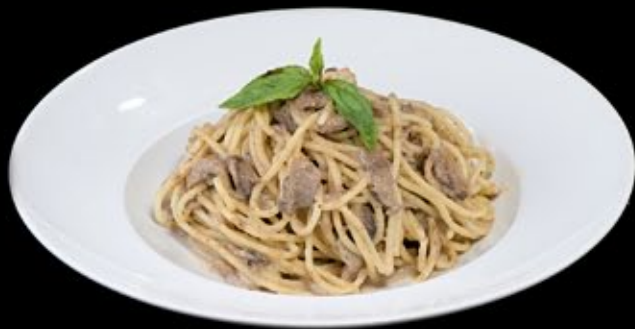
Спагетти с дарами моря, соусом из свежих томатов и пармезаном 300 руб

Spaghetti with seafood, sauce of fresh tomatoes and parmesan