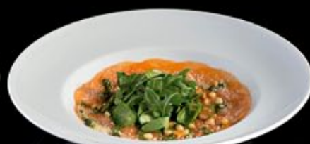
Карпаччо из лосося с соусом песто и кедровыми орешками 300 руб

Carpaccio of beef with porcini mushrooms and Parmesan cheese