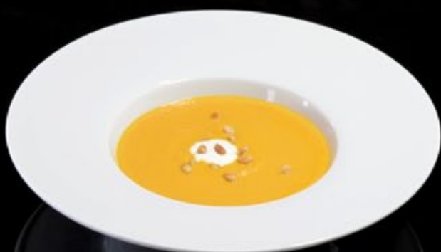
Тыквенный крем-суп с кедровыми орешками 280 руб Pumpkin soup with pine nuts