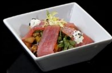
Салат из овощей гриль с копченым тунцом 330 руб

Salad of royal shrimps with Japanese rice and shiitake mushrooms