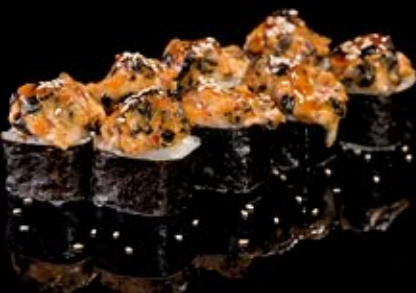
Косинага-маки 320 руб

Краб, лосось, угорь, огурец, чеснок Yokohama Crab, conger, salmon, cucumber, garlic