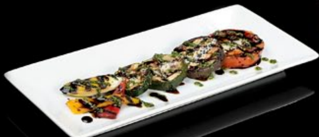
Овощи, обжаренные на гриле с кедровыми орешками и соусом песто 300 руб

Tomatoes and mozzarella with Balsamic sauce