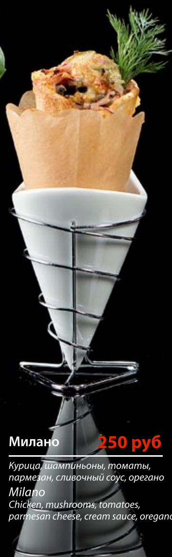
Милано 250 руб

Кальмары, мидии, креветки, каперсы, томаты, пармезан Positano Squids, mussels, shrimps, capers, tomatoes, parmesan