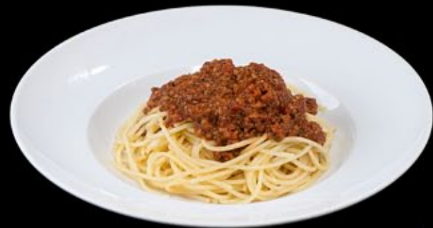
Спагетти а ля болоньезе 330 руб

Spaghetti with seafood, sauce of fresh tomatoes and parmesan