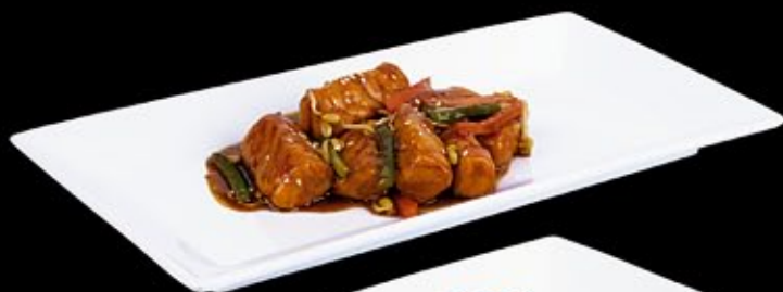
Филе лосося в сычуанском соусе с проростками сои 395 руб

Salmon fillet in sichuan sauce with soy sprouts