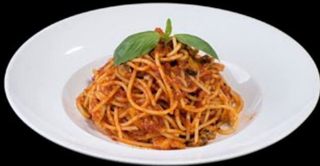
Спагетти с дарами моря, с соусом из свежих томатов и пармезаном 330 руб

Spaghetti with seafood, sauce of fresh tomatoes and parmesan