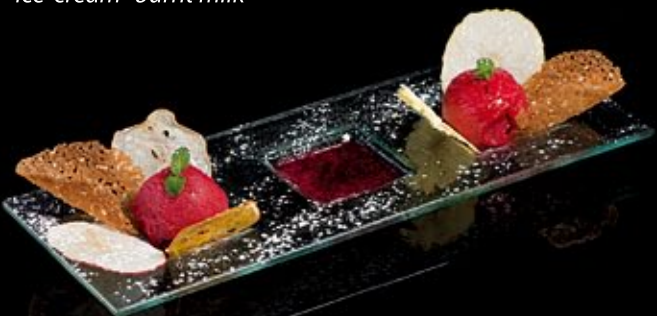
Сорбет из малины и мяты

Crème-brulee with drunk cherry in gold caramel