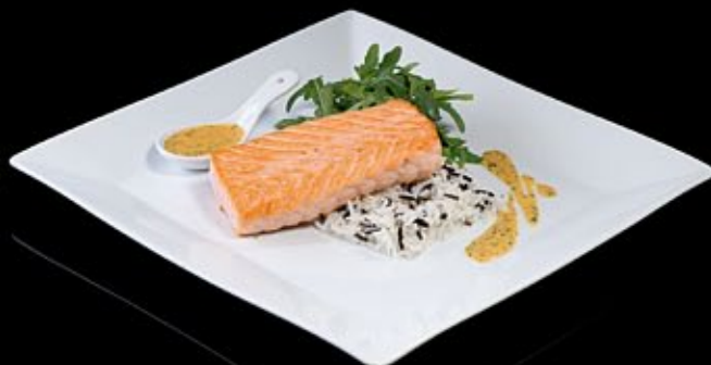
Филе судака 530 руб

С рисом басмати и соусом из грейпфрутов и кориандра Crispy salmon with iceberg Salad and basmati rice and grapefruit and coriander sauce