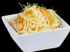
Яичная лапша Egg noodles