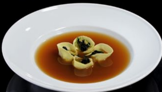
Тайванский суп 220 руб Равиоли с гамбас, зеленый лук, морские водоросли Taiwan soup Gambas ravioli, green onion, seaweed