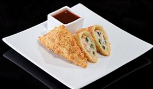
Спринг ролл с морепродуктами 260 руб

С пряными травами и ореховым соусом Spring roll with pork and herbs Served with nut sauce