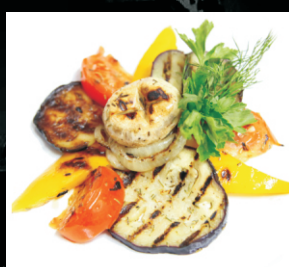
Овощи гриль (перец болгарский, баклажаны, томаты шампиньоны) 1/100