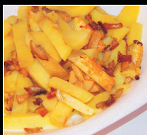
Картофель жареный с грибами 1/120