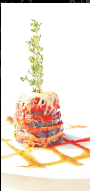
Башня Пармеджано (баклажан обжаренный с томатами, в томатном соусе Пилатти, Пармезаном и тимьяном) 1/180