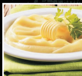
Пюре (картофельное) 1/100