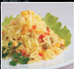
Ризотто (рис с овощами) 1/100