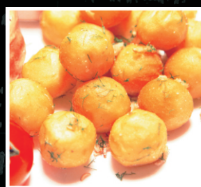
Крокеты (картофельные шарики) 1/100