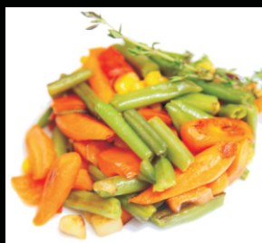
Овощное соте (морковь мини, стручковая фасоль, кукуруза, перец болг.,) 1/100