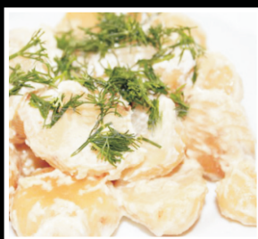
Картофель в сметане 100/20/2