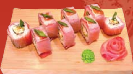
Намидзи Маки 450.- мясо краба, огурец, тунец, острый соус