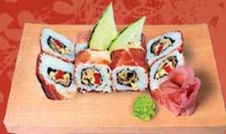
Парма Маки 430.- пармская ветчина, овощи темпура, язык