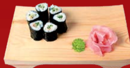
Каппа Маки 110.- огурец, кунжут