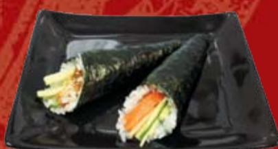
Магуро Темаки 85.- тунец, огурец, рис, нори