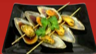
И-Гай Якитори 380.- зеленые мидии, Терияки соус