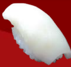
Сакана Но Абула 95.- масляная рыба