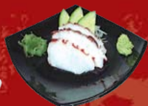
Тако 340.- осьминог