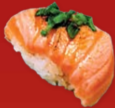
Сяке 100.- лосось