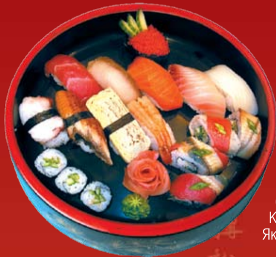
Токудзе 900.- лосось, тунец, копченый угорь, желтохвостик, тамаго, морской окунь, кальмар, осьминог, красная икра тобико, сладкая креветка, Каппа маки и Якодзима маки