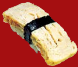
Тамагояки 75.- японский омлет