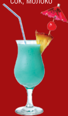
Спящий Монах 300.- текила, Блю Кюрасао, мякоть гуанабаны