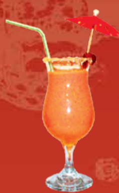
Оканемоти 150.- персиковый сок, молоко, кокосовый и клубничный сиропы