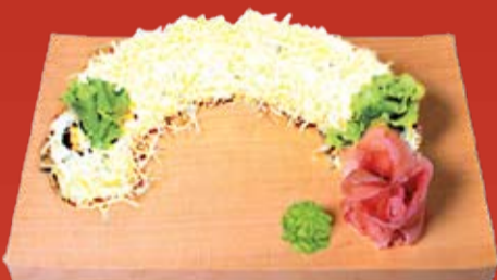
Цезарь Маки 260.- обжаренное куриное филе, сыр, соус Цезарь