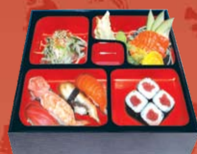
Суши Бенто 495.- набор суши, роллы, салат суномоно

ЖДЕМ ВАС НА БЕНТО ЛАНЧ В БУДНИЕ ДНИ С 12:00 ДО 16:00