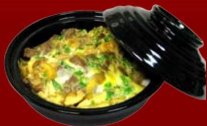
Гюдон 300.- говядина, тушенная в соусе Скияки с яйцом, на рисе