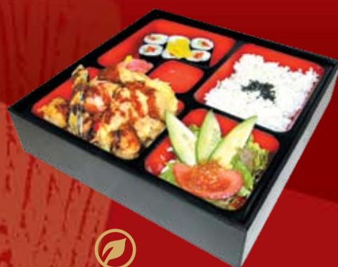
Вегетарианское Бенто 350.- Каппа Пеппер маки, овощи темпура, соус Хирекацу