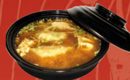
Суйгёза 310.- японские пельмени в бульоне (креветка или свинина)