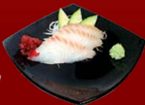
Идзуми Тай 250.- морской окунь