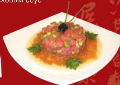
ТарТар 000.- тунец, авокадо, оливковое масло, салатная заправка, лук порей, икра тобико черная