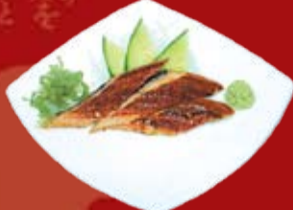
Унаги 300.- копченый угорь