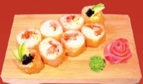
Хотатегай Маки 250.- Обжаренный ролл с морским гребешком, креветками, сыром Филадельфия и икрой летучей рыбы