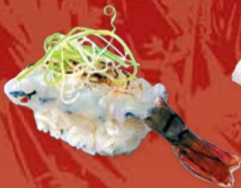
Нама Эби 95.- свежая тигровая креветка