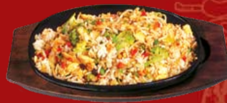
Темпьянки с Морепродуктами 350.- рис, обжаренный на сковороде