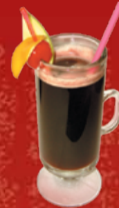
Каико 200.- мед, ром, красное вино, вишневый сок, вишневый чай, вишневый сироп