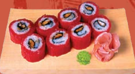
Магуро Маки 440.- тунец и копченый угорь