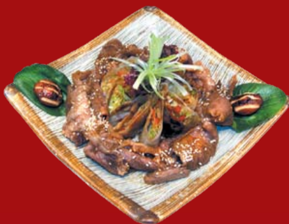
Симафури Скияки 760.- мраморная говядина в соусе Скияки с овощными конвертиками спринг ролл