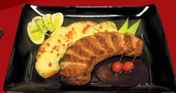
Камо Ка Яки 870.- утиная грудка, картофель, соус Мора