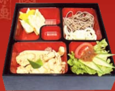
Удон Соба Бенто 350.- креветка, курица и ананас в сливочно-горчичном соусе