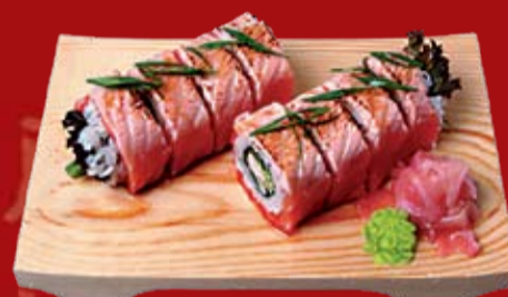
Сяке Татаки Маки 410.- опаленный ролл с лососем, грибами шиитаке и огурцом