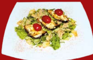
Хамачи Сарада 000.- желтохвостик запеченный под сыром, пармезан, салатный лист, тигровые креветки, кедровый орех, черри