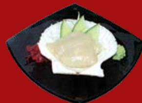
Хотатегай 250.- морской гребешок