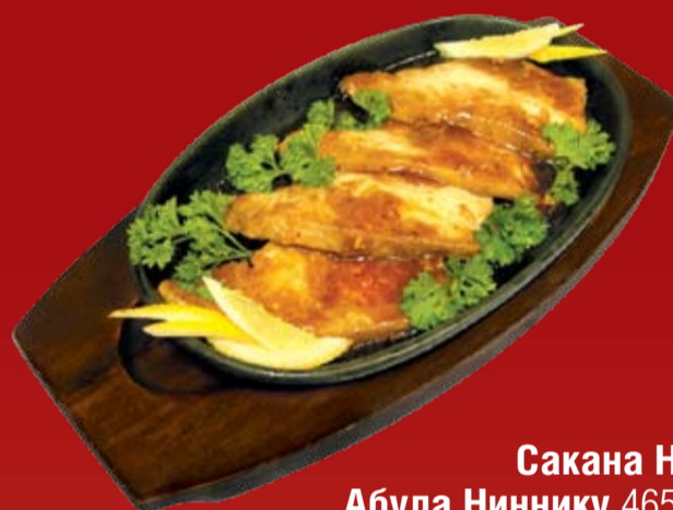
Сакана Но Абула Ниннику 465.- масляная рыба в чесночном соусе