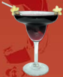
Пьяная Вишня 220.- вишневый сок, белый ром, кокосовый сироп, Блю Кюрасао