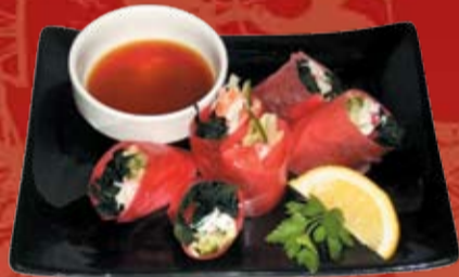
Канису Ролл 000.- соевая бумага, мясо краба, огурец, водоросли вакамэ, лимон, понзу соус