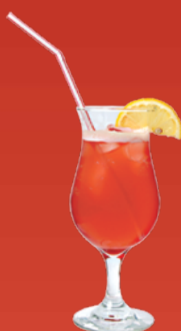
Клюквенный Летний Чай 130.- холодный черный чай, клюквенный морс