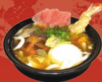
Магуро Удон 470.- рыбный бульон, лапша удон, креветка, темпура, яйцо пашот, филе тунца, грибы шиитаке