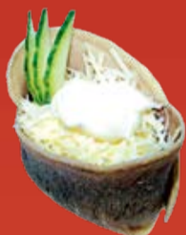
Гютан 100.- язык