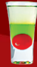
Русско-Японская Война 160.- дынный ликер, водка, лимонный сок