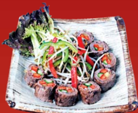
Негимаяки 550.- говядина, обжаренная с морковью и спаржей, с гарниром из овощей в соусе Терияки