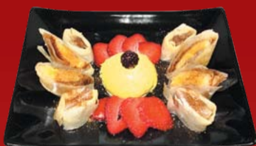
Банановый Спринг Ролл 210.- обжаренный банан, завернутый в тесто, с японским мороженым