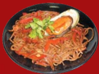
Яки Соба Гай 000.- гречневая лапша жаренная с моллюсками, красным перцем, репчатым луком, соевым соусом и чесноком