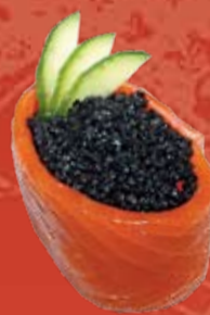
Сяке Тобико Блэк 155.- лосось, черная икра