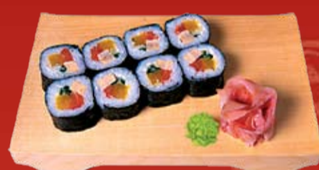
Футо Маки 260.- лосось, тамаго, такуан, огурец