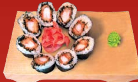
Куро То Широ Маки 270.- креветка темпура, черный кунжут, ореховый соус