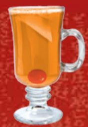
Мураками 300.- сливовое вино, мед, яблочный сок, водка