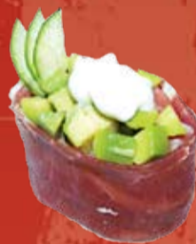
Парма 000.- пармская ветчина