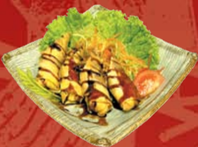
Бутанику Дзенсаи 250.- спринг-ролл со свиной и овощами, с соусом Хирекацу