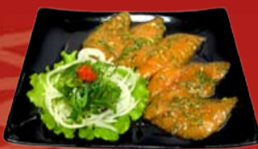
Васабико Сякэ 370.- лосось, маринованный в эксклюзивном соусе из васаби, с водорослями