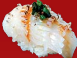
Ика 100.- кальмар