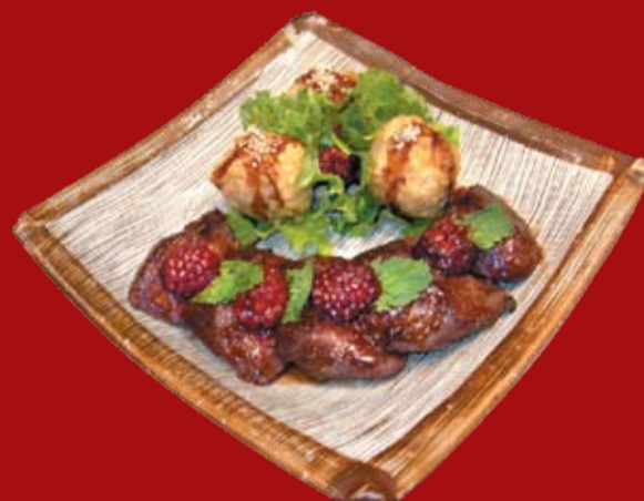
Якинику Терияки 000.- филе страуса в териякисоусе с ежевикой, подается с рисовыми шариками в темпурном кляре