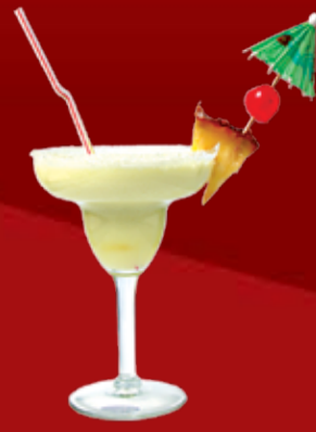
Мидори Колада 260.- дынный ликер, ананасовый сок, светлый ром, молоко