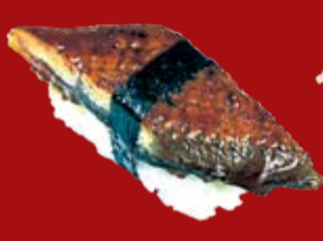
Унаги 115.- копченый угорь