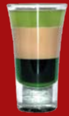
Траффик Лайт 220.- мятный сироп, Бэйлиз, абсент