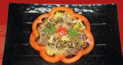
Аканасу Гютан Сарада 240.- помидор, язык, лапша соба, лист салата, огуречная заправка