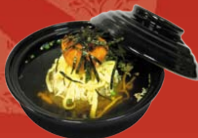
Сяке Чадзукэ 220.- похлебка из лосося, риса и лапши чакин