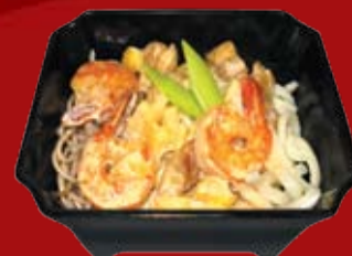
Удон Соба 380.- лапша гречневая и лапша удон с креветкой, курицей и ананасом в сливочно-горчичном соусе