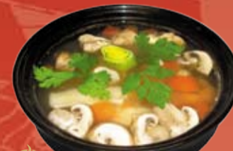
Том Ям 210.- острый тайский суп с помидором, кальмаром, курицей, шампиньонами