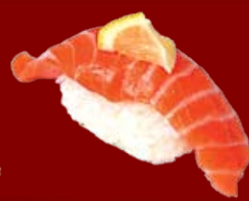
Сяке Гурме 100.- копченый лосось