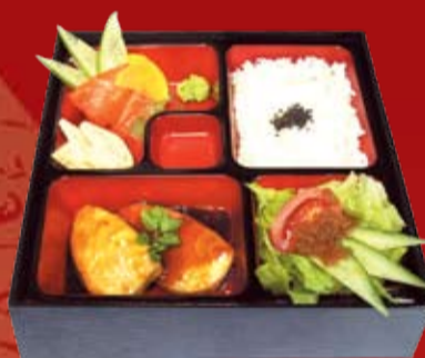
Сакано Но Абула Бенто 320.- нежное филе масляной рыбы в чесночном соусе