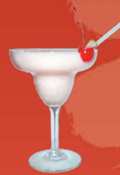
Эпл Крим 150.- мороженое, яблоко, молоко, клубничный сироп