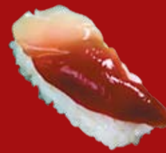
Хоккигай 110.- моллюск хокки