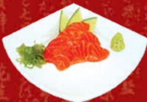
Сяке Гурме 280.- копченый лосось