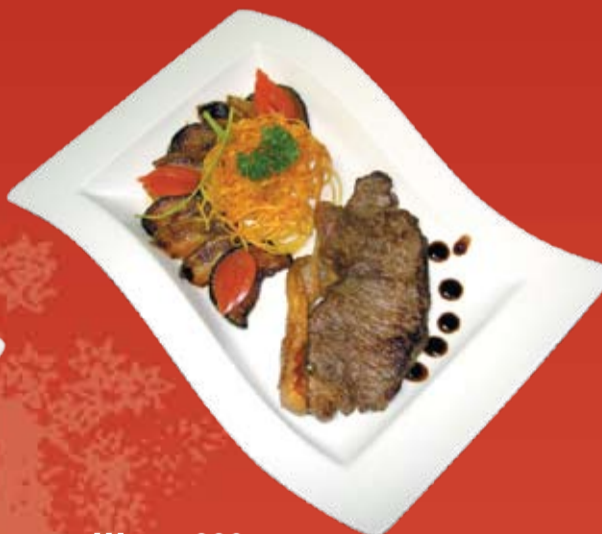
Щисо 830.- стейк из говядины