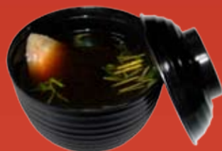
Суимоно Суп 000.- рыбный бульон, морской карась, цедра лимона, зеленый лук