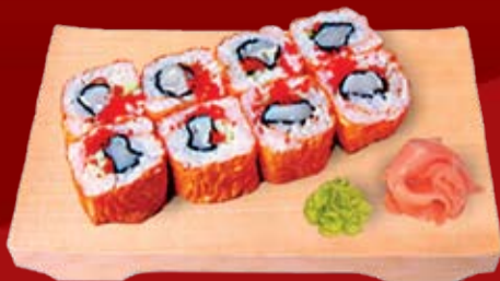
Сой Бин Маки 000.- морской гребешок, тобико, огурец и морковь терияки, в листе соевой бумаги, майонез