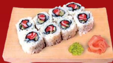
Сякэ Маки 000.- лосось, огурец, майонез