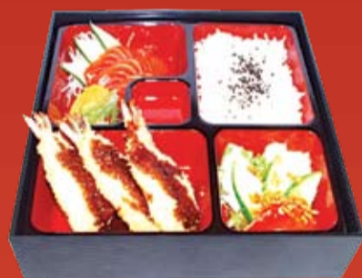
Эби Фрай Бенто 340.- тигровая креветка, обжаренная в темпурном кляре и сухарях