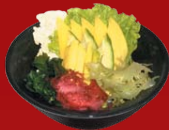
Иногу Манго Салат 000.- лист салата, пекинская капуста, манго, водоросли вакамэ, водоросли зеленые и красные, соус медовогогорчиный