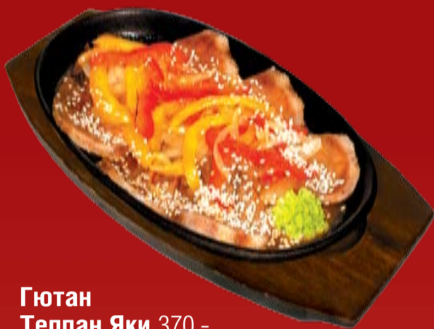
Гютан Теппан Яки 370.- говяжий язык в соусе Мисояки с овощами