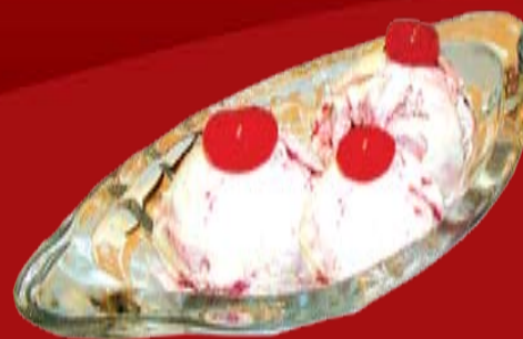
Мороженое Пломбир 130.- Мороженое Манго 230.- Мороженое Сакура 230.-