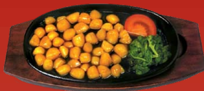
Хотатегай Терияки 760.- морские гребешки, обжаренные в соусе Терияки