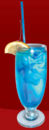
Голубая Леди 250.- вермут, Блю Кюрасао, Спрайт