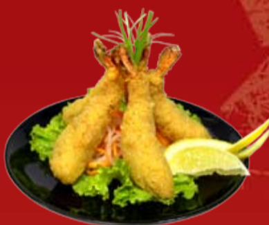
Эби Темпура 380.- креветки, обжаренные в темпурном кляре