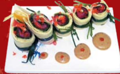
Авокадо Сякэ Сарада 000.- авокадо, лосось копченый, тобико, помидоры, салат, японский омлет, соус с дижонской горчицей