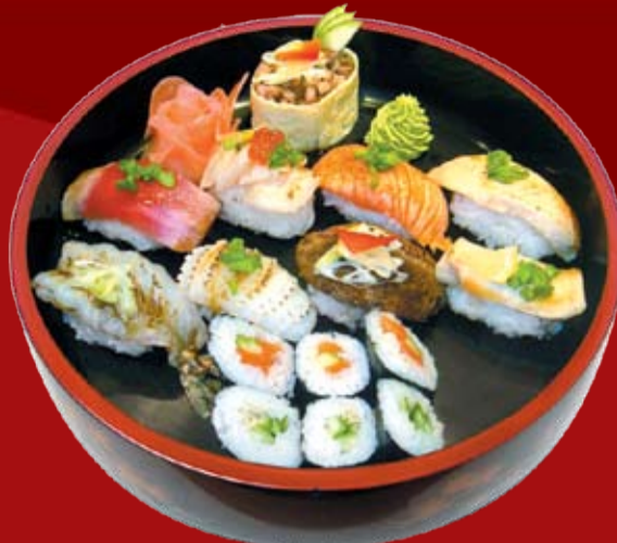
Киришима 950.- татаки суши: тунец, лосось, гребешок, утка, желтохвостик, масляная рыба, креветка, кальмар; гункан с уткой, Каппа маки и Сяке хосомаки