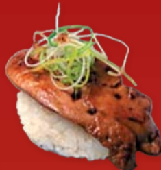
Фуа Гра 210.- гусиная печень