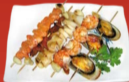
Якитори Умино Сачи 000.- зеленые мидии, кальмар, лосось, креветка, аккагай