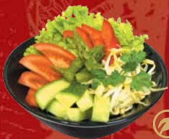
Зеленый Салат 220.- свежие овощи с имбирной заправкой