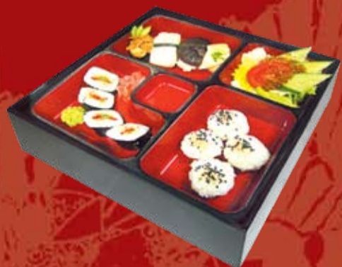
Суши Бенто 220.- ролл со сладким перцем и дайконом, нигири суши с масляной рыбой, шиитаке и тамаго, гункан с масляной рыбой