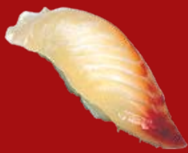
Идзуми Тай 95.- морской окунь