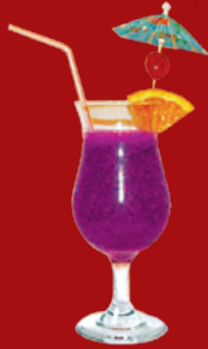
Бара Иро 260.- мякоть моры, джин, клюквенный морс