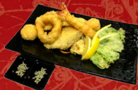
Темпура Мориавасэ 495.- лосось, желтохвостик, кальмар, креветка, шпинат