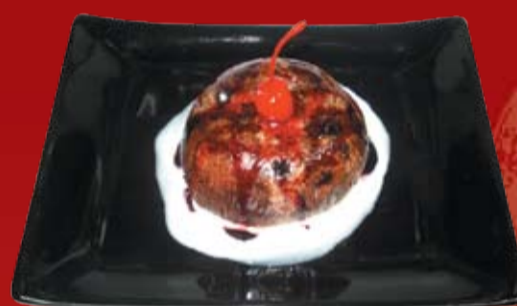
Вагаси 190.- шоколадный, ванильный, с вишней