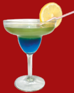
Дакуна Хана 270.- ананасовый сок, Куантро, вермут, Блю Кюрасао