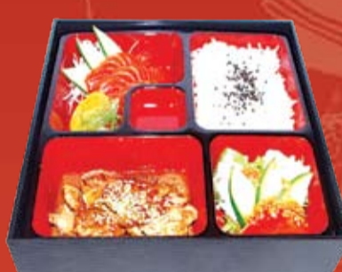
Яки Бутанику Бенто 370.- обжаренная свинина