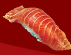
Сяке 95.- лосось