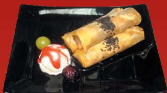
Саку-Саку 330.- хрустящий десерт с яблоками, миндалем, виноградом, медом и мороженым в горячем клиновом сиропе