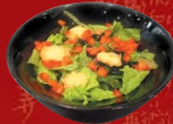
Хотатэ Сарада 250.- салат из водорослей Чукка и обжаренного морского гребешка, с ореховым соусом