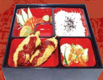
Гю Кацу Бенто 280.- говядина, обжаренная в темпурном кляре и сухарях