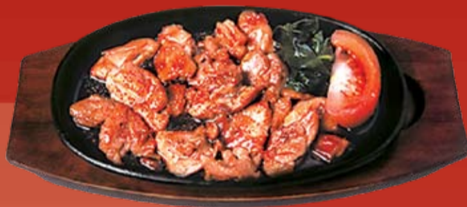
Тори Терияки 340.- кусочки курицы, обжаренные в соусе Терияки