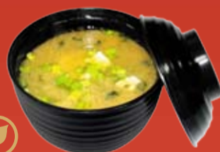
Мисо Широ 95.- традиционный японский соевый суп