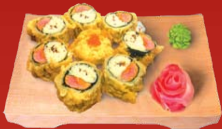
Кикка Темпура Маки 340.- лосось, тунец, икра летучей рыбы, обжаренные в кляре