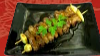
Сунагимо Якитори 210.- куриные сердечки, Терияки соус