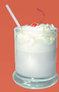
Зимняя Вишня 150.- мороженое, молоко, вишневый сироп