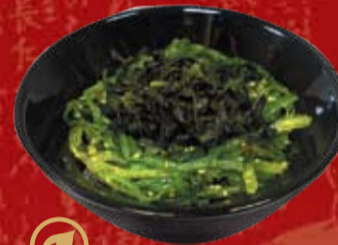
Чукка 330.- салат из маринованных водорослей с ореховым соусом