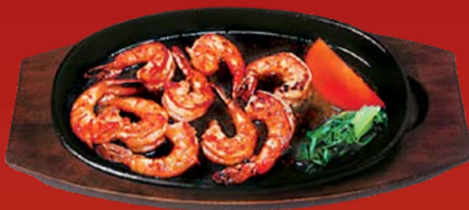
Ниннику Эби 520.- тигровые креветки, обжаренные в чесночном соусе