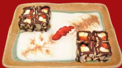
Домино 330.- шоколадный ролл со свежими фруктами и миндальными лепестками