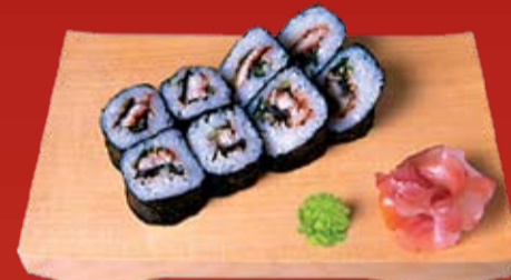
Унаги Маки 250.- копченый угорь, огурец