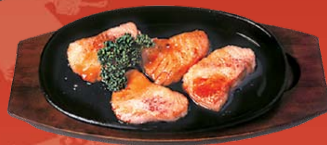
Сякэ Терияки 440.- лосось, обжаренный в соусе Терияки