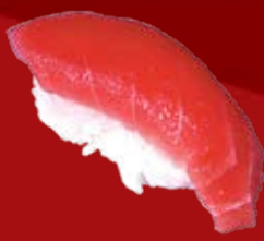
Магуро 100.- тунец