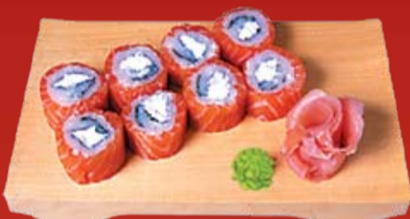
Филадельфия Маки 430.- сыр Филадельфия, лосось