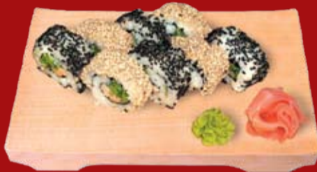
Гома Ура Маки 000.- тунец обжаренный в терриакки соусе, лист салата, огурец, майонез, кунжутное семя черное и белое