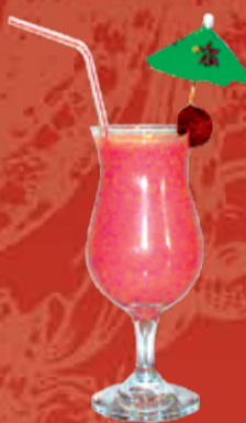
Кои 160.- клубника, клубничный сироп, молоко