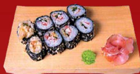
Темпура Маки 260.- креветка, огурец, маринованный имбирь, обжаренные в кляре