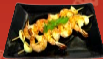
Эби Якитори 340.- креветки, Терияки соус