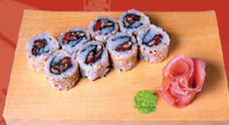
Момиджи Такз Маки 190.- обжаренные грибы, сладкий перец, кунжут, ореховый соус