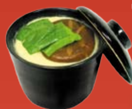
Чаван Муши 120.- яичная смесь с креветкой, курицей, грибами и шпинатом, приготовленная на пару