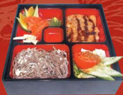
Тонкацу Бенто 300.- классическая японская свинная отбивная с куриной грудкой и сыром Филадельфия