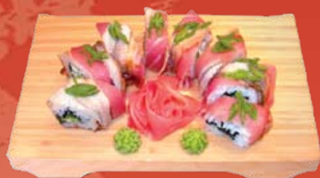
Якодзима Маки 385.- чукка, сыр Филадельфия, дайкон, кунжут, угорь, тунец, зеленый лук, Унаги соус