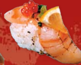
Хотатэгай 100.- морской гребешок