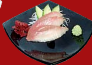
Хамачи 410.- желтохвостик