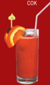
Юме 200.- Кампари, апельсиновый сок, гранатовый сироп