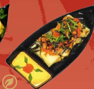
Харумаки Спайси Сякэ 270.- конвертики спринг ролл с лососем, сыром Филадельфия, шпинатом и острым соусом