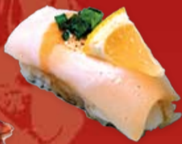
Сакана Но Абула 95.- масляная рыба