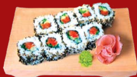
Сяке Маки Блек 300.- лосось, огурец, икра летучей рыбы, кунжут