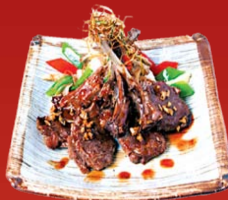
Кохитсуджи Но Нинникуяки 800.- корейка ягненка в пикантном соусе с гарниром из риса и овощей