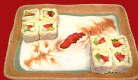
Белая Орхидея 350.- ролл из сладкого риса со сливками, свежими фруктами и кокосовой стружкой