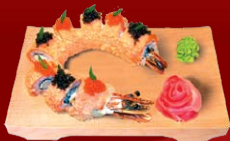
Сенкоу Маки 490.- креветка джамбо, лосось, икра летучей рыбы, сыр Филадельфия