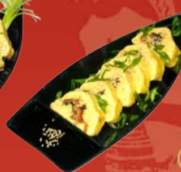
Умаки 000.- традиционный японский омлет с угрем