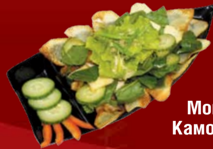
Моцарелла Камо Сарада 400.- утиная грудка, картофельные чипсы, сыр Моцарелла, шпинат, ореховый соус