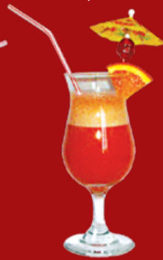
Якусосу 260.- мякоть папайи, водка, вермут