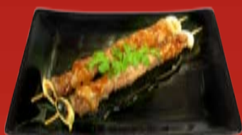
Бутанику Якитори 220.- свинина, Терияки соус