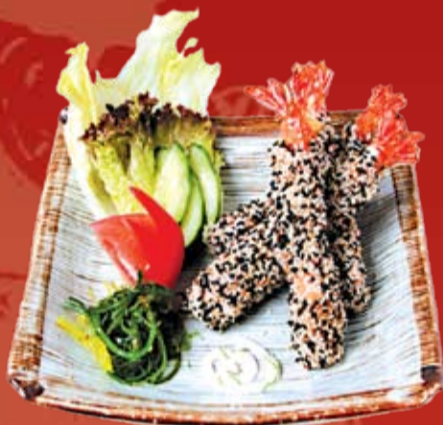
Куро То Широ Эби 000.- жареные креветки под ореховым соусом в кунжутных зернах