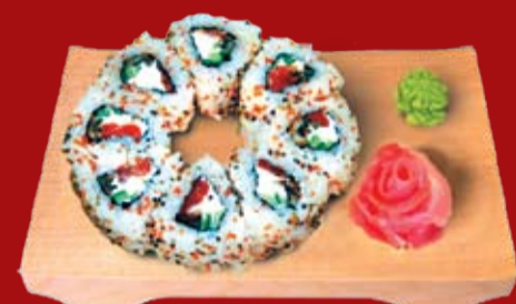
Сяке Унаги Маки 330.- копченый угорь, лосось, икра летучей рыбы, сыр Филадельфия