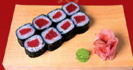
Текка Маки 320.- тунец