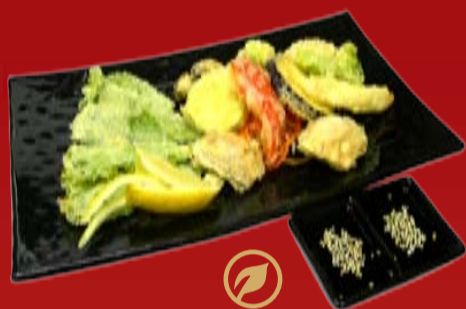
Ясай Темпура 230.- овощи, обжаренные в темпурном кляре