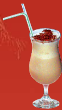
Хонуман 200.- мороженое, кофе эспрессо, миндальный и шоколадный сиропы, молоко