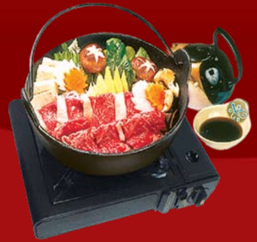
Сябу Сябу тонко нарезанная мраморная говядина, тофу, лапша удон, грибы и овощи, с ореховым и Пондзу соусами

Блюда готовятся официантом на Вашем столе. 1700.-