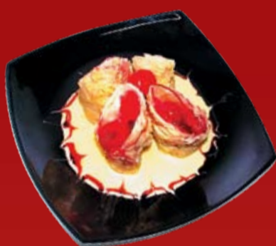
Сакура Плам 000.- сладкие конвертики с вишней в сливочном соусе