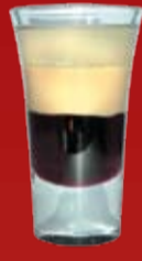
Цвет Сакуры 230.- вишневый сироп, Бэйлиз, Куантро