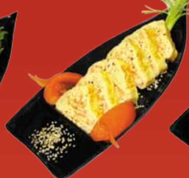
Тамаго Сяке 260.- японский омлет с лососем и соусом Терияки