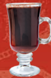
Глинтвейн Гармония 200.- красное вино, гранатовый сок, гвоздика