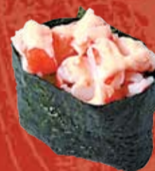
Магуро Спайси 110.- тунец