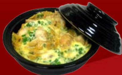
Оякодон 230.- кусочки курицы, тушенные в соусе Скияки с яйцом, на рисе