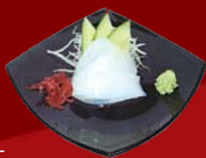
Ика 320.- кальмар