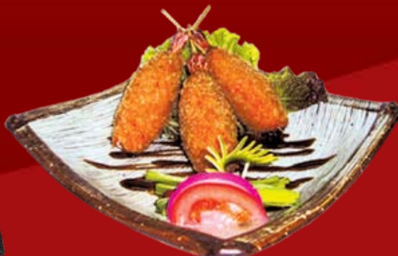
Хирекацу Умино Сяке 525.- тигровая креветка в оболочке из лосося, обжаренная в сухариках с водорослями и соусом Хирекацу