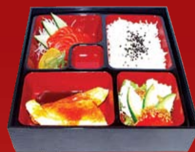
Сяке Терияки Бенто 420.- лосось, Терияки соус