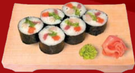
Аризона Маки 000.- лосось, тунец, желтохвостик, лист салата