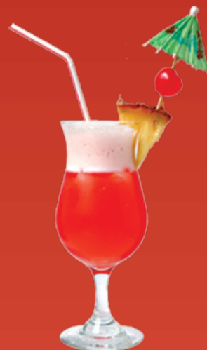
Сладкий Ветер 170.- гренадин, ананасовый сок, кокосовый сироп