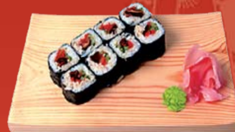
Шиитаке Маки 180.- грибы шиитаке и морковь в соусе Терияки