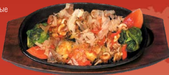
Ясай Гай Сею 000.- жаренные моллюски с овощами, с добавлением соевого соуса, украшенные стружкой тунца, шпинатом и помидором