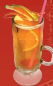
Акисама 200.- белое вино, сливовое вино, ликер Куантро, яблочный сок и мед