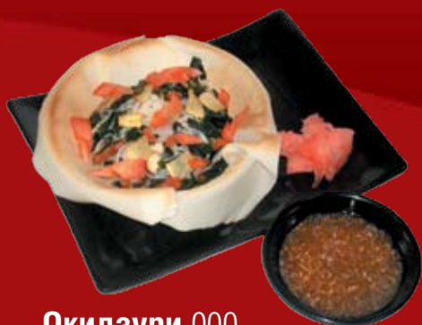
Окидзури 000.- тесто спринг ролл, помидор, чипсы картофельные, лапша рисовая, угорь унаги, водоросли вакамэ, салатная заправка