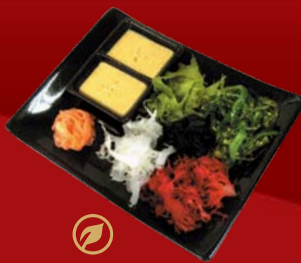
Кайсо Мориавасэ 490.- морские водоросли, ореховый соус