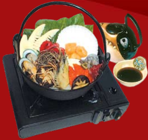
Сакана Набемоно морепродукты, японская лапша соба, мисо бульон, с ореховым и Пондзу соусами