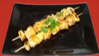
Тори Якитори 190.- курица, Терияки соус