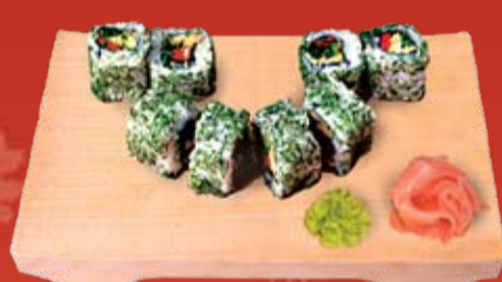
Хари Незуми Маки 000.- авокадо, водоросли чукка, майонез, свежий перец и укроп