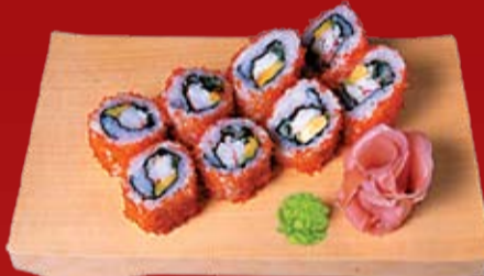
Калифорния Маки 530.- мясо краба, авокадо, огурец, икра летучей рыбы