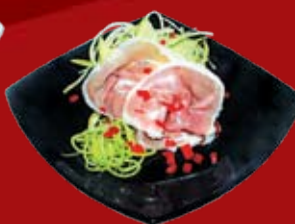
Парма 000.- пармская ветчина