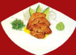
Фуа Гра 660.- гусиная печень