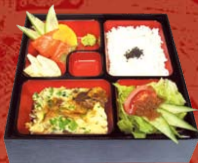
Гю Нику Бенто 350.- говядина, тушеная в соусе Скияки с яйцом и луком