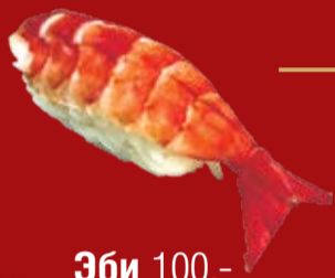
Эби 100.- вареная креветка