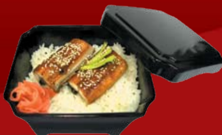
Унадзю 375.- копченый угорь на подушке из японского риса