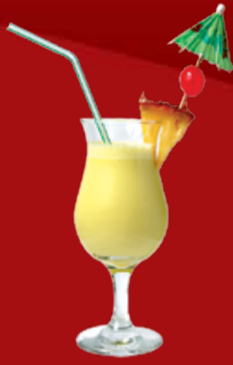
Гейша 240.- дынный ликер, апельсиновый сок, молоко