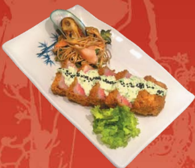
Магуро Ран Дон 000.- голубой тунец в хрустящей корочке с соусом филадельфия, подается с зеленой спаржей, гречневой лапшой в устричном соусе