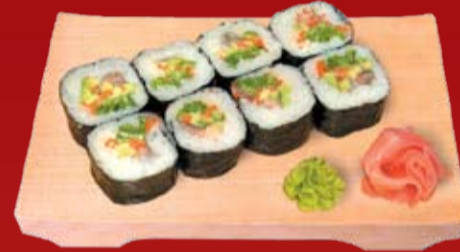
Канадиан Маки 000.- жаренная кожа лосося, майонез, авокадо, лист салата, икра тобико красная