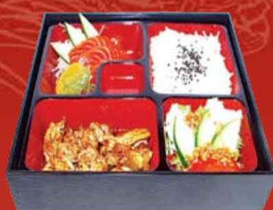
Тори Терияки Бенто 330.- курица, Терияки соус