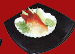
Хоккигай 290.- моллюск хокки