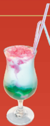
Авангард 220.- киви, лимон, сиропы дынный, банановый, клубничный, Блю Кюрасао