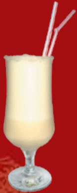
Пина Колада 275.- мякоть ананаса, Малибу, молоко, яблочный сок