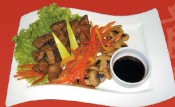
Гюнику Киноко 780.- говядина с грибами и перцем