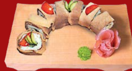
Гютан Маки 360.- язык, шампиньоны, сыр, огурец, соус Цезарь