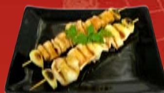
Ика Якитори 210.- кальмар, Терияки соус