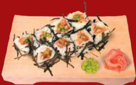
Гай Маки Терриакки 000.- жаренные моллюски, лист салата, спайс соус