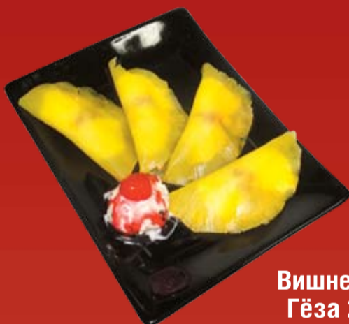
Вишневые Гёза 270.- сыр Маскарпоне и вишня в ломтиках ананаса