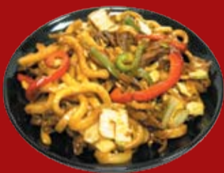
Яки Удон Говядина 465.- лапша удон, обжаренная с говядиной и овощами