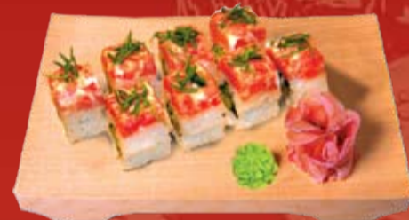
Магуро Спайси Маки 310.- тунец, сыр Филадельфия, авокадо, огурец, острый соус