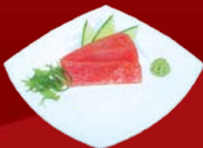
Магуро 340.- тунец