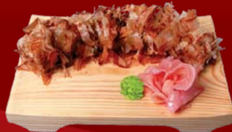
Бонито Маки 250.- сыр Филадельфия, лосось, стружка тунца, огурец