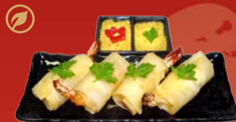
Ноук Чам 370.- конвертики спринг ролл с креветкой, курицей, сыром Филадельфия, с кисло-сладким соусом