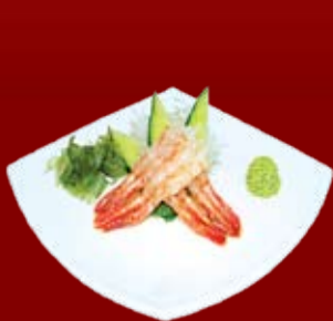
Ама Эби 410.- сладкая креветка