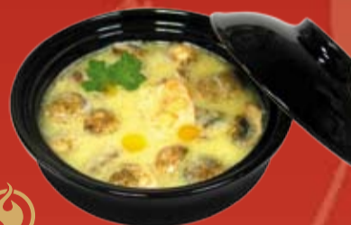
Том Кха Кай 270.- острый тайский суп на основе кокосового молока с курицей, креветками и шампиньонами