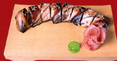
Унаги Онигара Маки 400.- копченый угорь, такуан, сыр Филадельфия, кунжут