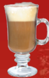
Айриш-Кофе 230.- двойной эспрессо, Бэйлиз, виски, молоко