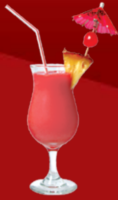
Киото 250.- светлый ром, клубничный ликер, мякоть гуавы, гренадин