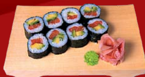
Сяке Авокадо Маки 270.- лосось и авокадо