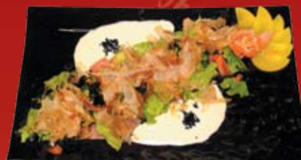
Хару Сарада 320.- тунец, огурец, помидор, салат, стружка тунца, имбирно-сырный соус