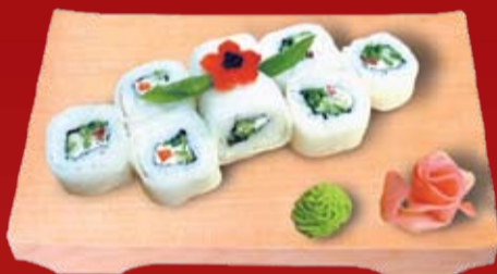
Дзюн Паку Маки 210.- чукка, сыр Филадельфия, дайкон