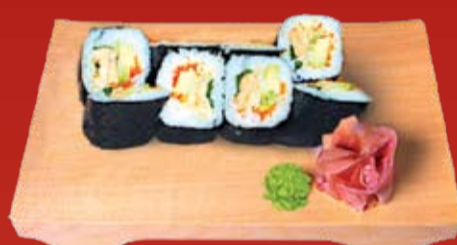
Фуа Гра Маки 510.- фуа гра в соусе терияки, авокадо, икра тобико, дайкон