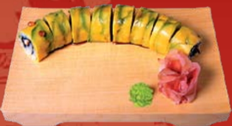
Катерпиллар Маки 310.- копченый угорь, авокадо, икра тобико и Унаги соус