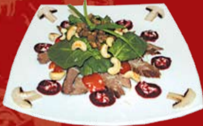
Сей Ко 000.- горячая утиная грудка, фуа гра, пармезан, шпинат, соус мора, кешью, черри