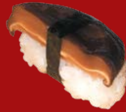
Шитакэ 000.- суши рис, гриб шитакэ