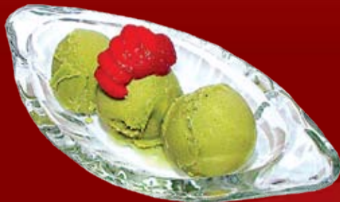
Мороженое Зеленый Чай 230.-