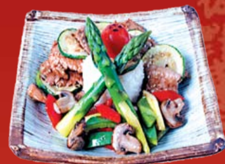
Бутанику Мисояки 640.- свинина, обжаренная с цуккини, шампиньонами, сладким перцем, в соусе Мисояки