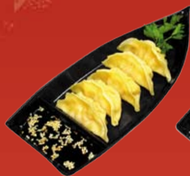
Гёза на пару 310.- приготовленные на пару японские пельмени (креветка или свинина)