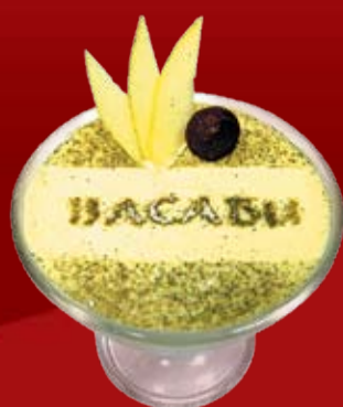
Тирамису Зеленый Чай 340.- эксклюзивный десерт на основе зеленого чая, сыра Маскарпоне и пропитанного вином бисквита