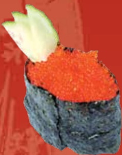
Тобико 110.- икра летучей рыбы