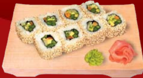
Аспарагус Маки 000.- спаржа, огурец, кунжут белый, маринованные опята (намеко), авокадо