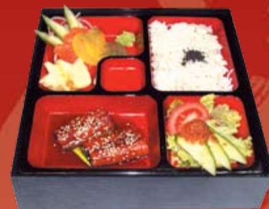
Унаги Янагава Бенто 380.- копченый угорь, лапша кудзукири