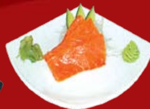
Сяке 265.- лосось