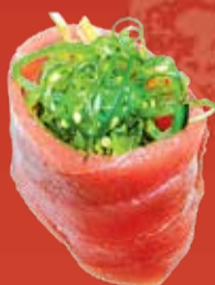
Магуро Чукка 150.- тунец, водоросли