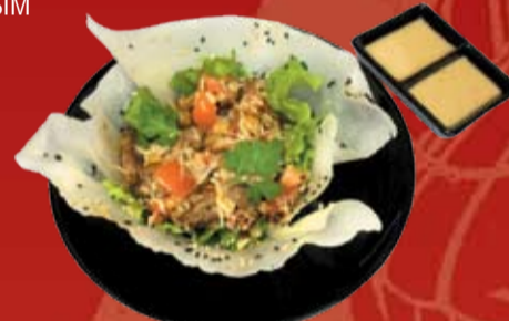
Якинику Киноко Сарада 000.- грибы намеко, шиитаки, шампиньоны, сочный помидор, листья салата, ореховый соус с диетическим мясом страуса