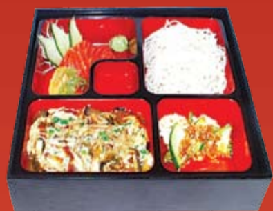
Унаги Кабаяки Бенто 290.- копченый угорь в Унаги соусе