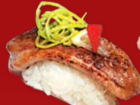
Камо 140.- утка