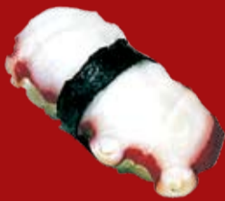
Тако 110.- осьминог