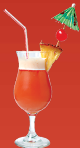
Фруктовый Пунш 140.- апельсиновый и ананасовый соки, клюквенный морс