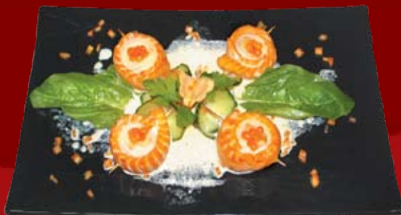
Сяке Харусаме 640.- запеченная морская форель и тунец со сливочным соусом