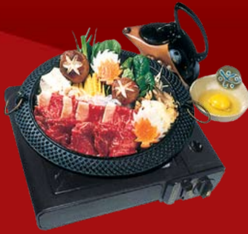
Скияки тонко нарезанная мраморная говядина, тофу, лапша кудзукири, грибы, овощи, с соусом Скияки