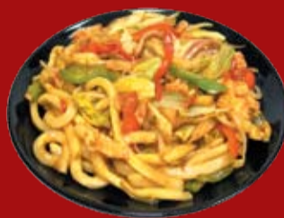
Яки Удон Морепродукты 470.- лапша удон, обжаренная с морепродуктами и овощами