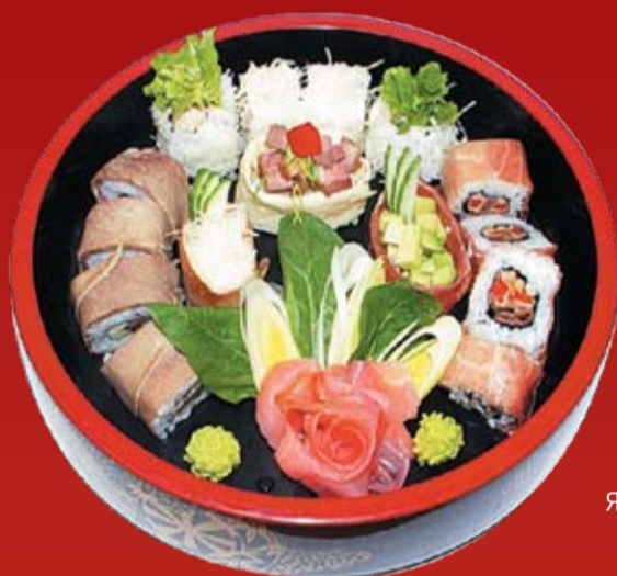
Дзю Нику Мориавасэ 970.- роллы с языком, пармской ветчиной, курицей; авторские гунканы с пармской ветчиной, уткой, языком