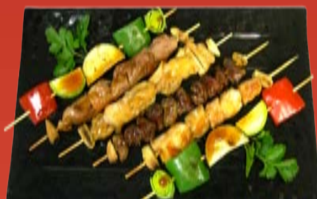
Якитори Кобэ 410.- свинина, курица, куриные сердечки, овощи