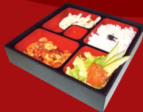
Тори Бенто 220.- куриное филе в соусе Терияки