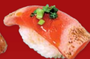
Магуро 100.- тунец