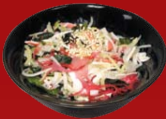
Суномоно 350.- морские водоросли, огурец, дайкон, сурими, осьминог, фирменный соус