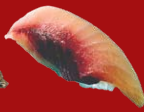
Хамачи 130.- желтохвостик