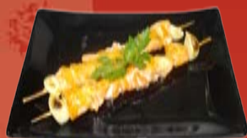
Сяке Якитори 370.- лосось, Терияки соус