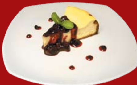
Чизкейк 000.- классический десерт на основе сыра Филадельфия