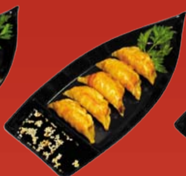
Гёза 310.- обжаренные японские пельмени (креветка или свинина)