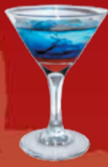
Призрак 190.- вермут, джин, Блю Кюрасао, гранатовый сироп