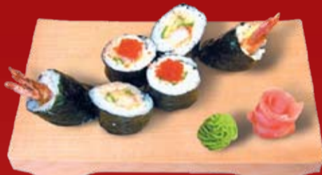
Динамит Маки 220.- креветка темпура, огурец, острый соус