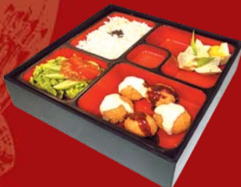
Усиокю Бенто 210.- рыбные шарики с соусами Хирекацу и Куриму