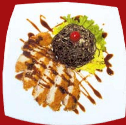
Тонкацу 420.- классическая японская свиная отбивная с куриной грудкой, обжаренная в сухариках с соусом Тонкацу и гречневой лапшой соба