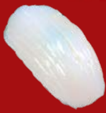
Ика 100.- кальмар