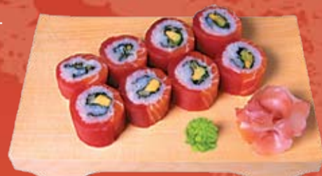
Радуга Маки 430.- лосось, тунец, огурец, авокадо