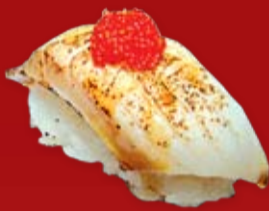
Идзуми Тай 95.- морской окунь