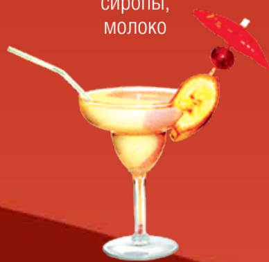
Футари 170.- банан, дыня, гренадин, молоко, мороженое