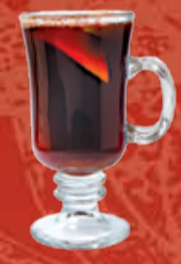
Глинтвейн Классика 250.- красное вино, мед, корица и гвоздика, фрукты