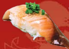
Хамачи 150.- желтохвостик