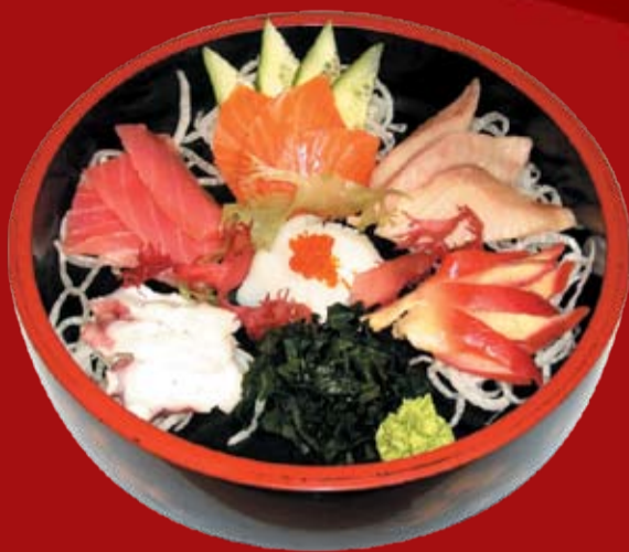
Такэ 000.- сашими из: тунца , лосося, осьминога, кальмара, маллюска хоккигай, желтохвостика