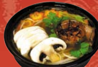
Симафури Рамейн Супу 310.- лапша рамейн, мраморная говядина, шампиньоны