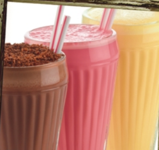
МОЛОЧНЫЙ КОКТЕЙЛЬ шоколад, клубника, банан