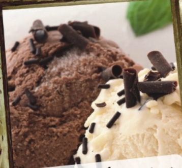
МОРОЖЕНОЕ шоколадное, ванильное