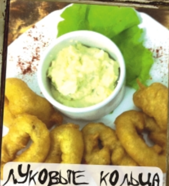
ЛУКОВЫЕ КОЛЬЦА в пивном кляре с соусом