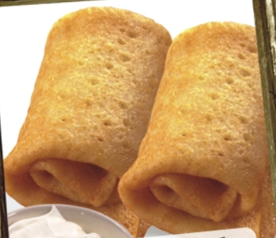
ДОМАШНИЕ БЛИНЧИКИ подаются со сметаной