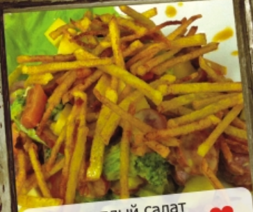
теплый салат BEERLIN ❤️ колбаски, картофель, томаты, сыр, брокколи, яйцо, фирменный соус