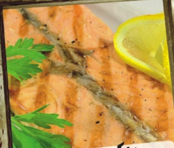
СТЕЎК ИЗ СЕМЪИ с рисом, салатом, лимоном и соусом