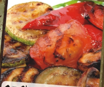
ОВОЦИ-ТРИЛЬ перец болгарский, цуккини, помидор, баклажан, чесночный соус