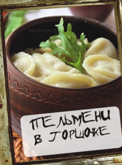
ПЕЛЬМЕНИ В ГОРШОЧКЕ