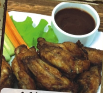
КУРИНЫЕ КРЫЛЬЯ с соусом