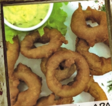
КОЛЬЦА КАЛЬМАРА в пивном кляре с соусом