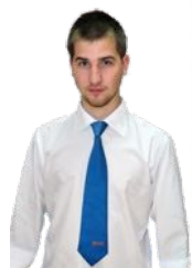
Райт на фурнитуре