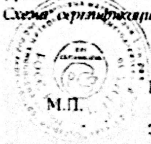
Схема сертификации № 3. Инспекционный контроль: не позднее - марта 2012г.